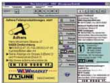
Die mehrsprachigen CD-ROM's von „Wer liefert was?“ ermöglichen die direkte Kontaktaufnahme zu Lieferanten aus dem Programm heraus

Mit CD-BOOK erhalten Einkäufer jetzt mehrsprachige Produkt-, Dienstleistungs- und Unternehmensinformationen potentieller Lieferanten auf CD-ROM. Die 248,- DM teure Westeuropa-Version umfaßt ca. 184 000 Unternehmen aus