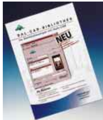
Die DAL-CAD-Bibliothek ist eine AutoCAD-Applikation für Windows 95 und NT