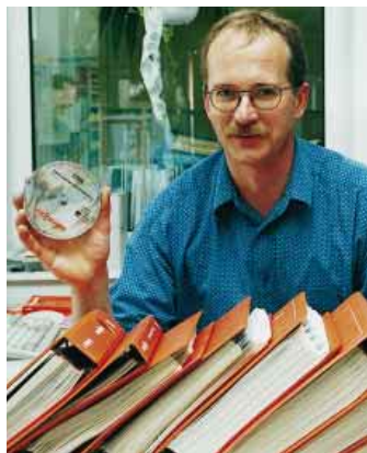
Die kleine runde Scheibe enthält Infos zu Viessmann-Ersatzteilen und ersetzt viele tausend Katalogseiten

Bei „ETEK“ handelt es sich um eine Compact-Disc mit hoher Speicherkapazität. Die ca. 700 Megabyte entsprechen rund 350 000 Textseiten im Format DIN A4. So sind derzeit über 30 000 unterschiedliche Teile auf der CD-ROM gespeichert. Dabei sind alle bis zehn Jahre alten Produkte berücksichtigt, in einigen Fällen auch bis 15 Jahre. So ersetzt „ETEK“ die Bevorratung alter Ersatzteillisten. Das Programm ist logisch und systematisch aufgebaut. Es ermöglicht die Suche sowie die direkte Preisabfrage eines Einzelteils. Zudem kann für dieses