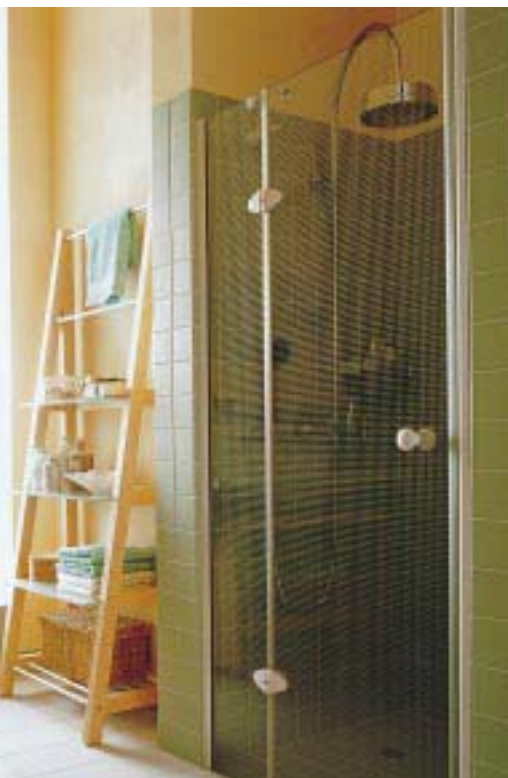
Dekorglas Karo für die Duschtrennungsserie 2003 von Hüppe

Speziell für die Duschtrennungsserie 2003 hat Hüppe jetzt das neue Designglas Karo im Programm. Hierbei werden feine, gleichmäßige Karos per computergesteuertem Sandstrahl an der Außenseite des Einschreibensicherheitsglases aufgebracht. Auf