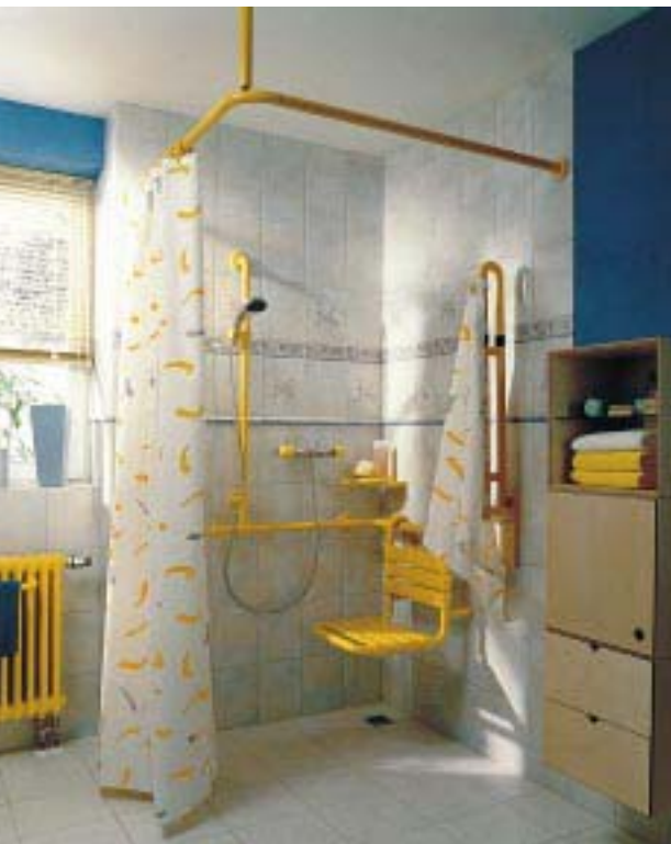
Barrierefreies Duschsystem von Hewi

gen braucht er nicht festgestellt zu werden, denn der Hebel arretiert beim Loslassen automatisch. Um den Halter mit individuell einstellbarer Neigung des Brausekopfes in die gewünschte Position zu bringen, genügt ein leichtes Drücken oder auch Ziehen. Die Bedienung kann von Rechts oder von Links erfolgen. Brausehalter wie auch das zugehörige Stangensystem, in das zusätzlich ein Duschsitz eingehängt werden kann, las-