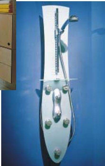
Duschpaneel Moonlight von Hansgrohe

Hansgrohe 77757 Schiltach Telefon (0 78 36) 5 10 Telefax (0 78 36) 51 25 12 eMail: info@hansgrohe.com