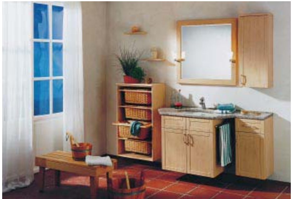
Mit Terrano setzt die Poggenpohl-Tochter auf mehr Wohnlichkeit im Bad

Waschtischlösungen entscheiden oder mit viel Spiegelfläche zusätzliches Licht ins Bad bringen. Beim Design setzt Picoli auf leicht nach unten gerundete Fronten. Sie sind von den Schranktüren bis hin zu den Spiegeln und Spiegelschränken bei allen Einzelementen wiederzufinden. Der Korpus ist immer Weiß. Die Fronten sind in den Dekorfarben Weiß, Birnbaum, Grün und Blau lieferbar. Alle modularen Elemente lassen sich selbst zusammensetzen. Die Ganzmetall-Clipscharniere sind dreidimensional verstellbar und die Türen können ohne Werkzeug ein- bzw. ausgehängt werden. Zum Programm gehört passendes und z. T. integrierbares Zubehör, wie Handtuchhalter, Wäschekippe und Abfallsammler. Außerdem stellte das Unternehmen der