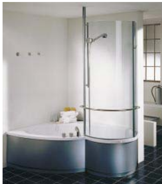
Kombinations-Eckwanne Focus mit Duschabtrennung Cora von Bette

Die auf der ISH erstmals vorgestellte Stahlemailwanne Focus wird jetzt auch mit Cora-Duschabtrennungstechnik angeboten. Dabei umschließt eine Echtglas-Duschabtrennung den Duschplatz der Stahlemail-Kom-