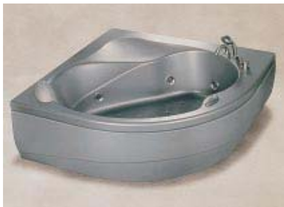
Box-Combine-2000 von Albatros

Eine stahlfarbene Acryl-Whirlwanne im Metall-Look war das Highlight auf dem Cersaie-Stand von Albatros. Die 150 x 150 x 57 cm große Eckwanne namens Onis wurde von Designer Marc Sadler kreiert. Sie verfügt über 14 Airpool- und 7 Whirlpool-Düsen sowie das exklusive Turbopool-System. Zur Ausstattung gehören auch ein digitales Steuerpaneel mit Kontrollinstrumenten, ein Unterwasserspot, eine Kopfstütze, ein anatomischer Sitz, Ablagemöglichkeiten sowie ein Desinfektionssystem. Außerdem stellte das Unternehmen eine asymmetrische Whirl-Eckwanne mit Duschkabine vor. Die Box-Combine-2000 ist in den Abmessungen 170 x 70/90 x 217