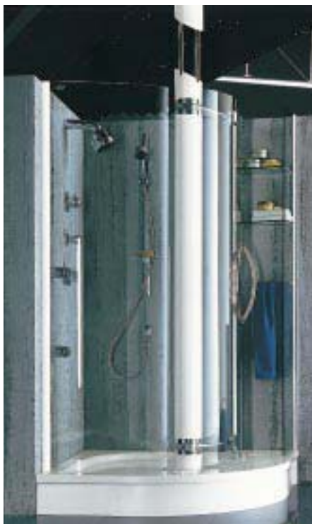
Luxusmodell Magna 5000 in Bicolor-Ausführung

Außerdem gibt's die Magna 5000 jetzt auch in Bicolor-Ausführung. Lieferbar ist sie in den Sanitärfarben Ägäis, Pergamon, Schwarz, Natura, Weiß, Bahamabeige, Jasmin