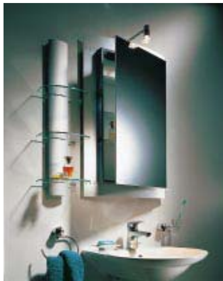
60er Spiegelschrank Hipline mit Halogenbeleuchtung