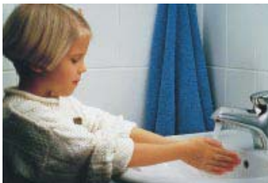
EIB-kompatible Waschtischarmatur Electra

Als weltweit erster Hersteller stellte Oras jetzt eine Electra-Waschtischarmatur als EIB-kompatible Komponente vor. Steuerfähige Parameter, wie Wassermenge, Störmeldung sowie Zentralsteuerung für Urinal-