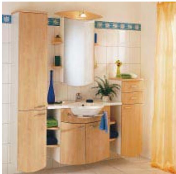
Modulare Möbelkollektion Picoli von Marlin

Picoli heißt die neue modulare Möbelkollektion von Marlin für kleine Bäder. Im Baukastensystem können die einzelnen Elemente je nach Platz- und Stauraumbedarf beliebig zusammengestellt werden. Je nach Raumhöhe kann man bei der Möbelserie unter verschiedenen Hoch- und Unterschränken wählen, sich für integrierte