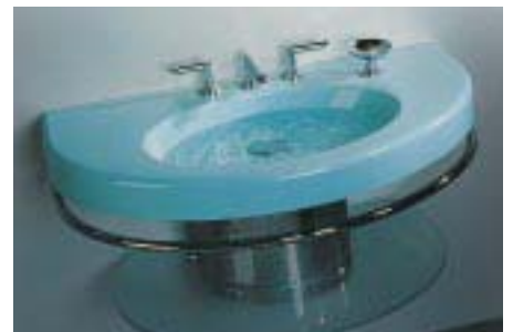
Mineralguß-Waschtisch Visio-S von SAM

Visio-S heißt die neue Waschtischlösung der Mendener aus harzgebundenem Mineralstoff. Sie ist aus einem Guß gefertigt und in den Farben Alpinweiß, Pergamon, Türkis, Granit-Hell, Granit-Dunkel, Seegrün sowie Nachgrau-Granit lieferbar. Zur Serienausstattung gehören eine Siphonab-