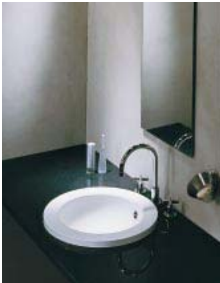
Aufsatzwaschbecken Linea 3 von Alape