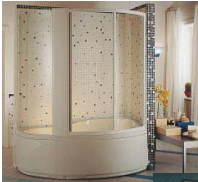
Acryl-Whirlwanne im Metall-Look

cm in Rechts- oder Linksausführung erhältlich. Ein kombiniertes Turbopoolsystem, 8 Whirlpooledüsen und 14 Luftdüsen am Boden, eine digitale Steuerung, ein Unterwasserspot, eine Kopfstütze sowie ein Desinfektionssystem gehören zum Lieferumfang der Acrylwanne. Die Duschkabine hat weitere 6 vertikale Wasserdüsen, eine komplette Brausegarnitur, Schiebewände aus gehärtetem Kristallglas sowie wahlweise einen Einhebelmischer oder Thermostaten als Wannenfüll- und Brausearmatur.