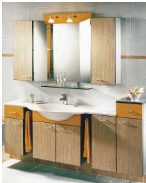
Flexibles Möbelprogramm Vario-Line von Sanipa

An eine junge, experimentierfreudige aber dennoch qualitätsbewußte Zielgruppe, die Spaß am Zusammenstellen und Gestalten hat, richtet sich die preiswerte Badmöbelserie Vario-Line von Sanipa. Die Kombinationsgrundlage bilden zwei neutrale Fronten in Wildbirne und Taxus. Akzente