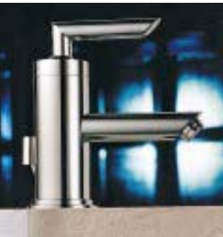
Einhebelmischer Eileen von Sam

deckung in Lochblechoptik und eine Clou Ab- und Überlaufgarnitur. Optional sind eine Handtuchreling sowie eine mattierte Glasablage erhältlich. Alle Metallteile gibt's in Chrom, Velourschrom oder Messing-Hell.