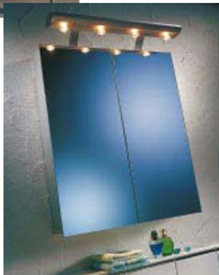
Spiegelschrank Quadraline von Schneider

Mit Hipline und Quadraline stellen die Laufburger zwei neue Spiegelschränke vor. Hipline gibt's als 80er und 60er Schrank, mit Leuchtstoff- oder Halogenbeleuchtung, mit oder ohne Regal sowie als Zweitürer in Weiß und Aluelox. Quadraline ist ein Spiegelschrank mit genietetem Alu-Zierrahmen, der durch die dominierende Spiegelfläche nicht auf Anhub als solcher zu er-