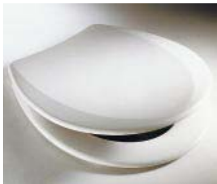
Duroplast-WC-Sitz Swing von Abusanitair

Trend, Viva und Swing heißen die drei neuen WC-Sitze des Rödentaler Kunststoffbetriebes. Alle drei sind mit dem patentierten Quick-Lock-Schnellmontagesystem ausgerüstet. Scharfe Kanten und Ecken wurden bei der Gestaltung bewußt vermieden. Beim Material setzt der Hersteller auf einen durchgefärbten, UV-beständigen, duroplastischen Kunststoff mit kratzfester Oberfläche. Die für den Objekt- bzw. Renovierungsbereich konzipierten Trend und Viva sind wahlweise mit Kunststoff- oder Edel-