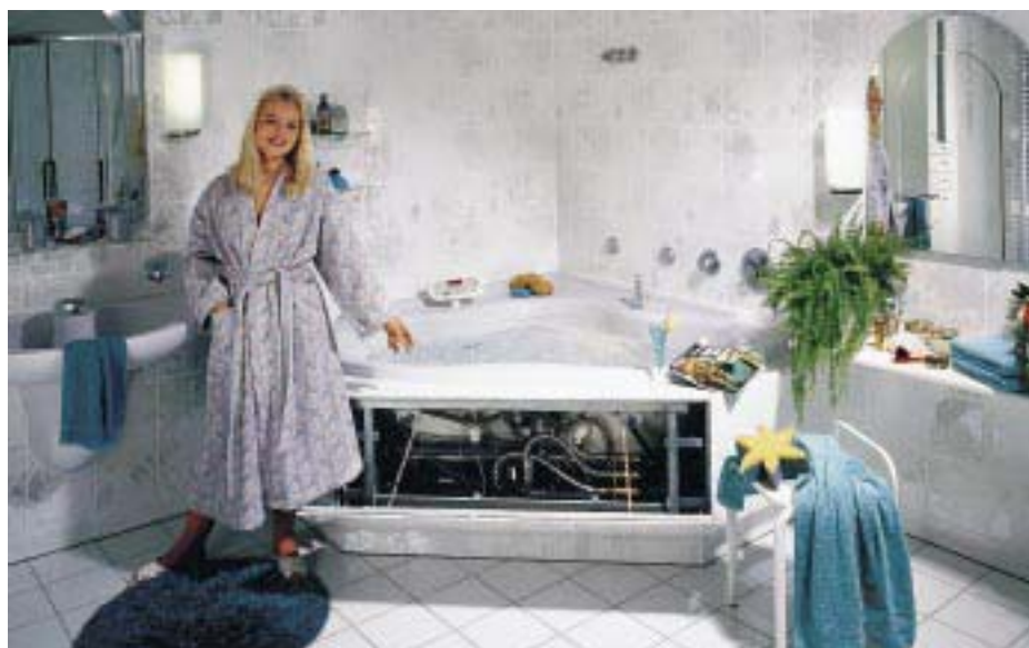
Whirlwannen-Einbausystem Variotop-Open von Mepa

Bette 33129 Delbrück Telefon (0 52 50) 51 10 Telefax (0 52 50) 51 11 30 eMail: info@bette.de