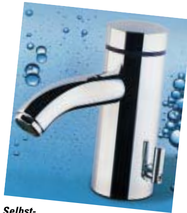
Selbstschlußarmatur Iqua-Tipolino B25 von Aquis

Während bei herkömmlichen Selbstschlußarmaturen ein mechanisches Hubsystem die Wasserlaufzeit bestimmt, übernimmt dies bei der neuen Iqua-Tipolino eine kompakte Mikroprozessor-Elektronik. Sie ist wasserdicht vergossen, benötigt keine beweglichen Teile und kommt mit einem Batteriewechsel in 6 Jahren aus. Zum Auslösen des Wasserflusses genügt ein sanftes Antippen der Start/Stop-Taste. Die Abschaltautomatik beendet den Wasserfluß, wenn er nicht bereits vorher durch nochmaliges Antippen gestoppt wurde. Je nach Einsatzgebiet kann die werksseitig auf 6 Sekunden voreingestellte Wasserlaufzeit werkzeuglos zwischen 2 Sekunden und 3