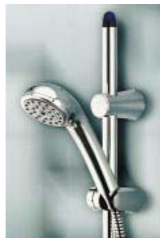
V-Wandstange von Kludi für unterschiedliche Bohrlochabstände

Kludi 58706 Menden Telefon (0 23 73) 90 41 70 Telefax (0 23 73) 90 43 04