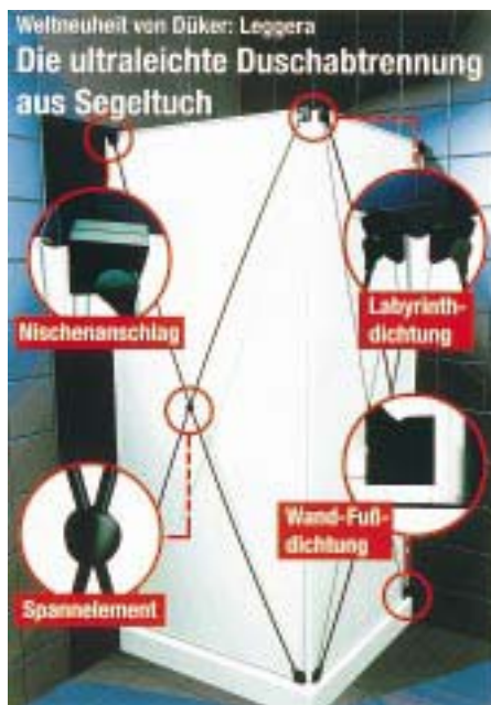
Duschabtrennung Leggera von Düker