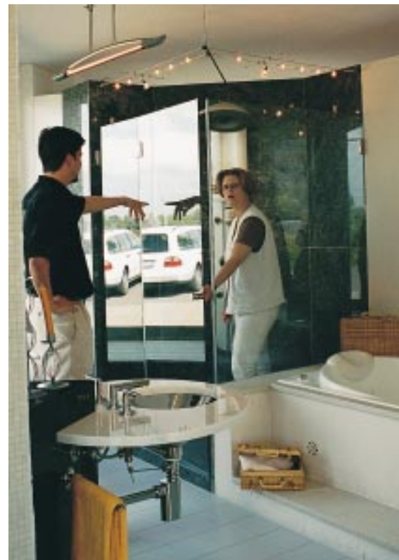
Die voll funktionsfähigen Luxusbäder im Wellnessbereich erlauben auch das Probepoolbaden