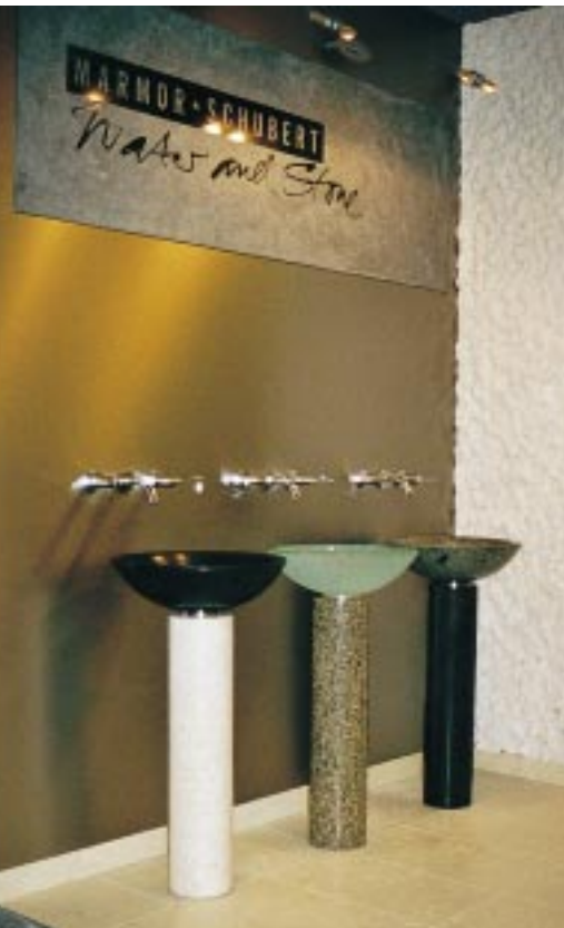
Drei Waschtische aus Naturstein und Glas bilden das Empfangskomitee des Wellnessbereiches