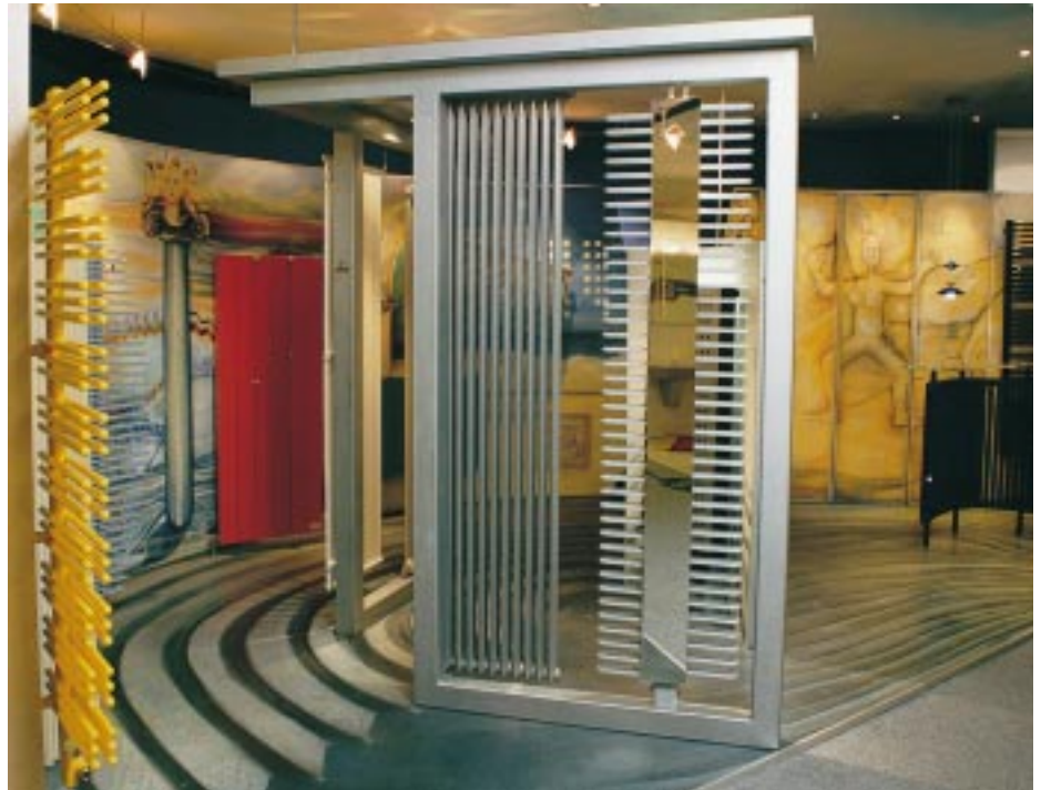
In der Heizkultur-Ausstellung werden diverse Designheizkörper vor ungewöhnlichem Hintergrund präsentiert