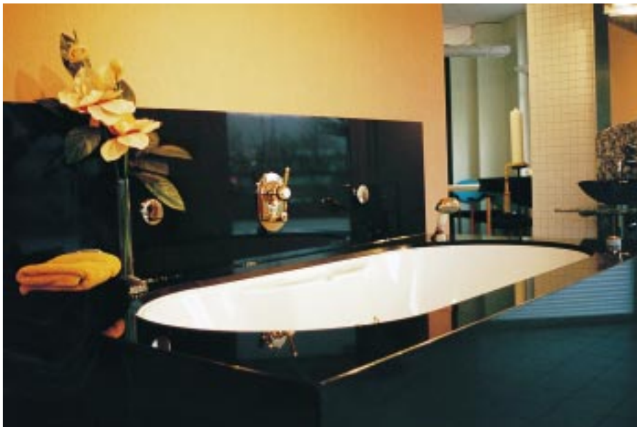
Luxuriöser geht's kaum: Whirlpool mit massiver Granitverkleidung