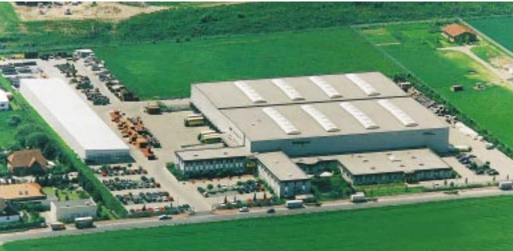
Vom 45 000 m 2 großen Firmengelände in Ronnenberg-Empelde liefert Holtzmann „just in time“ 20 000 Sanitär-, Zentralheizungs-, Installations- und Tiefbau-Artikel sowie Werkzeuge und Küchen

sene Bereiche zu schaffen. Hier findet man einen recht umfassenden Überblick über Spiegelschränke, Leuchten, Aufsatzbecken oder auch Armaturen.