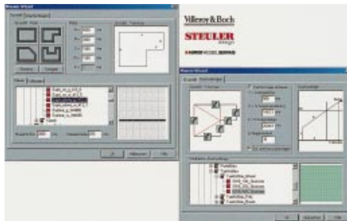
Mauern- und Dachschrägen-Wizard mit Markenfliesen in AmbiVision von M 3 B

Oventrop 59939 Olsberg Telefon (0 29 62) 8 20 Telefax (0 29 62) 8 24 00 Internet: www.ventrop.de