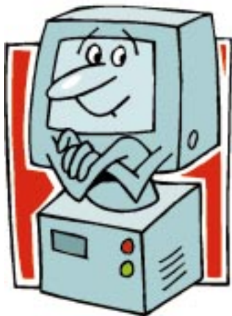
Zum Prüfen der Jahr-2000-Tauglichkeit der EDV-Systeme bietet Datext einen kostenlosen Vorort-Computer-Check an

Zum immer brisanter werdenden Thema Jahr-2000-Tauglichkeit der EDV-Systeme bietet das Branchensoftwarehaus Datext einen kostenlosen Vorort-Computer-Check an. Bei dieser Untersuchung wird die eingesetzte Hardware auf die Fähigkeit zum Wechsel ins nächste Jahrtausend eingehend geprüft. Dem Anwender werden konkrete Lösungsvorschläge unterbreitet und bei deren Umsetzung geholfen. Laut Anbieter soll dieses Angebot nicht nur Datext-Kunden gelten, sondern für alle Anwender von Branchenlösungen im SHK-Handwerk. Zur Frage, ob diese Aktion nicht den Kosten- und Organisationsrahmen sprengen würde, meint