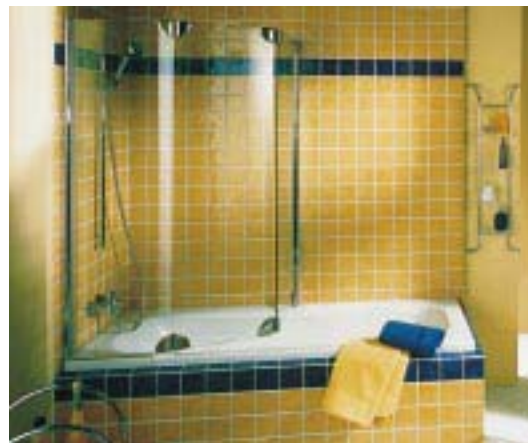
Combinett-3000-C mit hinterem Anschlag

Mit der Produktfamilie Combinett-C stellt das Unternehmen drei Duschabtrennungen vor, die auf der Mitte der langen Badewannenseite montiert werden. Sie können