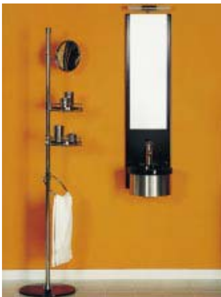
Multifunktionssäule Solist von Alape

Becken ist auch das Einbauwaschbecken Topline-Nr.-3 lieferbar. Der Waschtisch mit Becken, Natursteinplatte und offenem Massivunterschrank mißt 850 x 1000 x 580 mm