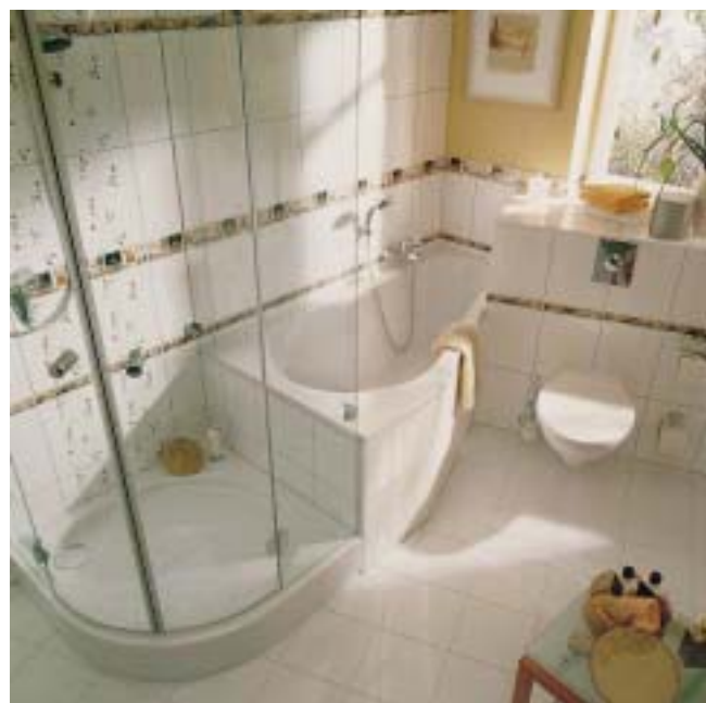
Bade- und Duschwanne Primera von Keramag

Mit einem preisgünstigen Baukastensystem von 8 Bade- und 5 Duschwannen wollen die Rätinger im Acrylwannenmarkt Fuß fassen. Die Palette reicht von ovalen Badewannen über recht-, sechs- und achteckige Formen bis zu symmetrischen und asymmetrischen Eckversionen. Allen gemeinsam sind die breiten Randflächen und ein Mittelablauf. Als Kombinationsmöglichkeit sind 65 mm tiefe Rund-, Eckrund- sowie Fünfeck-