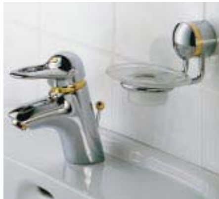
Barolo-Dekorvariante zur Allegroh-Novo

Das Vertikalsystem Linea erweiterten die Lingener jetzt um die Version Linea-Decor. Mit 17 verschiedenen Dekorvarianten las-