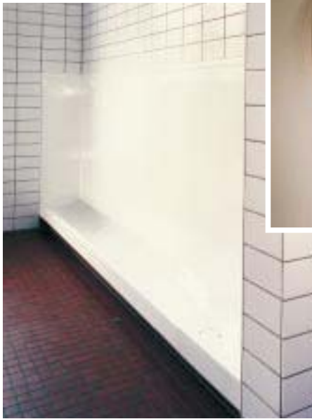
Wasserlose Urinale der Ernst AG als Standanlage und Einzelbecken

Die Urinale der Schweizer Ernst AG sind als Standanlage oder Einzelbecken erhältlich und kommen vollständig ohne Wasser aus. Dazu wird die herkömmliche Wasserspülung beim System-Ernst durch zwei Komponenten ersetzt: Den Spezialsiphon und die Hygienebeschichtung. Kernstück ist ein Si-