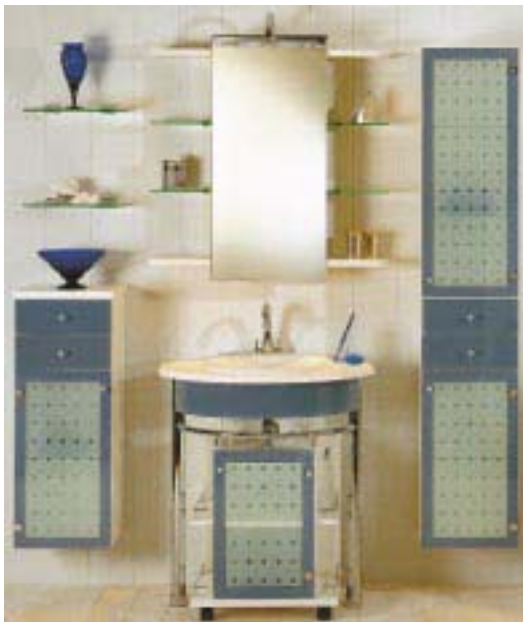
Badprogramm function-exclusiv von Nolff

Das neueste Badprogramm function-exclusiv der Murrhardter soll mit einem zeitgemäßen, frischen Design, den unkonventionellen Materialien sowie großer Flexibilität Gestaltungsmöglichkeiten in kleinen Bädern eröffnen. Die Fronten aus Sicherheitsglas sind in Weiß oder Taubenblau ab-