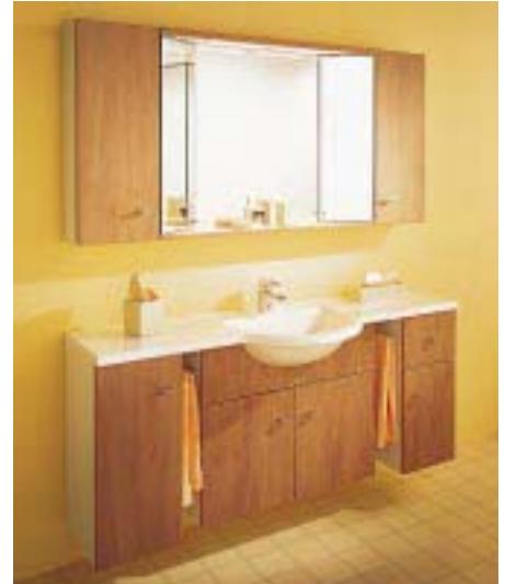
DuraSpeed-Möbelset mit Minera-Waschtisch

gramm um ein Waschtischprogramm aus Mineralgüß. Zur Einführung der neuen Minera-Waschtische haben die Hornberger in Kombination mit dem Duraplus-Möbelpro-