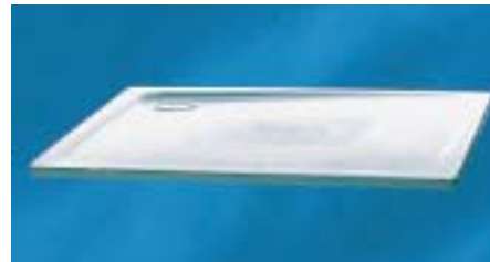
25 mm hohe Topas-superflach mit Anti-slip-Email

Die neue Topas-superflach ist 25 mm tief und in den drei Abmessungen 900 × 900, 1000 × 1000 sowie 1200 × 1200 mm lieferbar. Sie ist schallisoliert, hat einen Ab-