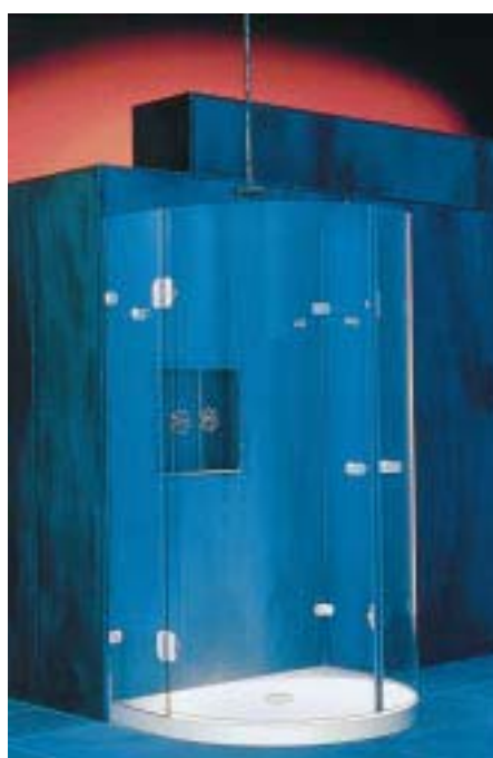
Halbkreisdusche Atelier-2-TS-NH für die Duschwanne New-Haven

Die Halbkreisdusche Atelier-2-TS-NH wurde speziell für die Duschwanne New-Haven der gleichnamigen Keramikserie von Villeroy & Boch entwickelt. Sie besteht aus zwei festen Teilen, zwei gebogenen Drehtüren und zwei Glasablagen. Die Kreisdusche