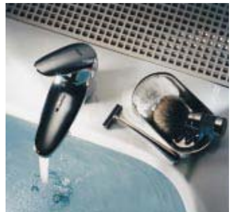
Rundlicher gewordene Eurodisc von Grohe

Der Armaturenklassiker Eurodisc soll ab Januar 1999 mit geliftetem Gesicht erneut durchstarten. Weg von Kanten, hin zu runderen, organischen Formen heißt die Devise. Das verdeutlicht sich be-