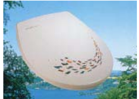
Designsitz Celebration von Pressalit

Pressalit 25451 Quickborn Tel. (0 41 06) 7 80 93 Fax (0 41 06) 7 42 46