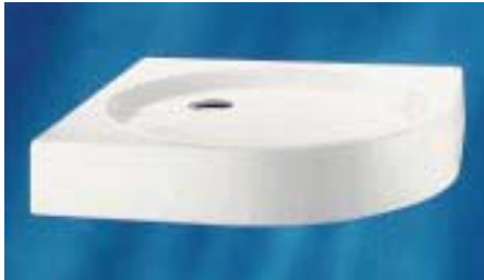
Duschwanne Zirkon von Bamberger mit angeformter Verkleidung

kon und Topas auf Wunsch auch mit angeformter Verkleidung sowie die Komfort-Badewannen des Herstellers ab Werk mit passendem Poresta-Wannenträger erhältlich.