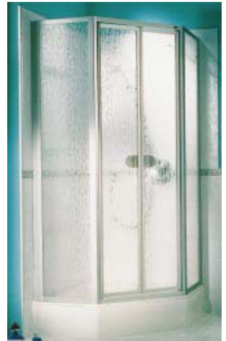
Penta-501 von Hüppe

auch flach weggeklappt werden, wenn die Armaturen am Kopfende der Wanne sitzen. Ausgeklappt rasten die drei Segmente in ein Magnetprofil ein, das über der äußeren Ecke der kurzen Wannenseite montiert ist. Die voll gerahmte Combinett-1000-C wird ausschließlich in den Profilarben Mattsilber und Weiß geliefert, die 2000-C zusätzlich in neun weiteren Sanitärfarben. Das ungerahmte Echtglasmodell 3000-C bietet außerdem die Option auf Echtchrom für Wandanschlußprofile und Scharniere. In klarem Echtglas gibt's alle drei Varianten, die Modelle 1000 und 2000 auch in Kunstglas und die Modelle 2000 und 3000 wahlweise in Anti-Plaque-Ausführung sowie auf Maß. Ansonsten liegt die Serienhöhe bei allen Versionen bei 1480 mm. Die neue Penta-501 ist eine Fünfeckduschabtrennung mit feststehenden Seitenteilen und Pendeltüren. Sie ist mit einer Serienhöhe von 1800 mm nach Herstellerangaben