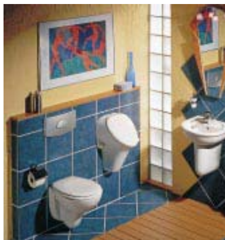
Preiswerte Design-Renovierungslinie SanReMo

Speziell für den Ausschreibungsbereich hat der Hersteller eine komplette Sanitärserie in sieben Sanitärfarben entwickelt. Ihr bezeichnender Name SanReMo setzt sich aus