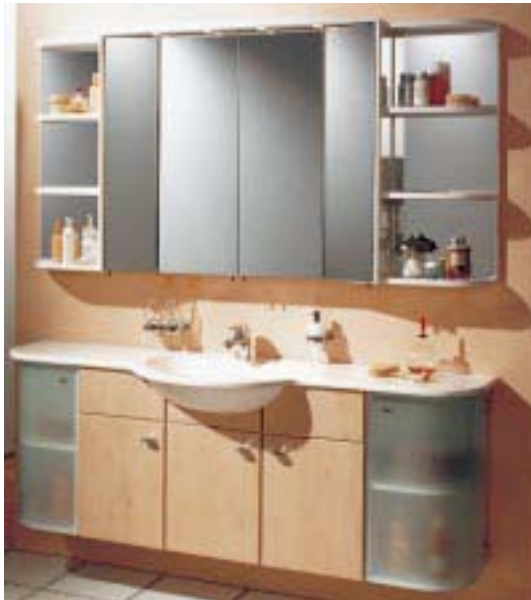
Elegance-Badmöbel in Wildbirne mit Viertelkreis-Abschlußunterschrank und Waschtisch mit sichtbarer Kummel

Zur Badmöbelkollektion Elegance gibt's jetzt auch Waschtische mit sichtbarer Kummel. Die fünf Ausführungen werden sowohl