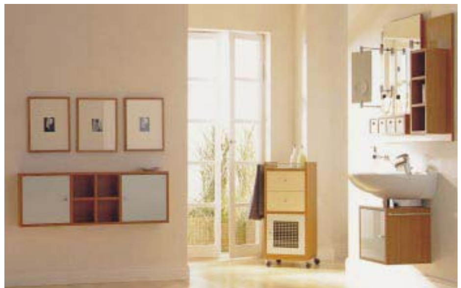
Einzelmöbelprogramm 4 × 9 von Duravit

Duravit 78128 Hornberg Tel. (0 78 33) 7 00 Fax (0 78 33) 7 02 89 eMail: info@duravit.de http://www.duravit.de