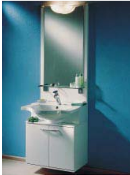
Piccolo-Kombination aus Waschtisch, Unterschrank und Lichtspiegel

Zu den gemeinsamen Merkmalen des komplett neuen Spiegelschrank-Sortiments Galaxis gehören Halogen- bzw. Glühlampen, doppelseitig verspiegelte Drehtüren, verstellbare Kristallglasböden sowie integrier-