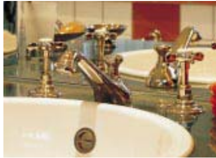
Schon für 1180 Mark gibt's die antikgoldene 3-Loch-Waschtischarmatur mit Kreuzgriffen aus der Serie Edwardian von Tap Company

cessoires englischer Topmarken für Küche und Bad. Mit ihrem unnachahmlichen „Touch of Class“ hat die stilvolle Handwerkskunst in vielen hochherrschaftlichen englischen Haushalten – auch bei Mitgliedern des englischen Königshauses – bereits ihren Platz gefunden. Wie ihre vor 140 Jahren erstmalig gefertigten Vorgänger, werden die originalgetreuen Armaturen von Hand poliert. Das Ergebnis sind kostbar-schwere Wasserhähne, Duschköpfe und Badewannenarmaturen, die in Antik-Gold, Chrom und Nickel funkeln. Waschtische und Badewannen aus Materialkombination