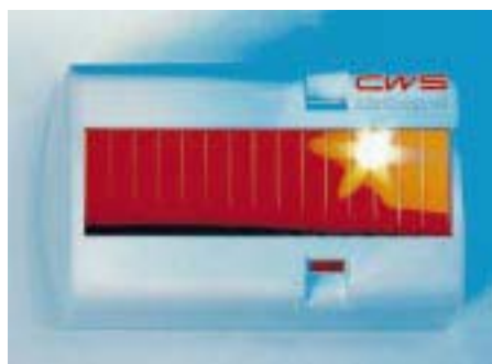
Zusatzbeduftung AirControl von CWS

Während die Zusatzbedufter Solar und Universal der neuen Generation AirControl III auf Geräusche oder in programmierbaren Zeitintervallen mit Nachtsparschaltung rea-