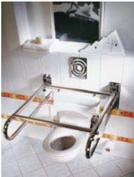
WC-Doppelstützkombination mit integrierter Rückenstütze

Mit einem Schlaufenklappgriff, einer speziellen Rückenstütze für das WC und einer Doppelstützkombination ergänzte der Hersteller sein Programm ergonomischer Griffe gemäß DIN 18 024 und 18 025. Je nach Grad der Behinderung bietet z. B. die multifunktionale Schlaufenform zahlreiche