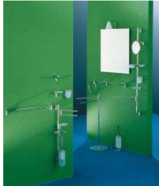
Accessoires-Serie Luna von Colombo

Die von Carlo Bartoli gestaltete Accessoireserie Luna ist eine komplette Badeinrichtungslinie zur Wandmontage oder Säu-