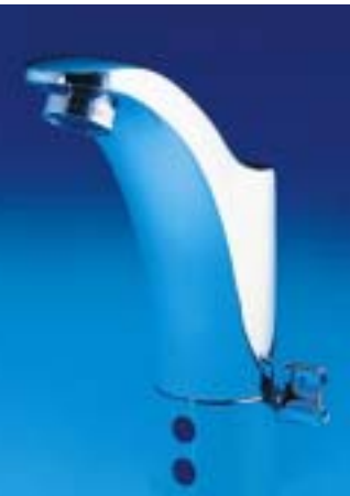
Optoelektronische Protronic-Armatur von Aqua mit Echtglaslinsen

im Vollmetall-Standauslauf mit diebstahlsicherem Luftsprudler untergebracht. Die Temperatureinstellung erfolgt über einen kleinen Mischhebel. Zur weiteren