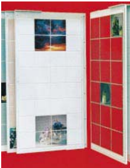
Mit Photos beschichtete Fliesen von Ariane

Das Schweizer Unternehmen stellt Tafel- und Wandfliesen her, die per Sublimationsverfahren mit Photos bedruckt werden. Keramikmischbilder als glänzende oder matte Innenwandbeläge in den Größen 20 × 20, 30 × 30, 40 × 40 oder 80 × 80 cm können aus Kacheln verschiedener Größe von 5 × 5 bis 20 × 20 cm zusammengesetzt wer-