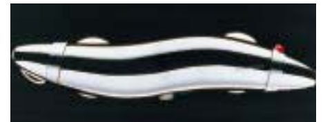
Millenium-Thermostat für die Dusche