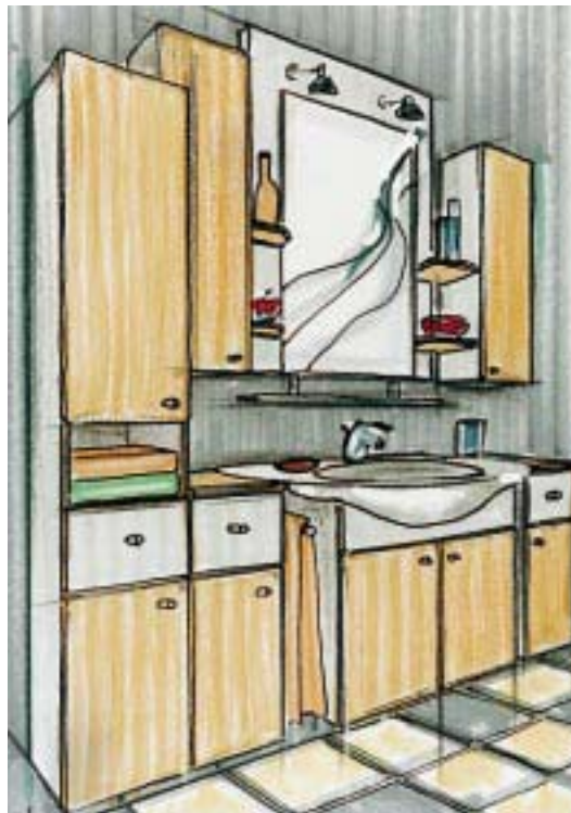
Vario-Line-Entwurf von Sanipa

Unter der Bezeichnung Vario-Line (VL) präsentieren die Treuchtlinger ein flexibles Badmöbelprogramm, das gemäß seinem