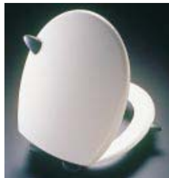
WC-Sitz Diablo mit Hörnchen und Zigarre

Außerdem präsentierte das Unternehmen unter dem Namen Celebration jetzt einen Design-Deckel, der auf dem Modell 3500 mit Universalscharnier basiert. Das Dekor mit den über den weißen Deckel verteilten farbigen Konfettistückchen wurde vom dänischen Grafiker Finn Hjernø geschaffen. Ein Teil des Verkaufserlöses geht an den schleswig-holsteinischen Landesverband der deutschen Multiple Sklerose Gesellschaft.