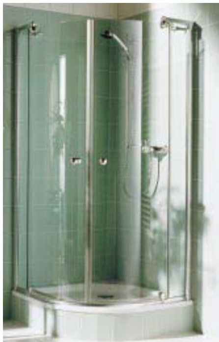
Modul-Spritzschutz Siesta in Viertelkreis-Ausführung

Außerdem stellten die Plattlinger mit Siesta ein Modulsystem von Duschabtrennungen fürs mittlere Preissegment vor. Die ungerahmten Schwingtüren mit Festfeld bestehen aus Echtglas in klarer oder strukturierter Ausführung. Im Einzelnen besteht das System aus den neun Elementen Festfeld,