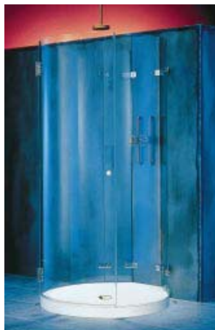
Kreisdusche Atelier-T-45-PS für Philippe-Starck-Bäder

sche Atelier-T-45-PS macht sich dagegen für Philippe Starck stark. Mit nur einer gebogenen Glas-Drehtür und den ebenso neuen, minimierten Atelier-Beschlägen, scheint der Echtglas-Zylinder fast unsichtbar über