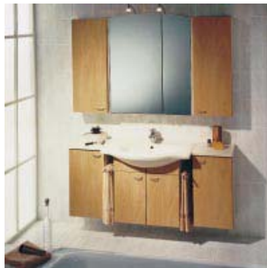
akzent-plus von Schock mit Apfeldekor, Keramikwaschtisch antibes und neuem Spiegelschrank capri-plus

Außerdem stellten die Treuchtlinger kürzlich mit dem Namenszusatz light eine Erweiterung zum bestehenden arcade-Programm vor. Sie soll die Designlinie einer breiteren Käuferschicht zugänglich machen. Bei angeglichenen Typenplänen liegen die Unterschiede in den thermofolierten Fronten. Sie sind in Weiß, Jasmin, Weiß-fantasy und Birnbaum lieferbar. Zu Weiß und Jasmin können mit Strukturlack Taubenblau oder Mintgrün Akzente gesetzt werden. Zusätzlich gibt's ein neues Kranzprofil mit eingesetztem Frontbogen in diversen Farben. Es kann auch in Kombination mit dem Trapezspiegel, dem Spiegelschrank 3-D sowie dem Flächenspiegel gewählt werden.