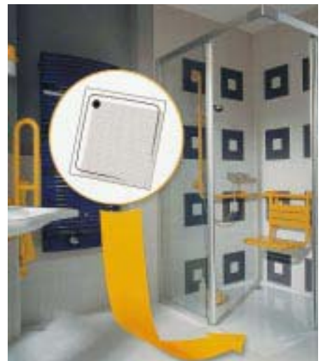
Kaldewei-Duschwanne Superplan mit Voll-Antislip

einer bis auf den Wannenspiegel hochgezogenen Voll-Antislip-Emaillierung an. Diese besteht aus einem Email mit ausgeprägter Oberflächenstruktur und wird fest eingeebrannt. In dieser Ausführung erfüllt die Duschwanne die Anforderungen der Bewertungsgruppe R11 nach DIN 51 130 sowie die Kriterien der Bewertungsgruppe B nach DIN 51 097 und trägt das Konformitätszeichen „DIN barrierefrei“. Mit einer