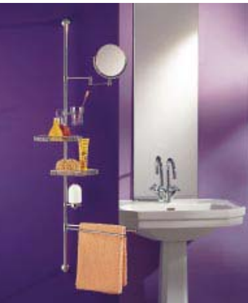
Multifunktionale Accessoire-Lösung Space-Bord von Giese

Das neue Space-Bord von Giese basiert auf vier Wandstangen von 600 bis 1200 mm Länge. Der Rest ist individuell zusammenstellbar aus Kosmetikrondellen mit oder ohne Reling, Ablagekörben mit oder ohne Glasplatte, Handtuchhaltern, Seifenspendern, Rasier- und Kosmetikspiegel mit einem Durchmesser von 160 mm, Seifenablagen, Föhnhaltern sowie ein- und zweiseitigen Glashaltern mit Kristallglas. Anzahl und Abstände der Accessoires sind variabel. Alle Teile sind höhenverstellbar und in