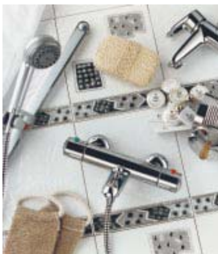
HQ-Programm von Hansgrohe für Hotels

Kermi 94447 Plattling Tel. (0 99 31) 50 10 Fax (0 99 31) 30 75 http://www.kermi.de