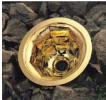
Vergoldetes Metallwaschbecken von Nevobad

Mit warmen Oberflächen will das Unternehmen jetzt Metallwaschbecken von ihrem kalten Edelstahl-Charme befreien. Dazu werden handgetriebene Becken als Einzelstücke in verschiedenen Formen und Oberflächen angeboten. Zum Programm gehören z. B. runde, rechteckige und achteckige Beckentypen in den Oberflächen Chrom,