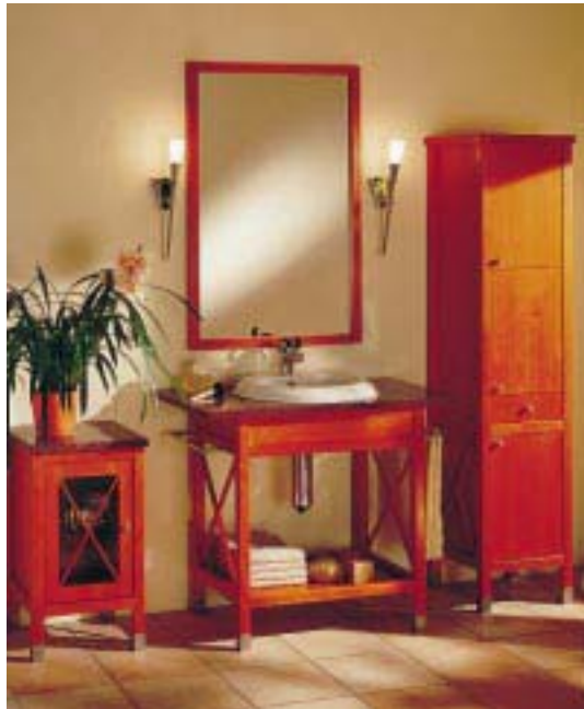
Badmöbel Country-Classic im Landhausstil

Auf Basis von Tisch- und Schranksolidität sind bei der Serie Country-Classic massives, im Kirschbaumton gebeiztes und hartwachsversiegeltes Holz, rotbrauner Granit und weißes Aufsatzwaschbecken aus CeramoStahl kombiniert. Außer dem Melchior-