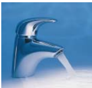
Waschtischmischer Talis-Elegance in Niederdruck-Ausführung

Unter der Signatur HQ präsentierten die Schwarzwälder jetzt ein spezielles Ausstattungsprogramm für das Hotelbad. Zum Sortiment gehören Aktiva-Hand- und Clubmaster-Kopfbrausen mit Durchflußbegrenzer-Set oder Ecostrahl, Metropol-Waschtischmischerarmaturen mit Durchflußbegrenzer auf 6 l/min., Ecostate mit Ecostop-Taste, Hand- und Kopfbrausen mit Quiclean- oder Rubit-Reinigungsfunktion sowie chemikalienbeständige Schieber und Wandstützen. Die Handbrausen