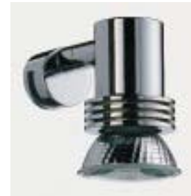
Halogen-Klemmleuchte mit 220-Volt-Anschluß von Emco

Auch die Harmonieserie Barolo-Dekor erhielt eine weitere Variante mit gewölbter Kappe und anschließender ringförmiger Einlage. Das neue Dekorelement für die Armaturen Idyll von Ideal-Standard und Allegroh-Novo von Hansgrohe ist wahlweise Ton in Ton oder in einer kontrastierenden Oberfläche lieferbar. Außerdem gibt es jetzt die 30teilige Accessoireserie Scala auch