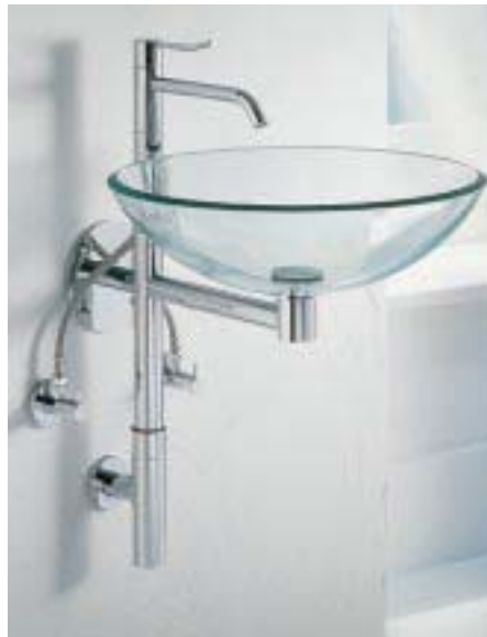
Wandbrunnen Pollux 1 mit Design-Siphon SO-30

Zu den bestehenden Waschtischplatten aus Varicor und Sicherheitsglas des Waschtisches Julia gesellt sich seit kurzem eine Holzplatte dazu. Mit einem Beckendurchmesser von 315 mm, Abstellfläche, Kristallspiegel, Handtuchhalter sowie Halo-