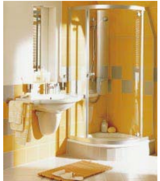
Viertelkreis-Duschkabine Bella von Kermi

Der Türanschlag kann Rechts oder Links vorgesehen werden. Schrägschnitte und Ausschnitte werden in den feststehenden, seitlichen Segmenten vorgenommen,