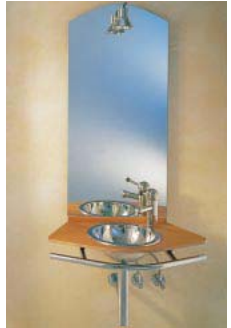
Komplettwaschtisch Julia von High-Tech mit Holzplatte

genleuchte kommt Julia mit einer Gesamttiefe von 405 mm aus. Als Eckmodell beträgt die Gesamttiefe bei gleichem Beckendurchmesser 420 mm und die Spiegelmaße