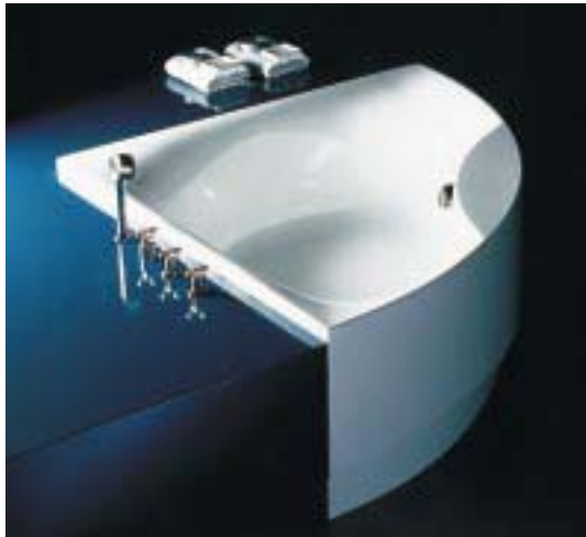
Eckwanne Squadra von Hoesch

Wannen dient der Aufnahme von Armaturen oder als Ablagefläche. Die Badewannen werden ohne Schürze, mit angeformter Schürze oder mit abnehmbarer Schürze und auf Wunsch auch mit der Verstärkung Ultracryl geliefert. Mit den Whirlsystemen der Dürener aufgerüstete Varianten gibt's allerdings nur ohne oder mit abnehmbarer Schürze. Wie die große Squadra 1500 verfügt auch das ebenfalls gleichschenklige Modell 1400 über zwei Sitzpositionen, je-