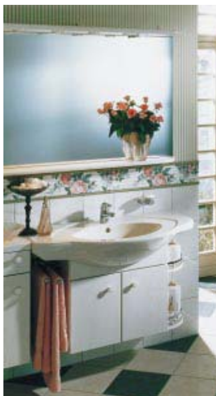
Möbelwaschtisch Lindos von Ideal-Standard

den Begriffen Sanieren, Renovieren und Modernisieren zusammen. Die Kollektion im unteren Preissegment umfaßt 55, 60, 65 und 70 cm breite Waschtische, ein Handwaschbecken mit 45 cm sowie einen 56 cm breiten Einbauwaschtisch. Zu den Waschbecken gibt es eine Stand- und eine Wandsäule, für das Handwaschbecken eine Wandsäule. Alle vier Waschtischgrößen sind mit oder ohne Hahnloch, jeweils mit oder ohne Überlauf, lieferbar. Sowohl Wand- wie Stand-WC, letzteres auch in Combi-Version mit Spültank, gibt es wahlweise als Tief- und Flachspüler. Außerdem gehören ein zusätzliches Tiefspül-WC mit 48 cm Ausladung, ein Standbidet sowie ein Urinal mit oder ohne Deckel zum Programm. Zur Kombination empfiehlt der Hersteller Cerasprint-Armaturen, Hotline-Acrylwannen und für das kleine Bad die Wannenslösung Twin-Set.