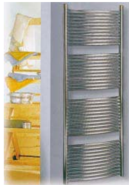
Edelstahl-Badheizkörper Avantgarde von Taifun

Unter dem Markennamen Taifun bringt die westfälische Sanitär- und Heizungs-Beratungsgesellschaft sechs neue Modelle von Badheizkörpern in acht RAL-Farben auf den Markt. Ihr Leistungsbereich liegt zwi-