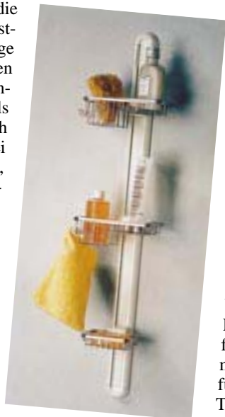
Duschablage von Artweger

A + S 71735 Eberdingen-Hochdorf Tel. (0 70 42) 87 80 Fax (0 70 42) 8 78 40 http://www.artweger.co.at