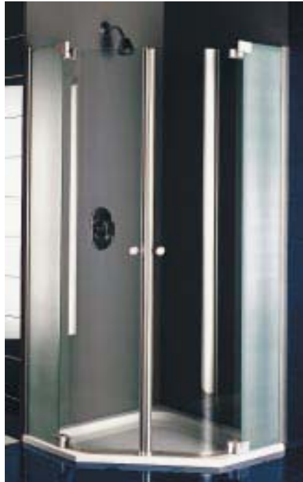
Fünfeck-Version der Clever-Duschtrennung

doch nur über eine Rückenschräge. Sie ist genauso wie die Squadra 1500 × 1000 in Rechts- und Linksausführung lieferbar. Erst seit kurzem als Duschtrennung aus rahmenlosem Echtglas für quadratische und