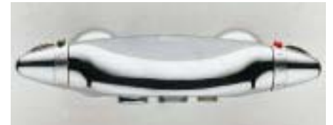
Badewannen-Thermostat Olympus von Alpi

Mit Olympus und Millenium bringen die Italiener gleich zwei neue, ergonomische Thermostate auf den Markt. Das Mischersystem mit besonders kleiner Kartusche ermöglicht eine fast stufenlose Wärme- und Wasserdurchflußdosierbarkeit per Soft-Touch. Die Thermostate aus gegossenem, verchromtem Messing sind in den Farben Metallic-Chrom, Schwarz-Matt-Chrom und