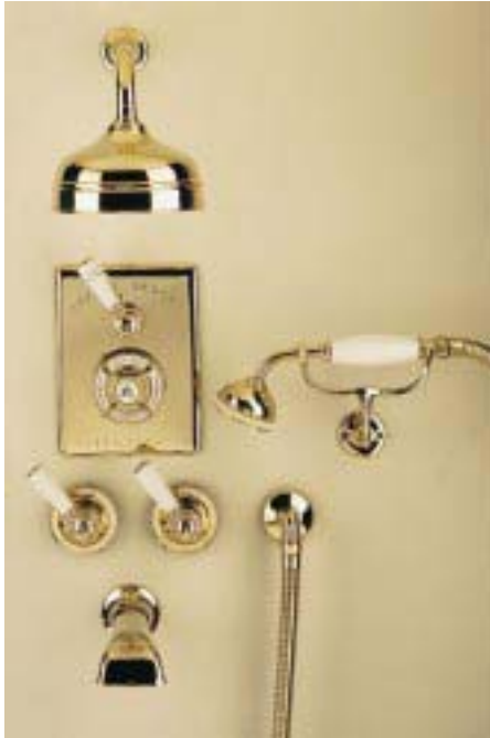
Handpolierte Thermostat-Duscharmatur aus der Godolphin-Palette in Antikgold mit Porzellangriffen für „schlappe“ 7060 Mark

Das Kölner Unternehmen importiert direkt aus England Armaturen, Waschtische, Wannen, Handtuchrockner und andere Ac-