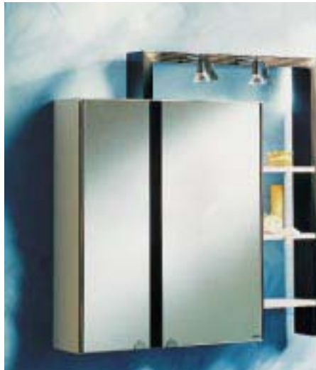
Spiegelschrank Saturn aus der Serie Galaxis von Duscholux

Zum Jahresende 1998 wartete der Badausstatter nochmals mit Sortimentsneuheiten auf, die sich auf alle Produktgruppen erstreckten. So erhielt die Preiswert-Dusch-