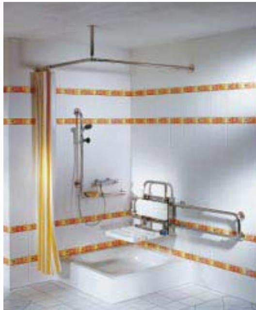
Verschiebbarer Duschsitz von Blanco

Greif- und Abstützmöglichkeiten. Als Basismaterial wird Chromnickelstahl verarbeitet. Die Edelstahlgriffe werden elektrolitisch gegläntzt, wobei die Materialoberfläche dauerhaft geschlossen wird. Der Farbauftrag der farbigen Griffe erfolgt durch eine Polyester-Epoxidharz-Pulverbeschichtung. Die bisherigen Farben Weiß, Beige, Manhattan und Rot wurden um die Standardfarben Gelb, Grün, Blau und ein dunkles Rot ergänzt.