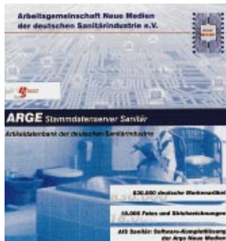
Mit der Schnittstelle „Bildverwaltung Arge Neue Medien“ von Programm-Standard stehen Großhändlern und Handwerkern neue Service-Möglichkeiten zur Verfügung

Fotos und Strukturzeichnungen sind wichtige Anhaltspunkte für Handwerker, die online mit