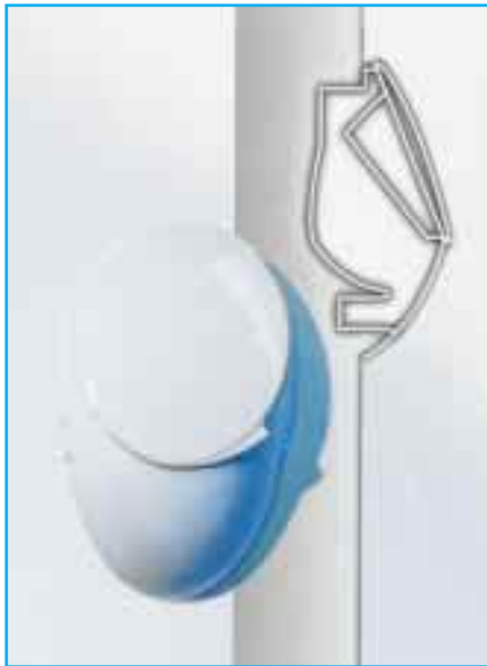
Wandhängendes Tiefspül-WC, Halbeinbau-Urinal und komplette Toilettengarnitur aus dem Joly-Programm

wie Renovierungsvorhaben geeignet. So kann z. B. der asymmetrisch geformte Waschtisch (60 x 34 cm) mit rechts- oder linksseitiger Ablagefläche variabel zur Wand- oder Eckmontage genutzt werden. Das ungewöhnlich tiefe Becken mit Zwangsablauf schafft trotz bescheidener Außenabmessungen viel Raum zum Händewaschen. Als Zubehör ist eine Siphonblende mit Glasablage lieferbar.