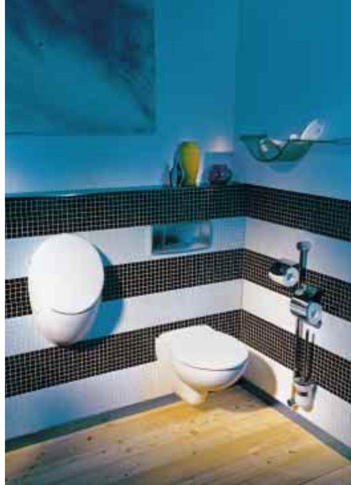
Meist kleiner als 2 m 2 , lassen sich im Gäste-WC alle benötigten Funktionen oft nur mit Spezialprodukten unterbringen

mit Halogenleuchten und integrierter Glasablage. Sie sind wahlweise in drei unterschiedlichen Dekoren lieferbar. Einen weiteren Blickfang schafft die Gästehandtuchablage aus wellenförmigem, satiniertem Glas, die getrennte Aufbewahrungsmöglichkeiten für frische und gebrauchte Gästehandtücher bietet. Alle Accessoires gibt es wahlweise in Chrom- oder Edelmessing-Ausführung.