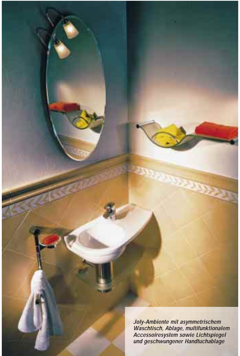
Joly-Ambiente mit asymmetrischem Waschtisch, Ablage, multifunktionalem Accessoiresystem sowie Lichtspiegel und geschwungener Handtuchablage

Mit ihrer Gemeinschafts- entwicklung Joly wollen Keramag und Keuco frischen Wind in deutsche Gäste- WC's bringen. Asymmetri- scher Waschtisch, gering ausladendes WC, Halbein- bau-Urinal und multifunktio- nale Accessoires sollen mehr Raumökonomie ermög- lichen und das Nachfragepo- tential mit pfiffigen Produkt- details und praktischem Ge- brauchsnutzen erschließen.