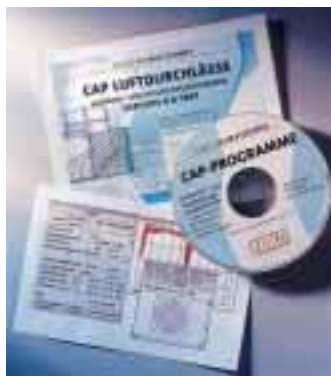
Für Ingenieure: Klimatechnik-CD-ROM von Emco

Die Sparte Klimatechnik der Lingener hat seine CAP-Programme weiterentwickelt und stellt ein Programmpaket zur Auswahl bzw. Auslegung von Luftdurchlässen und Konvektoren sowie zur Ermittlung des Summen-A-Schalldruckpegels in klimatisierten Räumen auf CD-ROM zur Verfügung. Neben der strömungs-, wärmetechnischen und/oder akustischen Auslegung des Raumes können