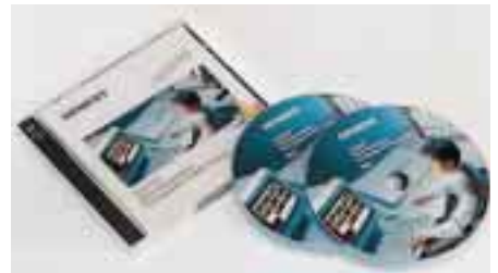
MSR-Handbuch mit Planungstools auf CD-ROM

Dokumentation der Massenermittlung einer neutralen Planung für Gebäudeautomation nach der aktuellen VOB/C DIN 18 386 und der VDI-Richtlinie 3814 Blatt 2. Gegenüber der ersten Auflage wurde das Werk auf rund 250 Anlagenlösungen erweitert. In einem neuen Kapitel Raumautomation beschreiben