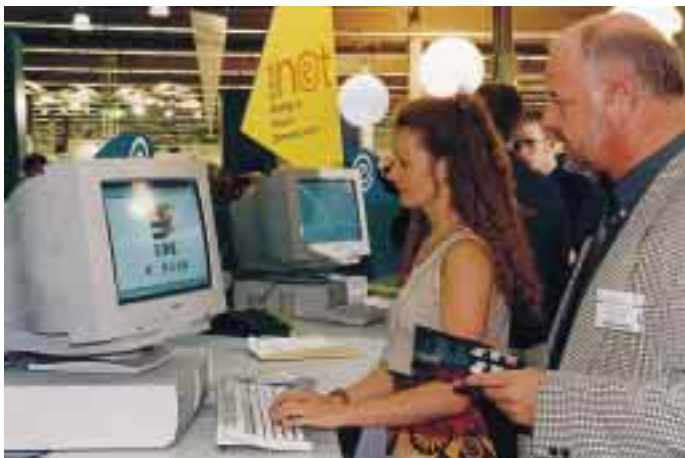
Vorstellung des EDE-net anlässlich der Nürnberger Einkaufsbörse

Neben „Industrie-Technik“ und „Arbeitsschutz“ sind ab sofort die Kataloge „Beschlüge“ und „Format für Sanitär und Heizung“ im EDE-net verfügbar. Über Suchkriterien wie Artikelbezeichnung oder Warengruppe wählt der Anwender die gewünschten Produkte in Text und Bild am Bildschirm aus und kann anschließend die Bestellung elektronisch versenden. Netz-Surfer haben inzwischen Zugriff auf rund 140 000 Artikeldaten von EDE-Lieferanten. Interessierte Mitgliedsfirmen können ein individuelles Artikelpaket vom EDE-Server auf den eigenen überspielen. Dann können Artikel um kundenindividuelle Preise aus der eigenen Warenwirtschaft ergänzt oder Mengenrabatte vergeben werden. Kunden der Mitgliedsbetriebe greifen dann nicht mehr auf den zentralen Rechner des Einkaufsverbandes zu, sondern bedienen sich aus dem maßgeschneiderten elektronischen Shop des einzelnen Händlers. Dieser erhält von Verbandsspezialisten auch Unterstützung beim Aufbau einer eigenen Intranet-Lösung, bei der Kunden- und Mitarbeiterschulung, der Entwicklung einer Nutzerführung oder bei der Verwaltung des Servers. Außerdem kann seit