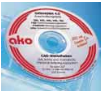
Die ako-CD-ROM beinhaltet eine 32-Bit-Applikation für AutoCAD 12/13. Hierfür ist Windows 95 oder Windows NT erforderlich

Für die Erstellung von Detailzeichnungen stellt Ako Rohre Systeme Technologien, Köln, eine CD-ROM mit Systembibliotheken der Produktgrup-