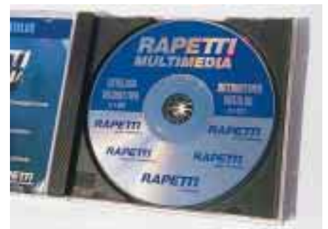
Auch in deutscher Sprache erhältlich: CD-ROM von Rapetti

Rapetti 65189 Wiesbaden Fax (06 11) 7 78 09 50