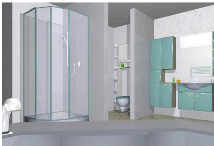
Für den „innova-BadPlaner“ gibt es jetzt das 1. Update

wendungen zur Verfügung. Zur Erweiterung der gestalterischen Möglichkeiten der Badplanung wird die Funktion Podeste ergänzt, wodurch die Darstellung in den Boden eingelassener Badewannen oder Duschen vereinfacht wird. Für die Fliesenpla-