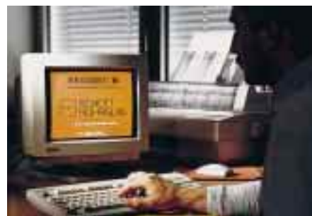
Das „Recusist“-Berechnungsprogramm wurde aktualisiert und erweitert

Das vor drei Jahren, nach Aktualisierung der DIN 4705, entwickelte „Recusist“-Berechnungsprogramm wurde dem aktuellen Stand der Schornsteintechnik angepaßt. Das neue Programm enthält u. a. einen grafischen Funktionsnachweis, d. h. die für die Berechnung der Abgasanlage wesentlichen Daten sind konzentriert zusammengefaßt. Neu aufgenommen wurde weiterhin der Teillastbetrieb.