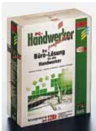
„PC-Handwerker Professional“ ist eine kaufmännische 32-Bit-Software für den Einsatz unter Windows 95 und NT