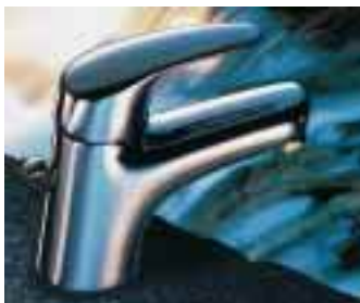
Cascada von Kaja

anten für Untertisch- und Wannenrandmontage. Alle Modelle sind für Gas- und Elektrodurchlauferhitzer geeignet, nach DIN 4109 in Geräuschgruppe I eingestuft und nach DIN 1988 eigensicher. Neu ist neben der Ge-