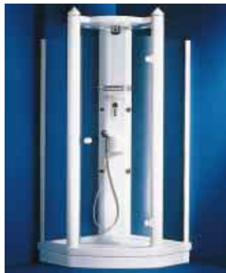
Als Einsteigermodell gibt's den Duschtempel 100 unter 8000 Mark

Gute 2500 Mark billiger ist die manuelle Ausführung des Einsteigermodells Duschtempel 100 . Er hat eine emaillierte Stahlwanne mit einer Seitenlänge von 100 cm und wird manuell oder über eine elektronische Tastatur gesteuert. Basis des Ganzen ist eine vormontierte Installationseinheit aus Thermostat, Kopfbrause, vier Seitenbrausen mit verstellbarem Strahlwinkel sowie eine Handbrause mit drei Strahlarten. Der Alu-Dachrahmen wird nur noch an drei Punkten aufgelegt und die Glastür schließt per Federcharnier von selbst.