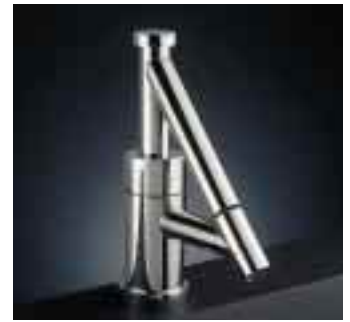
Verchromte Waschtisch-Einhandbatterie der Serie 4 von Jörger

phi . Sie paßt zum stilvollen Bad im Charme der Jahrhundertwende. Erhältlich sind Ein- und Dreilochbatterien für Waschtisch und Bidet, Aufputz- sowie Vierloch-Wannenfüll- und Brausebatterien, Wandwanneneinlauf, Eckventile, Aufputz-Brausebatterie, Unterputz-Ther-