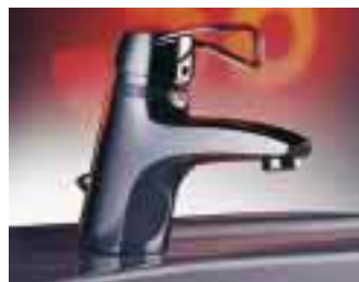
Evita – der Einhebelmischer als Thermostatarmatur

machen. Integriert sind eine Kopfbrause mit drei Strahlarten, vier Seitenbrausen und eine Handbrause, die thermostatgesteuert durch Umsteller kombiniert werden können. Der obere Teil des 120 mm tiefen Panels läßt sich aufklappen und bietet Ablagen für Accessoires. Für die Installation reichen die