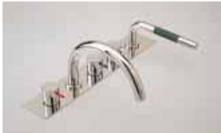
Vola-Wannenrandarmatur von High Tech

Allegra Premia mit Bügelgriff, Ausziehbrause, Quiclean und Kugelkartusche sieht der Hersteller als Premiumarmatur für die Küche. Besonderes Merkmal der um 360° schwenkbaren Allegra Starck sind ihre ursprünglichen