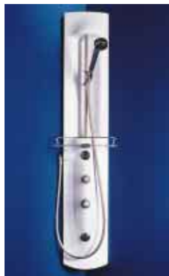
Aus Acryl und ausschließlich in Weiß lieferbar: Das Duschpaneel Comfort

schlüssel von oben befestigen. Für große Waschtische gibt es auch eine „Grande“-Version des Waschtischeinhebelmischers.