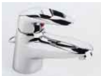
Vento-Einhebelmischer von Eichelberg mit Bügelhebel

Den Abwanderungsprozeß qualitätsbewußter Käuferschichten nach unten stoppen bzw. umkehren soll die in Frankfurt vorgestellte Mittelpreisarmatur Vento von Eichelberg. Das stilistisch neutrale Modell steht sowohl mit Voll- als auch mit Bügelhebel als Einloch-Waschtischversion, sowie UP- bzw. AP-Ausführung mit herkömmlichen oder verdeckten S-An-