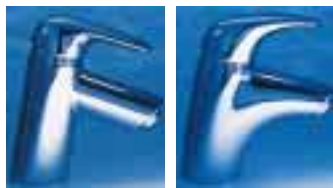
Talis Sportive und Talis Elegance von Hansgrohe

renkörper mit farbigen Griffen aus durchscheinendem Kunststoff. Phoenix Product Design will mit dieser Farb- und Formgebung ein mediterranes Lebensgefühl ansprechen und Assoziationen an das Meer wecken. Axor Steel heißt das komplette Edelstahl-Badausstattungspro-