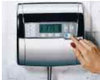
EBC heißt die erste vollelektronisch gesteuerte Armatur von Ideal Standard

Class , der Einhebelmischer des italienischen Designers Mario Bellini erhielt neue Griffe. Bisher ausschließlich in Chrom oder Gold gehalten, gibt es das Be-