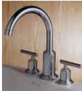
Zweigriff-Waschtischbatterie New Haven von Jado

Außerdem stellte das Unternehmen zur ISH einen Wannentower für freistehende Badewannen sowie eine Einhebelmischervariante der Armaturenserie Retro vor.