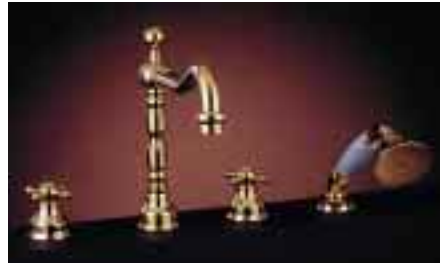
Im Stil der Jahrhundertwende: Delphi von Jörger

Exklusive Designarmaturen präsentierte die kleine aber feine Mannheimer Armaturen- und Accessoiresfabrik Jörger zur ISH in Frankfurt. Besonders ausgefallen: Die Serie 4 , ein Entwurf mit gänzlich eigenständigem, zeitlosem Auftreten für Freunde der avantgardistischen Stilrichtung. Neben Einloch-