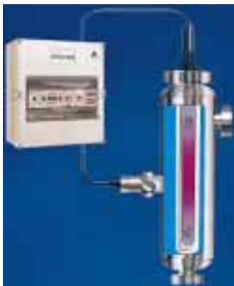
UV-Desinfektionsgerät Aquades von Aqua

Das unter dem Namen Grohe Aqua erst vor kurzem enger ins Konzernbild integrierte Unternehmen Aqua Butzke trat zur ISH wieder eigenständig unter dem Namen Aqua in die Öffentlichkeit. Das Logo besteht