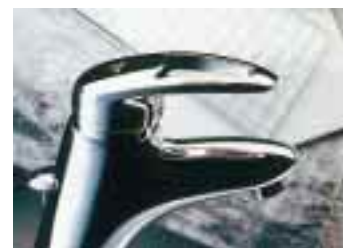
Zwischen Ceramix und Ceralux: Idyll von Ideal Standard

Ein typisches Kind der 90er Jahre ist die neue Ideal Standard-Serie Idyll . Die komplette Armaturenfamilie mit Batterien für Waschtisch, Bidet, Wanne und Brause – letztere in Unter- und Aufputzversion – rangiert preislich über dem Klassiker Ceramix No1 und besetzt damit das Mittelklassensegment unterhalb der Ceralux. Im Innern kommt die 47er Kartusche mit keramischer Mischtechnik zum Zuge. Außerdem kann der Installateur die Waschtischarmatur mit dem neuen, patentierten Kippmechanismus Top Fix per Inbus-