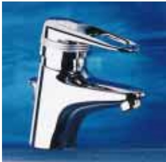
Europlus mit modifiziertem Outfit

tron mit und ohne Temperaturverstellung. Die Infrarot-Elektronik ist batteriegespeist und den nötigen Batteriewechsel zeigt eine Kontrollleuchte im Infrarotfenster an.