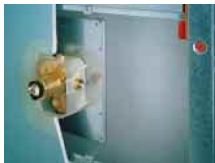
Unterputz-Einbausystem Hansavario mit Dichtmanschette

Das Unterputz-Einbau-System Hansavario war Thema auf dem Stand der Stuttgarter. Mit ihm stellt der Hersteller ein einheitliches Montageprinzip für alle seine Hebelmischer und Thermostate zur Verfügung. Das System besteht aus zwei Grund-