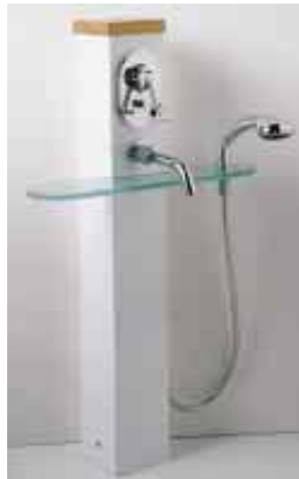
Der Wannentower von Jado für nahezu alle freistehenden Wannen

In Zusammenarbeit mit Villeroy & Boch entwickelte Jado die Armaturenserie New Haven . Sie ist in Chrom und Chrom/Velours als Hebelmischer-Linie sowie in einer Hebelgriff- und Kreuzgriff-Variante erhältlich. Durch drei weitere Griffelemente, Sockelringe und Farbkomponenten entstehen auf Basis der New Haven die Armaturenserien New Port, New Beach sowie New Bay.