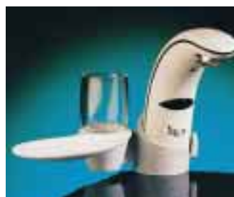
Iqua-Sensorarmaturen aus Enduran mit angeclipster Seifenschale und Glashalter

In Zusammenarbeit mit dem Materialhersteller General Electrics verpackte Aquis die Iqua-Sensorarmaturentechnik in Enduran. Heraus kam eine Armatur wie aus Stein gemeißelt. Der durchgefärbte Kunststoff hat zwar ein steinähnliches Aussehen, aber eine weiche, angenehme Haptik. Zusätzlich plant das