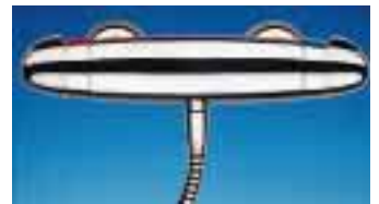
Der Ecostat 5001 hat im Innern eine Nickel-Titan-Feder mit Gitternetzstruktur

körper erhitzt. Der kleine Bruder des 5001 ist der Ecostat 1001 für Wannen und Brausen. Er hat eine Ecostop-Funktion, mit der sich der Wasserverbrauch um bis zu 50 Prozent reduzieren läßt so-