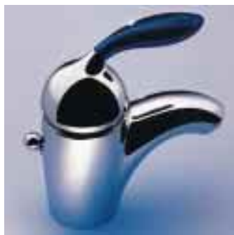
Kugelmischtechnik in neuem Outfit: Axor Azzur von Hansgrohe

Mit der Axor Azzur bringen die Schwarzwälder ein neues Kompletprogramm von Armaturen und passenden Accessoires auf den Markt. Die neue Serie verbindet verchromte Armatu-