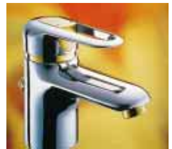
Hansaronda mit schlankerer Linienführung, neuem Bügelhebel sowie extravaganter Bicolor-Kombination

Hansaeco und Hansaeco-Top heißen die neuen Einheitssteuerpatronen des Herstellers. Ab sofort sind alle seine Einhebel-Waschtischmodelle mit dieser Technik ausgerüstet und bereits eingebaute Mischer können