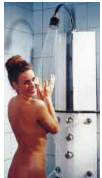
Vitala ist ein thermostatgesteuertes Duschpaneel mit Kopf-, Hand- und Seitenbrausen sowie Ablagen im aufklappbaren Oberteil