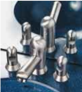
Edelstahlarmaturen ML-Design 1 von Bad & Wohnen

und Duscharmaturen aus Edelstahl präsentiert. Die Armaturen sind mit polierter oder gebürsteter Oberfläche lieferbar.