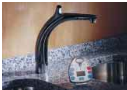
Die Küchenarmatur Magica gibt's mit Infrarotsteuerung oder Fernbedienung

Scala . Der Einhebelmischer für den Waschtisch ist so konstruiert, daß er in der Mittelstellung