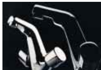
Omega, Magna und Concord vom spanischen IBP-Unternehmen Supergrif

Dreiloch-Waschtischbatterien. Als Farben stehen Chrom, Chrom/Gold und Weiß/Gold zur Verfügung.