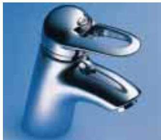
Allegroh Novo mit Markensiegel in Sterlingsilber

dient als Blickfang. Allegroh Novo gibt es in Chrom, Chrom/Gold, Edelmatt und Aranja. Das Markensiegel ist entsprechend