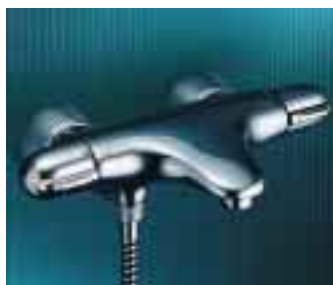
Die Thermostatlinie Grohtherm 3000 mit Aquadimmer

Im Duschbereich präsentierte das Unternehmen die neue – vorerst nur in Weiß lieferbare – Handbrause Relexa Plus Solo mit SpeedClean sowie die Brau-