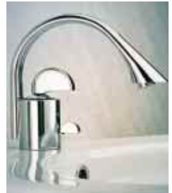
Waschtischbatterie aus der Armaturenlinie X-L

Schwungvoll setzt sich die neue Armaturenlinie X-L gegen die relative Strenge und Schlichtheit der gleichnamigen Keramikserie ab. Die italienische Designerin Gae Aulenti entwarf die an eine Flöte erinnernden Armaturen für Waschtisch, Bidet, Dusche und Wanne. In einem Zylinder mit keramischer Kartusche wird das aus der Wand kommende Wasser gemischt und in einem doppelläufigen Rohr zum kelchförmigen Auslauf geführt.