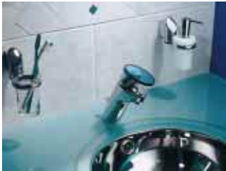
Die Taron von Grohe in der Kombination von Chrom und Glas

Eine Angebotslücke in der elektronischen Armaturenlinie der Hemeraner schließt die Waschtisch-Einlochbatterie Pulsoac-