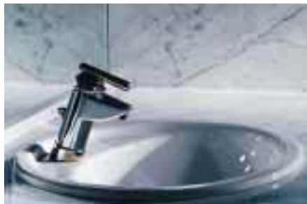
Scala von Kludi mit Mittelstellung Kalt

Beginnend mit Kludi-Mix sollen bis Ende des Jahres auch die anderen Unterputzarmaturen und die Thermostate auf das System abgestimmt sein.