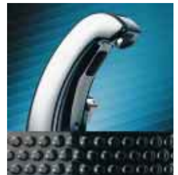
Pulsoactron, die elektronische Waschtischarmatur von Grohe mit Batteriebetrieb

Messerschwerpunkt von Grohe war die Art-Armatur Taron . Stilbildendes Element ist der Hebel in Form eines Medaillons. Von der modern-geradlinigen Serie sind Einhandmischer für Waschtisch, Bidet, Brause und Wanne sowie Thermostate für Brause und Wanne, Accessoires, die neue Wannenfüll- und Ablaufgarnitur Talentofill sowie eine WC-Betätigungsplatte lieferbar. Die Farbkombinationen sind Chrom/Glas, Chrom/Perlblau, Chrom/Perlröt oder Chrom/Matchchrom.