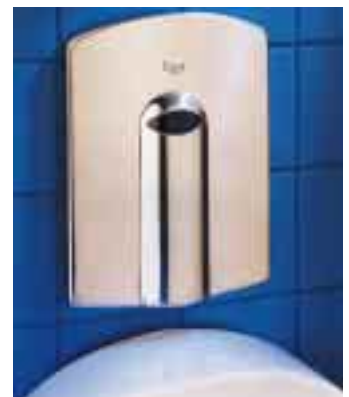
Urinalarmatur U 20 mit Netzanschluß und zusätzlicher Batterie

Außerdem bietet der Schweizer Armaturenhersteller jetzt eine Urinalarmatur für parallelen Netz- und Batteriebetrieb. Netzbetriebene Urinalarmaturen des