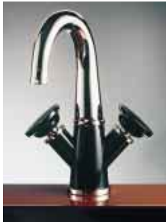
Belle de Jour als Einloch-Waschtischbatterie in Schwarz/Platin