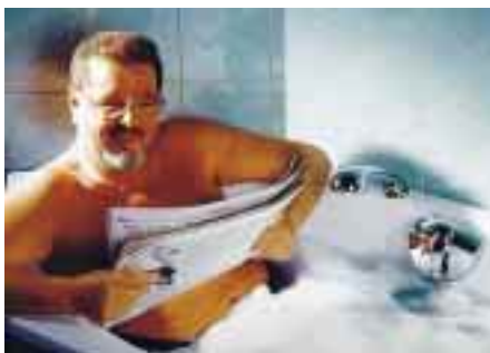
Mega-Mix ist Einhebelmischer, Wannenfüll- und Brausearmatur sowie Ab- und Überlaufgarnitur in einem

Serie von Brausen-Wandstangen und Wannengriffen mit TÜV-GS- und GGT-Zeichen haben eine ausgeklügelte Befestigungstechnik, einen vergrößerten Wandabstand und ergonomische Profile. Brausehalter und Seifenschalen des Modulsystems mit genormten Maßen sind mit Gleithülsen aufgezogen und stufenlos verstellbar.