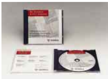
Mit der neuen CD-ROM bietet Schell ein umfassendes Informationspaket zu den Sanitär- und Heizungsprodukten

Als komfortable Anwendungshilfe dient die Zoomfunktion, mit der die Abbildungen in ihrer Größe individuell verändert werden können. Zum Erstellen von Angeboten, Bestellungen und Leistungsausügen können vorgefertigte Formulare ausgedruckt werden.