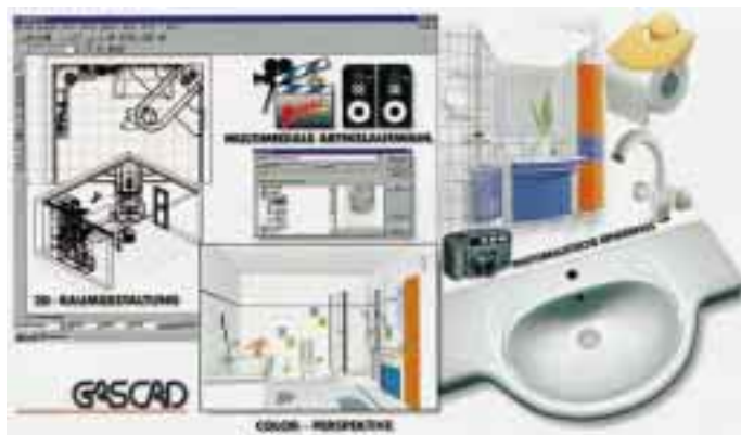
Ein völlig neues, technisch und preislich interessantes Softwarepaket zur multimedialen 3D-Raumgestaltung bietet M 3 B