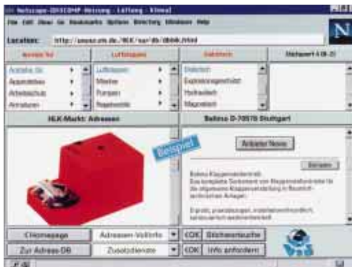
Branchenspezifische Informationen bietet das Viscomp-Center unter der Internet-Adresse http://www.vis.de

Ein Informationssystem, das speziell für die Branchen Heizung-Lüftung-Klima, Immobilien und Werbung/PR entwickelt wurde, ist unter der Internet-Adresse „ http://www.vis.de “ verfügbar. Es bietet Anwendern, aber auch anbietenden Unternehmen und Dienstleistern aus den drei Branchen ganz neue Möglichkeiten, Firmen- und Produktinformationen effizient über das Internet zu finden bzw. zur Verfügung zu stellen.