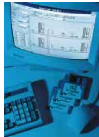
„Tecedendrit DIN 1988 for Windows 2.6“ von TC verfügt über eine vollgrafische Zeichenoberfläche

Mehrschichtverbundrohr“ sowie für das Sanitärwandsystem „Teceprofil“ in der Trinkwasserinstallation vor. Dank einer vollgrafischen Zeichenoberfläche, der eine automatische Erfassung aller technischen Daten folgt, kann auf das lästige Ausfüllen ähnlich einer Tabellenkalkulation verzichtet werden. Im „Tecedendrit“-Service inbegriffen sind vollautomatische Berechnungen (nach DIN 1988 beziehungsweise nach DVGW-Arbeitsblatt W551) sowie automatische Strangherstellung und die Erstellung von Materialauszügen.