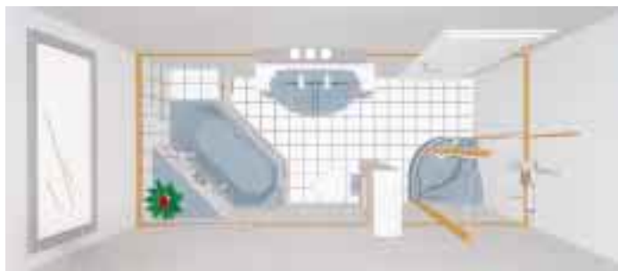
Die Version „Badplan 3D/Windows Plus“ von DVC ermöglicht die Erstellung von nahezu fotorealistischen Komplettbadplanungen in Farbe auf Basis der erstellten Perspektivdarstellungen

Das Osnabrücker Systemhaus DVC präsentierte ein „völlig neuentwickeltes Badplan 3D-Komplettsystem“ als Version für Windows bzw. Windows 95. Neben einer Vielzahl von Basisproduktbildern für die Grobplanung stehen mehr als 35 000 detailgetreue Markenproduktbilder deutscher Hersteller zur Verfü-