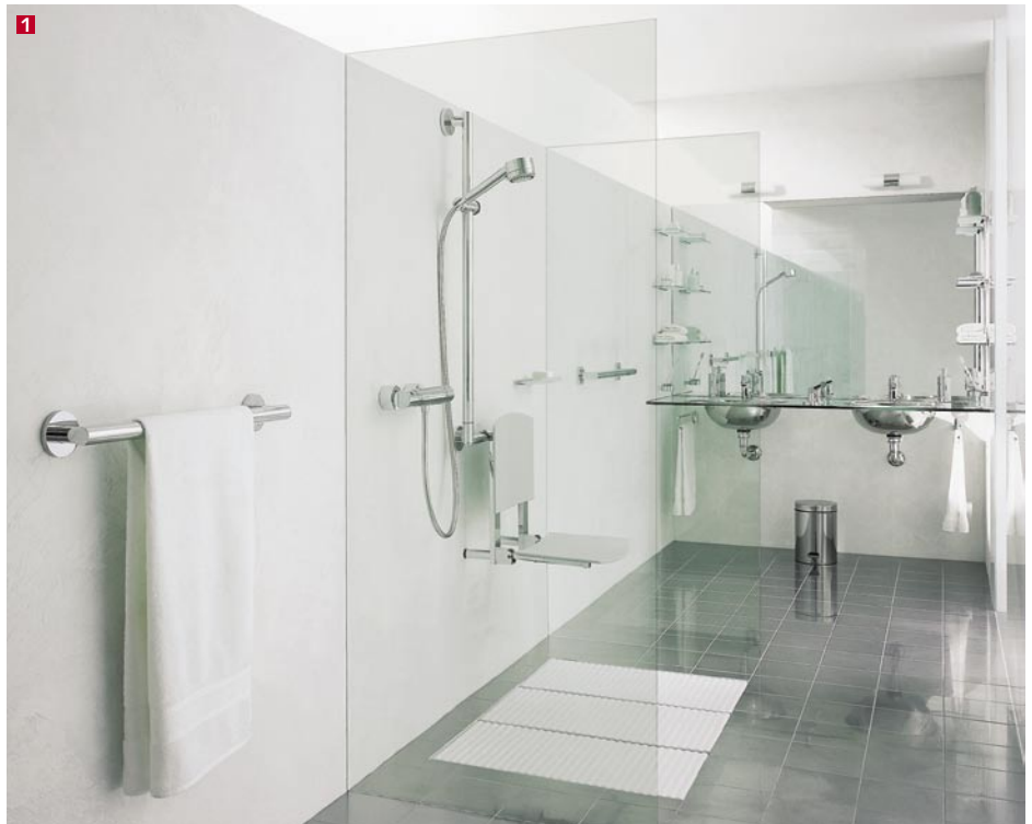
1 Schöne barrierefreie Bäder, die allen Lebenssituationen gerecht werden: Plan B Free von Keuco