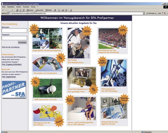
Das neue Internetforum bietet den Profi-Partnern vielfältige Einkaufsvorteile: Mehr als 1000 subventionierte Angebote stehen auf www.sfa-sanibroy.de