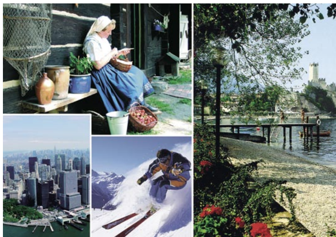
Urlaubs-Preisknaller: Für 9 Euro in den Spreewald, für 299 Euro ein schickes Hotel inkl. Halbpension und Skipass in den Berchtesgadener Alpen. Auch New York ist im Angebot