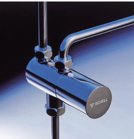
Eckventil-Thermostat von Schell

Sicherheit am Waschtisch bietet das neue Eckventil-Thermostat von Schell. Nach Firmenangaben erfüllt es die DVGW-Richtlinien, ermöglicht die thermische Desinfektion der Warmwasserinstallation und sorgt für zuverlässigen Verbrühschutz im Alltag. Die verchromte Messing-Armatur wird oberhalb des Eckventils für die Warmwasserleitung mit einem Verbindungsrohr zur Kaltwasserleitung installiert. Werkseitig auf 39 °C voreingestellt, kann sie auf andere Temperaturen abgestimmt werden. Zur Montage steht ein Verrohrungsset bereit. Es besteht aus einem Kupferanschlussrohr für Kaltwasser, einem T-Stück mit zugfesten Quetschverbindungen und einem Verbindungskupferrohr für die Warmwasserleitung. Schell, 57462 Olpe Telefon (0 27 61) 8 92-0 Telefax (0 27 61) 8 92-1 99 www.schell-armaturen.de