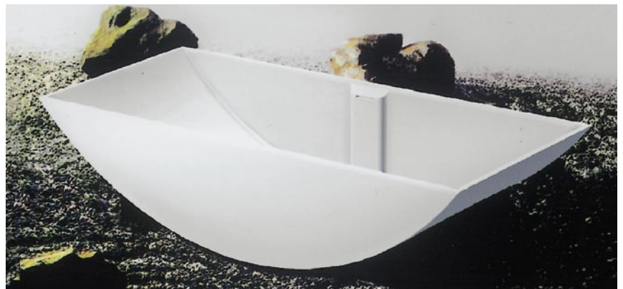
Freistehende Floatwanne Gowa 6 aus der Trendlinie ZEN von Galatea

punkt platziert. Die Befüllung erfolgt durch handelsübliche Wandarmaturen. Zum sicheren Stand der Floatwanne nicht notwendig, aber optisch ansprechend, die optional erhältlichen Fußkeile in Edelstahl oder edlen Hölzern. Galatea 01979 Lauchhammer Telefon (0 35 74) 8 53-0 Telefax (0 35 74) 8 53-111 www.galatea-bad.de