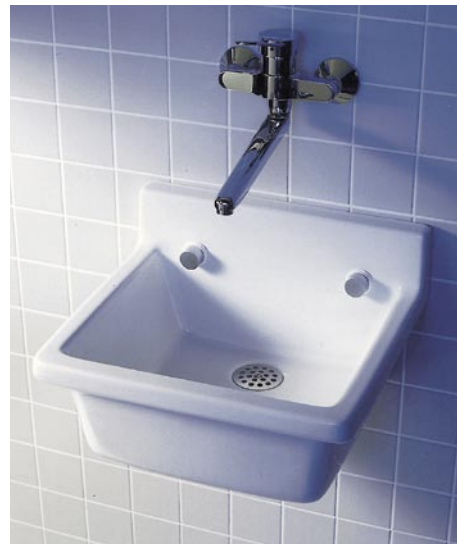
Das Ausgussbecken ergänzt das Duravit-Starck-3-Badprogramm

Philippe Starck ergänzte das Badprogramm Starck 3 von Duravit um ein Ausgussbecken aus Sanitärkeramik. Das 48 cm breite und 42,5 cm tiefe Becken verfügt über eine angeformte, 10 cm über dem Beckenrand ragende Rückwand. Auf Wunsch wird es mit Klapprost geliefert. Die Füllhöhe im Beckeninneren beträgt 16 cm. Dadurch ist das Ausgussbecken für die Reinigung unterschiedlichster Gegenstände und Einsatzbereiche geeignet. Die Keramikoberfläche ist laut Hersteller unempfindlich und reinigungsfreundlich. Als Option ist sie zudem