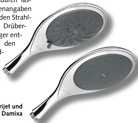
Handbrausen Trijet und Solo von Damixa

Damixa, 58640 Iserlohn Telefon (0 23 71) 94 93-0 Telefax (0 23 71) 94 93-92 www.damixa.de