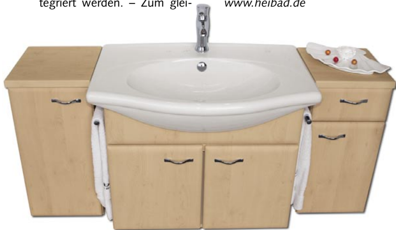
Der V & B-Porzellan-Waschtisch „Velvet“ kann seit Juni 2005 in Heibad Badmöbel integriert werden

Heibad 91180 Heideck Telefon (0 91 77) 4 84 99-0 Telefax (0 91 77) 48 57 67 www.heibad.de