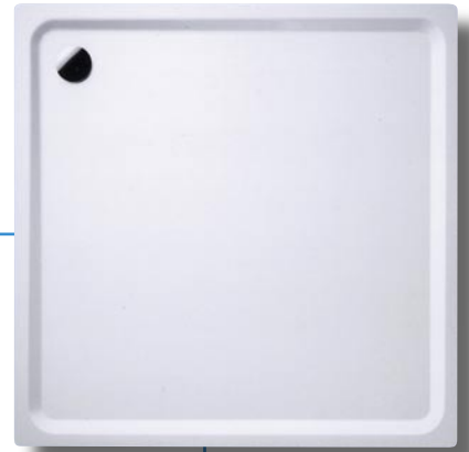
Duschwanne Superplan XXL, Modell 413 von Kaldewei

Die Kaldewei Duschwanne Superplan XXL, Modell 413, in den Abmessungen 150 x 150 cm wurde von der DIN Certco – Gesellschaft für Konformitätsbewertung in Berlin mit dem Zeichen „DIN barrierefrei“ zertifiziert. Somit kann sie nach den Anforderungen der DIN-Normen 18024-2, 18025-1 und 18025-2 eingebaut werden. Gemäß Zertifizierung ist die Duschwanne nicht nur für Bäder für sensorisch Behinderte geeignet, sondern erfüllt auch die Anforderungen für Rollstuhl befahrbare Duschbereiche. Kaldewei, 59229 Ahlen Telefon (0 23 82) 7 85-0 Telefax (0 23 82) 7 85-2 00 www.kaldewei.com