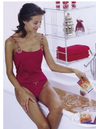
Werbegeschenk-Idee: die „Sinnensalze des Jahres“ fürs heimische Wellness-Bad

– „Oriental Dream“ mit Rosenholzöl und Zimt – „Red Passion“ mit Cassis und Palmarosaöl. Die Produkte sind in handlichen Portionsbeutel (80 g) für ca. 1,25 Euro u. a. in Drogeriemärkten erhältlich. Bad-Fachbetriebe können die ansprechend verpackten „Sinnensalze“ sehr gut als Werbegeschenk einsetzen. Merz Pharma, 60318 Frankfurt Telefon (0 69) 15 03-1 Telefax (0 69) 15 03-2 00 www.tetesept.de