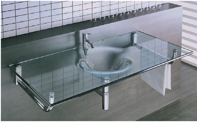
Glaswaschtisch aus 19 mm Floatglas mit geschliffenen Kanten von BadConnection