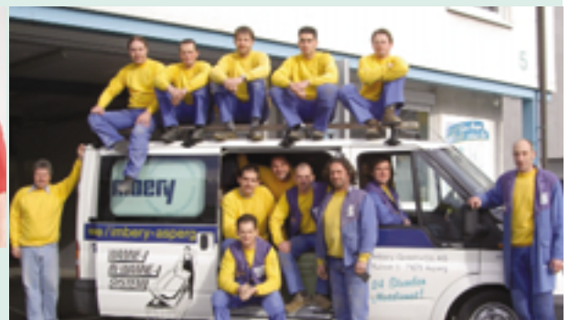
Imbery GmbH, 78628 Rottweil „Unsere Familie lebt für den Betrieb – und das sieht man.“

fallservice, die Kommunikation via E-Mail und SMS oder den Einsatz einer einheitlichen Berufskleidung. Für mich verkörpert er den modernen SHK-Handwerker. Daher habe ich ihn heimlich mit einem Foto aus unserer Weihnachtskarte angemeldet.“