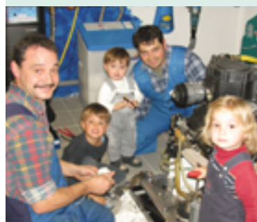
Firma Hübner, 78628 Rottweil „Mit der Begeisterung für unsere Arbeit haben wir schon die nächste Generation angesteckt.“

Eine gute Voraussetzung für eine gelungene Überraschung: Das Boco-Team besuchte den Gewinner in seinem Betrieb und gratulierte persönlich. Das Staunen in „unserem SHK-Gesicht“ wich aber schnell einer sichtlichen Vorfreude auf einen aufregen-