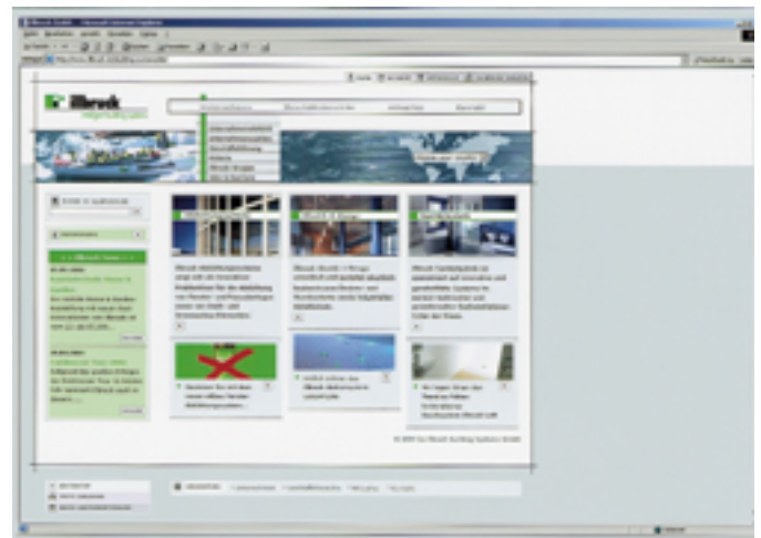
Auf der neu gestalteten Website von Illbruck finden User Unterstützung bei der Suche nach Problemlösungen

• „Das große Buch Windows XP Home“ (19,95 €, 744 Seiten, ISBN 3-8158-2531-8) ist ein kompetentes Nachschlagewerk das den Leser verständlich und nachvollziehbar in die Grundlagen und Funktionen des Microsoft-Betriebssystem