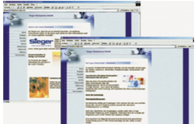
Von der Sieger-Homepage kann mit wenigen Klicks die Fördermittel-Datenbank rund um das Bauwesen erreicht werden

Modernisierern einen Weg, sich schnell und präzise über Fördermittel zu informieren. Das System, das von der Homepage des Unternehmens – www.sieger.net – aus gestartet werden kann, berücksichtigt Förderprogramme der Städte, Landkreise, Gemeinden, Energieversorger, Bundesländer und des Bundes. Ergebnisse werden nicht nur für den Bereich der Heizung ermittelt, sondern auch für Wärmeschutz, Dachsanierung, Außensanierung, Innenraumsanierung sowie für regenerative Energien und die Energieberatung.