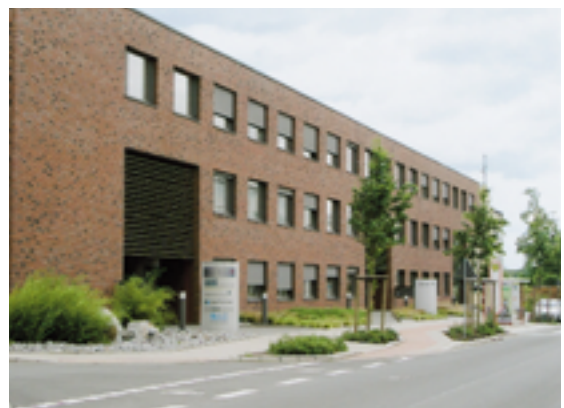
Mit dem Büro in Dortmund baut Ciat das deutsche Vertriebsnetz aus

Bundesgebiet drei neue Außendienstmitarbeiter ein. Als nächster Schritt ist die Gründung eines Vertriebsbüros in Bayern geplant. Hierfür wurden bereits zwei neue Außendienstler eingestellt.