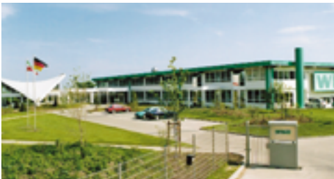
Das neue Wilo-Bildungszentrum in Oschersleben