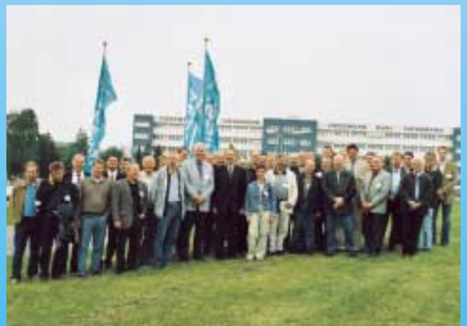
BIV-Lehrertreffen – Kältelehrer jetzt im Internet