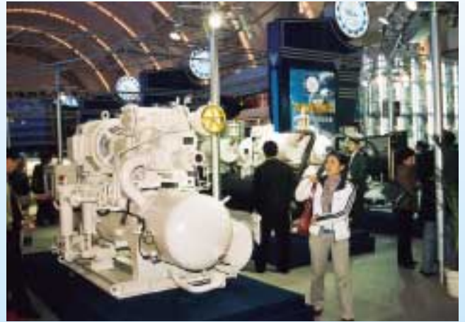
China Refrigeration 2003: Immer selbstbewußter stellt sich Chinas Kälteindustrie dar