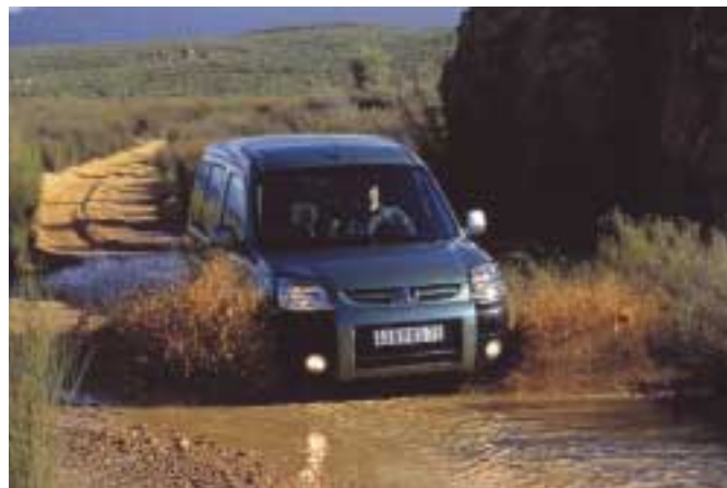
Für schwierigeres Gelände hat Peugeot eine höhergelegte Partner-Version mit Allrad, Getriebeuntersetzung und Sperren in der Mache