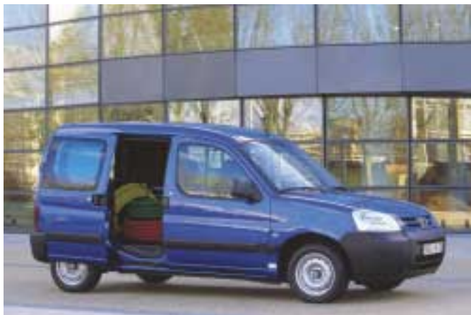
Eine dreiviertel Tonne und 3 m 3 wuchtet der kleine Flitzer durch den Stadtverkehr