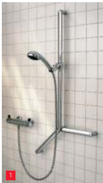
1 Medi-Care-Duschlösung von Kludi

Mit ihrem Programm Medi-Care präsentieren die Saarländer jetzt eine private sowie eine professionelle Variante für Krankenhäuser, Pflegeeinrichtungen und Generationenbäder. Die Armaturen verfügen über eine Heißwasserbegrenzung bei 45 °C. Dennoch ist nach Herstellerangaben eine thermische Desinfektion zum Schutz vor Legionellen möglich, indem mittels einer versteckt angebrachten Begrenzungsschraube die Temperatursperre freigegeben und