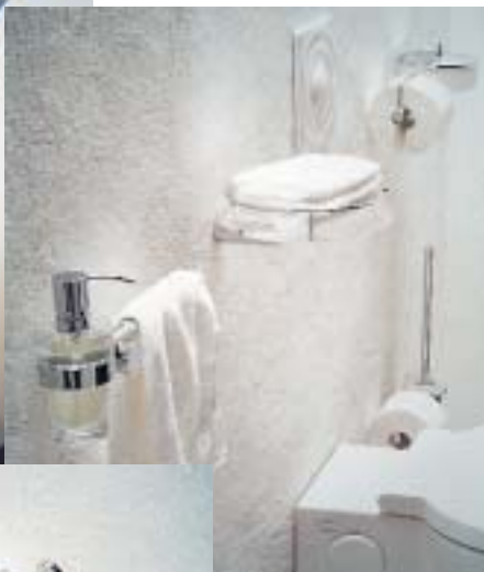
Accessoireserien Logo (l.), Balance und Tempora (u.) von Emco