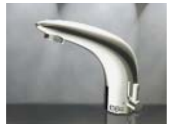
Waschtischarmatur Saniline-Dolphin von Mepa

ist einstellbar. Außerdem stellte das Unternehmen seine unsichtbare, hinter dem Urinal montierbare Urinal-Spülautomatik Sanicontrol K3 mit Anti-Ver-