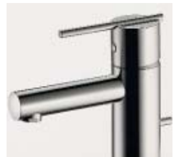
Einhebelmischer Spin von Zucchetti

griffarmaturen mit Kreuz- bzw. T-förmigen Griffen. Das speziell für den Objektbereich entwickelte System Contract ist sowohl mit Einhebel- als auch mit Zweigriffbedienung erhältlich. Alle haben eine speziell ent-