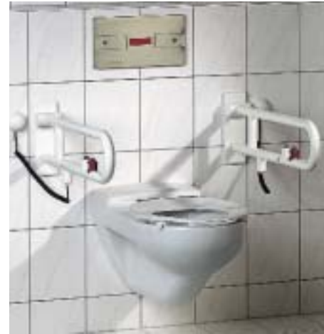
IR-WC-Steuerung Ecoflush von Georg Fischer Fränkische

Unter der Bezeichnung Ecoflush stellte das Unternehmen jetzt eine neue, vom Unternehmensbereich Schwab entwickelte WC-Steuerung vor. Sie kann entsprechend der DIN 18024 beidseitig mit Hand oder Arm betätigt werden, ohne daß der Benutzer die Sitzposition verän-