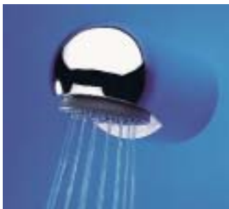
Ganzmetall-Duschkopf Aquajet-Comfort von Aqua

treiber voreingestellten Laufzeit. Eine integrierte Zwischenstopfunktion ermöglicht es dem Nutzer, den Wasserfluß durch nochmaliges Berühren der Sensorik zu unterbrechen. Bei Kaltwasserausfall wird der Wasserfluß sofort gestoppt. Eine in der Armatur integrierte Bypass-Magnetventilkartusche ermöglicht das regelmäßige Spülen des gesamten Rohrleitungssystems gemäß DVGW-Empfehlung mit mindestens 70 °C heißem Wasser außerhalb der Betriebszeiten. Zum Lieferumfang des High-Tech-Teils gehört ein kompakter Wandeinbau-Funktionsblock. Außerdem stellten die Ludwigsfelder eine neue Duschkopfgeneration namens Aquajet-Comfort vor, die durch einen speziellen Strahlbildner mit Antikalksystem die in Hinblick auf die Legionärskrankheit bedenkliche Aerosolbildung auf ein Mindestmaß reduzieren soll.