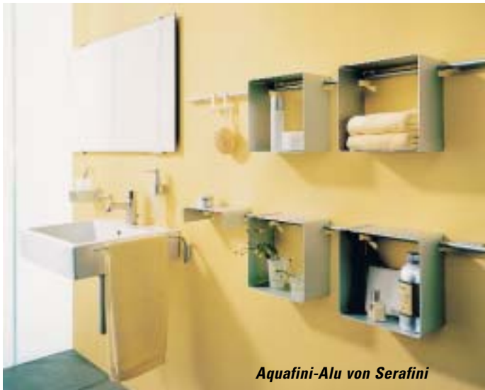
Aquafini-Alu von Serafini