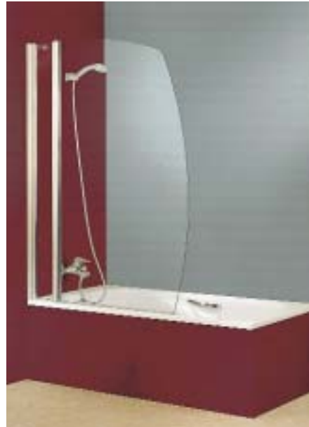
Combinett 750 B von Hüppe

Nachkaufgarantie gibt es in den Standardfarben Weiß und Silber-Matt ab 550 Euro plus MwSt.