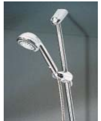
CeraWell 200 mit Multifunktionsbrausestange

CeraWell heißt die neue Brausenfamilie der Bonner. Die Basisvariante 100 ist eine Einfunktionshandbrause mit halbkugelförmigen Kopf, gewölbtem Griff sowie auf Wunsch mit 60 cm