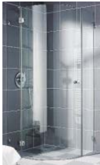
Echtglas-Duschabtrennung Xena von Kermi

Speziell die Anforderungen der 40-Plus-Generation soll die Ganzglas-Duschkabine Xena mit ihrer extrabreiten Tür und innen bündig im Glas versenkten Beschlägen erfüllen. Sie läßt sich bodengleich oder auf sehr