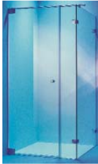
Elidur-Echtglasdusche mit Lite-Beschlägen

Kermi 94447 Plattling Telefon (0 99 31) 5 01 17 26 Telefax (0 99 31) 50 16 56 www.kermi.de