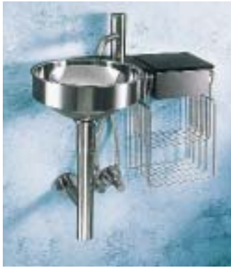
Waschtisch Romino von HighTech

dul eingepaßt. Ohne die polierte Granit-Ablagefläche mißt das Teil 306 mm in der Breite und 296 mm in der Tiefe. Mit Ablage ist der Waschtisch 481 mm breit. Er kann nach Firmenangaben sowohl an einer geraden Wand wie auch in Ecken eingebaut werden. Als passende Armatur empfiehlt HighTech den außer in Chrom, Messing und 18 Farbtönen auch in Edelstahl erhältlichen Vola-Einhandmischer.