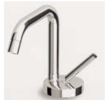
Modular aufgebauter Einhebelmischer Isy Stick im Matteo-Thun-Design

Der bekannte italienische Hersteller kommt mit zwei neuen Design-Armaturen auf den deutschen Markt. Die vier Versionen umfassende Modellreihe Isy wurde von Matteo Thun entworfen. Das Modell Stick ist ein exklusives Einhebelmischersystem, Arc und Line sind Zwei-