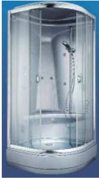
Entrada 2000 in Silbermetallic-Ausführung

Die Badewannenabtrennung Combinett 750 B wird wahlweise mit oder ohne festes Wandsegment und auch in Anti-Plaque-Ausstattung geliefert. Den Spritzschutz mit zehn Jahren