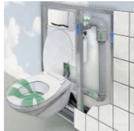
VariVit Air-WC mit integrierter Geruchsabsaugung

statteten Sanicontrol-Spülkasten dafür sorgen, daß Gerüche bereits am Entstehungsort chemikalienfrei beseitigt werden. Ein Radiallüfter (24 Volt/5,5 Watt) saugt die Luft automatisch über das Spülrohr aus dem WC und leitet sie direkt in das Abflußrohr oder in eine separate Lüftungsleitung. Ausgelöst wird die Automatik mittels infrarotgesteuerter Benutzererfassung über ein in der Betätigungsplatte des Spülkastens eingebautes Elektronikmodul. Die Nachlaufzeit