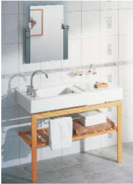
Waschplatz 40-West-40th von Ideal Standard

Wasserdimmer und mehrstufigem Brausevergnügen sind die CeraWell 300 bzw. 300 S.