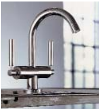
Zweigriff-Armatur Alia von SAM

Das Design der Armaturen- und Badausstattungsreihe Alia basiert auf ineinandergreifenden, zylindrischen Körpern. Vom Einhebelmischer über die Zweigriff- bis zur Dreilocharmatur für die Stand- und die Wand-