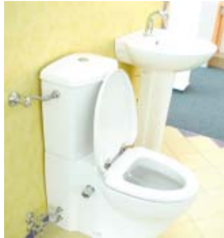
Mechanisch bzw. hydraulisch betriebenes Dusch-WC von MultiClean

Linido 42119 Wuppertal Telefon (02 02) 43 68 31 Telefax (02 02) 43 68 31 www.linido.net