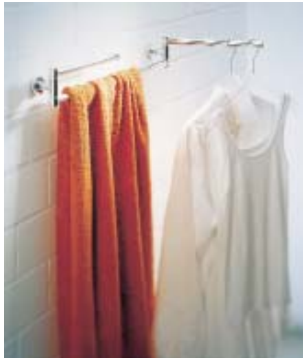
Handtuchhalter „Trockenreck“ aus der Eposa-Serie

Mit gleich drei neuen Accessoireserien starteten die Lingener dieses Jahr in den Frühsommer. Während die 20teilige Serie Logo als Einstieg in die Klasse der Markenaccessoires im unteren