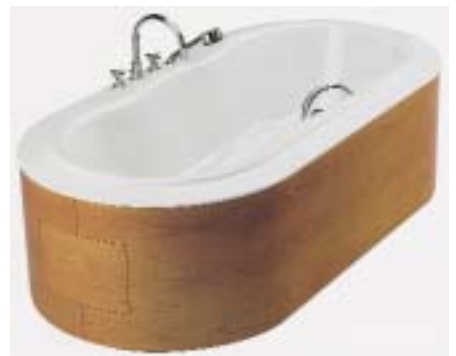
Bamberger-Badewanne Novola-Oval mit neuer Wannerverkleidung

mit bis zu 20 mm Einstellbereich und verdeckten Beschlägen, sind zwei Rundstäbe in Chrom-Oberfläche, an denen die rahmenlosen Glastüren aus 8 mm starkem Sicherheitsglas befestigt sind.