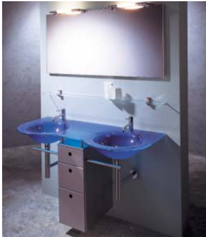
Komplett-Set Twin-Konzept-2001 von BadConnection

BadConnection 79379 Müllheim Telefon (0 76 31) 7 47 86 90 Telefax (0 76 31) 74 78 69 69 www.badconnection.de