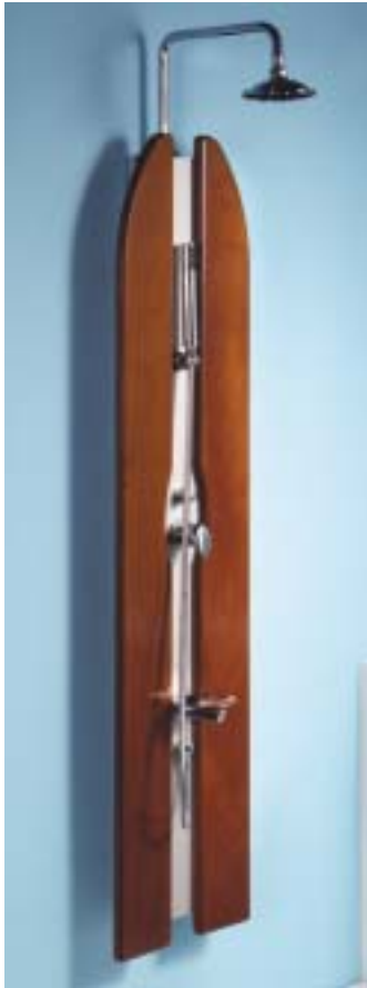
Duschsäule Mara von Banacril