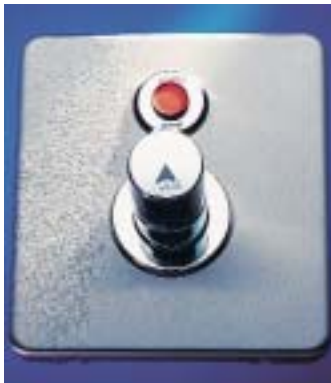
Zeitgesteuerte Aquatimer-Elektronik-Duscharmatur mit Thermostat

Bei der neuen, zeitgesteuerten Elektronik-Thermostat-Duscharmatur Aquatimer mit Start/Stop-Funktion erfolgt die Auslösung des Wasserflusses durch eine Berührung der Tastsensorik und endet nach einer vom Be-