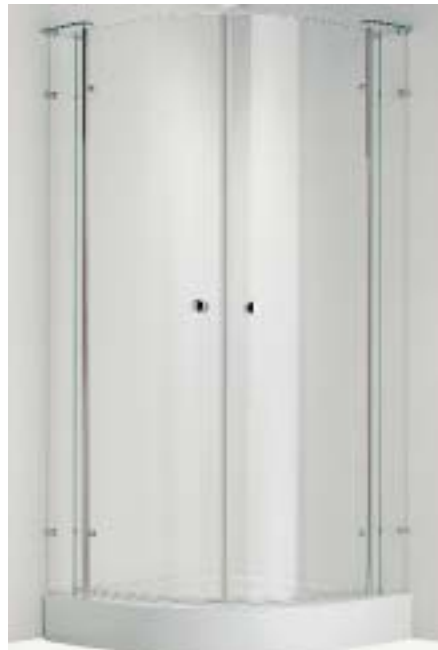
Echtglas-Duschabtrennung von Bamberger

Die im vergangenen Jahr vorgestellte Wannenfamilie Novola mit ihrem charakteristischen Dreifachschwung wurde um eine Kombiset-Version ergänzt. Wie alle Badewannen der Serie wurde sie von der Solinger Designwerkstatt KK kreiert, hat ein ergonomisch geformtes Rücken-