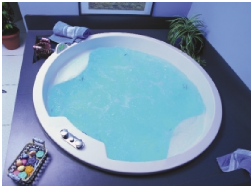
Zweites Standbein: Mit Dampfduschen erhalten auch die Whirlpools, Acrylwannen und Fertigduschen der Grandform-Reihe Verstärkung

Aber nicht nur beim Service, sondern auch im Produktbereich will der Hersteller im Jubiläumsjahr mit Neuigkeiten aufwarten. So wurde z. B. im Januar mit der Kleinsthebe-