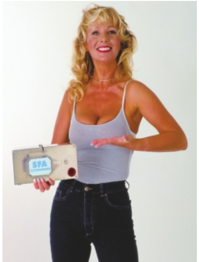
Sollen für Aufmerksamkeit am deutschen Fachmarkt sorgen: Das Sanigirl aus der Firmenzeitschrift mit der neuen Kondensat-Kleinthebeanlage

Nur wenige Markennamen wie Tesa oder Tempo konnten sich bisher als Synonym für den Gattungsbegriff durchsetzen. Innerhalb der SHK-Branche ist dies Sanibroy bei den Kleinhebeanlagen weitgehend gelungen. Im 25. Jahr seines Bestehens am deutschen Markt setzt das Unternehmen vor allem auf Vorverkauf, Kundenbindung und Produktweiterentwicklung.