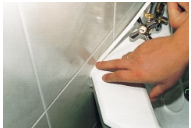
Das Dichtungsprofil paßt sich auch bei Rundungen und engen Rädern an Wand und Fliesenstrukturen an