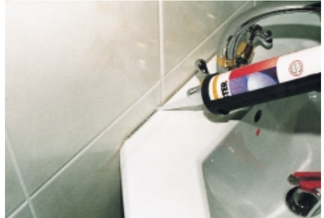
Mit transparentem Silikon wird der Zwischenraum ausgespritzt, danach das Dichtungsprofil leicht hineingedrückt

Mit dieser neuen Entwicklung und dem Einstieg ins Produktionsgeschäft, hat das Rottenburger Unternehmen auf die Belange des SHK-Marktes reagiert. Dem Handwerker wird dabei eine Produktpalette angeboten, die es ihm ermöglicht, vielfältige Situationen von Silikonarbeiten im Alt- und Neubaubereich selbst zu meistern. NS