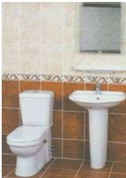
Stromloses Dusch-WC von MultiClean

MultiClean 12437 Berlin Telefon (0 30) 53 21 52 56 Telefax (0 30) 53 21 52 58 www.multiclean-online.com