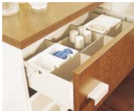
Schubkastensystem in Setzkastenbauweise von Duravit