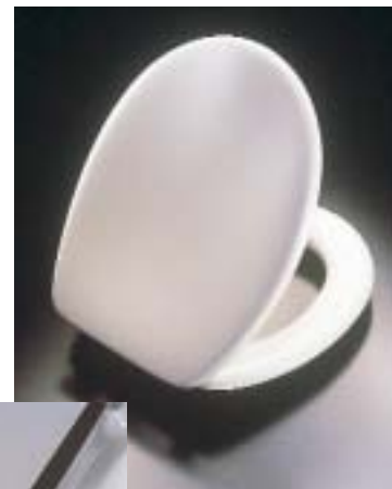
Neues Modell des WC-Sitzes Tivoli von Pressalit

Pressalit 25451 Quickborn Telefon (0 41 06) 7 80 93 Telefax (0 41 06) 7 42 46 www.pressalit.com