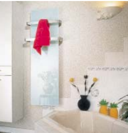
Radiator Solaris von Fondis