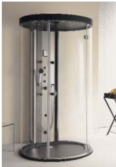
Dampfdusche Progress-Forte von Koralle als Wandversion