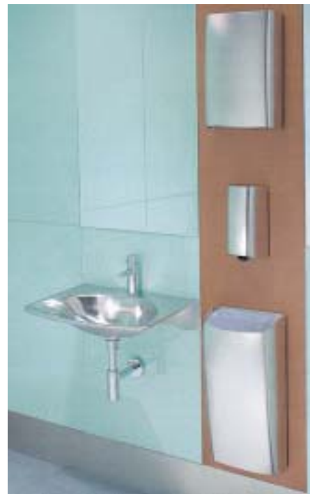
Sanitärsystem Millinox von Kuhfuss

Kuhfuss 32011 Herford Telefon (0 52 21) 6 83 90 Telefax (0 52 21) 68 39 35 www.kuhfuss-sanitaer.de