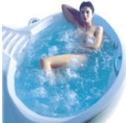
Whirlpool Grandform mit Biomagnetic

jeder Grandform-Wannenform kombiniert werden. Das elektromagnetische Feld zirkuliert durch ein zweiadriges Kabel, welches unter der Wanne ergonomisch auf den