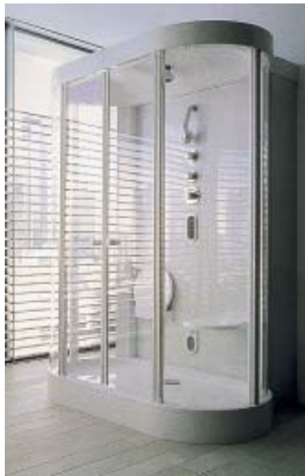
Dampfbad Foster 1600 von Hoesch

Die Kooperation von Hoesch und Duravit trug jetzt neue Früchte: Speziell für private Dampfbäder bis zu zwei Personen konzipierte Bathroom-Foster-Kabinen. Acht in die Profile integrierte Seitenbrausen ermöglichen auch die Nutzung als Dusche. Zur Auswahl stehen eine ovale sowie eine Version mit Wandanschluß. Beide sind mit