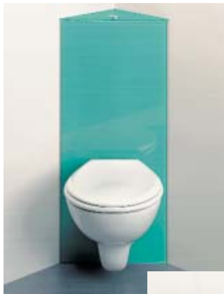
Missel-Kompaktspülrohr im Glasdesign Blau

Das seit Anfang 1998 auf dem Markt befindliche Kompaktspülrohr der Schwaben ist jetzt auch mit unveränderten Abmessungen in der Dekorvariante Glas erhältlich. Die bisher verwendete Beplankung aus Gipskarton und Fliesen wurde hierbei le-