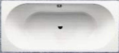
Kaldewei-Badewanne Classic in der Starylan-Ausführung