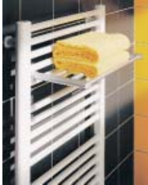
Handtuchablage von Kermi