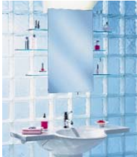
Spiegelboard Slideline von Schneider

xiertem Aluminium mit integrierter Steckdose und Schalter. Lieferbar ist das Teil mit oder ohne Beleuchtung. Vorerst allerdings nicht in Halogen-Ausführung. Denn die ist erst in Vorbereitung.