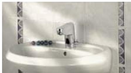
Optoelektronische Armatur Sensora von Kludi

Besonders für private Gäste-WCs sind die opto-elektronisch gesteuerten Sensor-Ar-maturen der Mendener gedacht. Die Waschtischarmatur ist in vier Ausführungen erhältlich: Mit Temperaturwählgriff oder