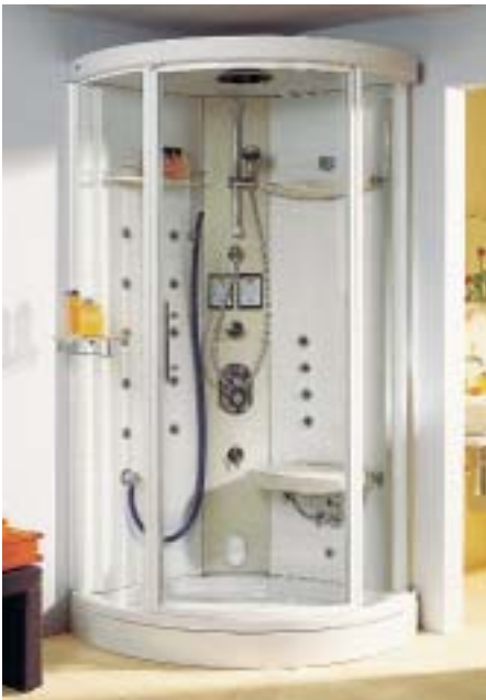
Fitness- und Wellness- Dusche von Keramag

Die Fitness- und Wellness-Dusche der Ratinger besteht aus einer Eckrundwanne mit einer Schenkellänge von 96 cm, einer Duschatrennung, einer Steuerungstechnik für Duschen und Dampfen sowie einem Klappsitz. Zur Ausstattung gehören neben der Sternenhimmel-Beleuchtung eine Grohe-Handbrause mit vier Strahlarten, zehntegrierte Filljet- und acht Rolljet-Düsen,