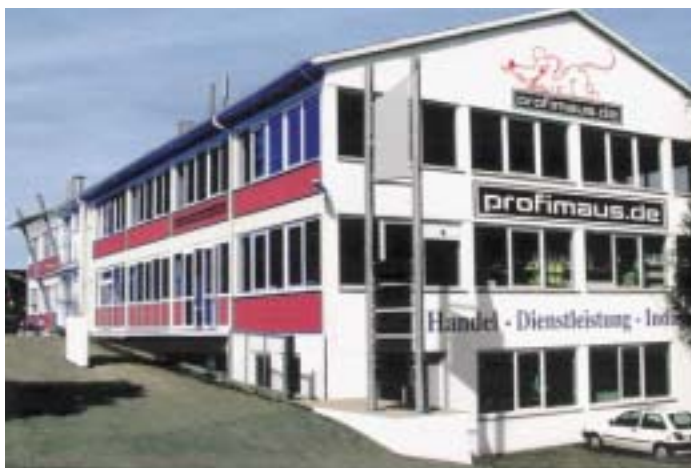
Als Online-Partner für das Heizungs- und Sanitärhandwerk versteht sich der Versand-Großhändler Profimaus.de

fon gibt. Insgesamt hat der Großhändler nach eigenen Angaben Zugriff auf mehr als 25 000 Artikel. Kunden, die bis 15 Uhr bestellen, hätten die Ware in der Regel am nächsten Vormittag im Haus oder auf der Baustelle, hieß es in einer Pressemitteilung. Ein Telefon, ein Fax oder ein PC mit