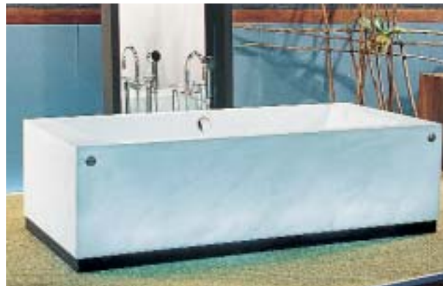
Die Badewanne von Du Pont besteht aus lichtdurchlässigem Corian

Auf der diesjährigen ISH wollte Du Pont in erster Linie die vielfältigen Gestaltungsmöglichkeiten des Materials Corian und Zodiaq zeigen. Gerade im Bereich der Sanitär-Produkte ergeben sich vielfältige Anwendungsbeispiele von der funktionalen Naßzelle, sinnlichen Wellness-Räumen bis hin zu Familienbädern und öffentlichen Sanitäranlagen. Corian kann nach Angaben des Herstellers praktisch jede Form annehmen, so daß ein Designer auch eigenwillige Visionen realisieren kann, wie zum Beispiel frei geformte Waschbecken, geschwungene Linien bei der Wannerverkleidung oder Einlegearbeiten für den Waschtisch. Auch die Lichtdurchlässigkeit