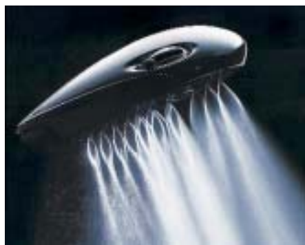
Duscha Handy von Hüppe soll besonders gut in der Hand liegen

Ebenso handlich wie die gleichnamigen Mobiltelefone, soll die neue Serie Duscha Handy von Hüppe mit traditionellen Vorstellungen von Handbrausendesign aufräumen. Griff und Brausekopf aus einem Stück schafft eine Optik, als käme der Wasserstrahl direkt aus der Hand. Auch die Strahlbildkombination der Hüppe „Handys“ soll eine Abkehr vom Üblichen bringen: Neben