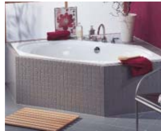
Die neue Sechseck-Badewanne ergänzt die Quaryl-Badewannen-Familie Cetus

Im Produktbereich kann die neue Quaryl-Duschwannenfamilie Futurion durch Vielfalt (zehn Modelle, vier Formen) überzeugen.