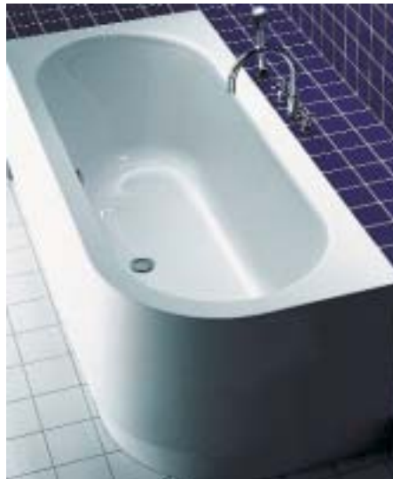
Die erfolgreiche Produktfamilie Happy D wurde um ein Wannenmodell für die Ecke in Rechts- und Linksversion erweitert

Die beiden neuen Ergo-Whirlwannen Santa Catarina und Santa Lucia beschreiben in ihrer Außenform ein Quadrat (150 × 150 cm) und einen Kreis (Durchmesser 180 cm). Die beiden Wannen aus Acryl in Sanitär-