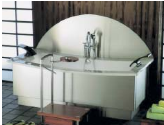
Die asiatische Linie Zen von Galatea soll für innere Ausgeglichenheit sorgen

Das brandenburgische Traditionsunternehmen Lauchhammer Kunststoffwerk präsentierte auf der ISH einen neuen Namen und eine neue Unternehmensstrategie. Die Umbenennung des Unternehmens in Galatea orientierte sich an Produktwelten, die in Zusammenarbeit mit externen Beratern entwickelt wurden. Ausgehend von einer Mehr-Marken-Politik, die vornehmlich auf die Bedürfnisse des Fach- bzw. Fachgroßhandels ausgerichtet sein soll, steht für das Unternehmen der aktuelle Zeitgeist und trendige Geschmack neuer Zielgruppen im Vordergrund. So firmieren unter der Dachmarke Galatea die drei Marken Zen, Mediterraneo und Lauchhammer. Galatea war laut griechischer Mythologie eine sizilianische Meernymphe.