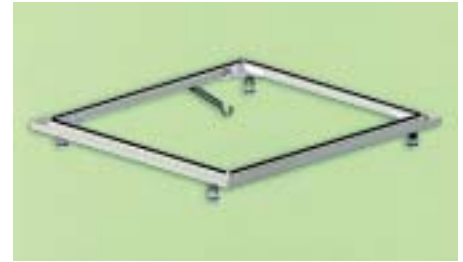
Der Einbau-System-Rahmen ERS soll den schwellenfreien Einbau der flachen Duschwannen Superplan und Duschplan erleichtern

modellen der seit Januar erhältlichen Vaio-Wannenfamilie (siehe auch SBZ 4/2001) angeboten. Im Rahmen des Mega-Trends Wellness möchte Kaldewei seine Whirl-Kompetenz mit der Entwicklung von vier neuen Systemen weiter ausbauen. Die neue Whirlpool-Produktlinie reicht von den Luft- bzw. Wassersystemen Vivo-Vita und Vivo-Aqua über ein kombiniertes Luft/Wasser-System Vivo-Vario bis hin zum luxuriösen Vivo-Vario-Plus. Das Turbo-System mit seinen