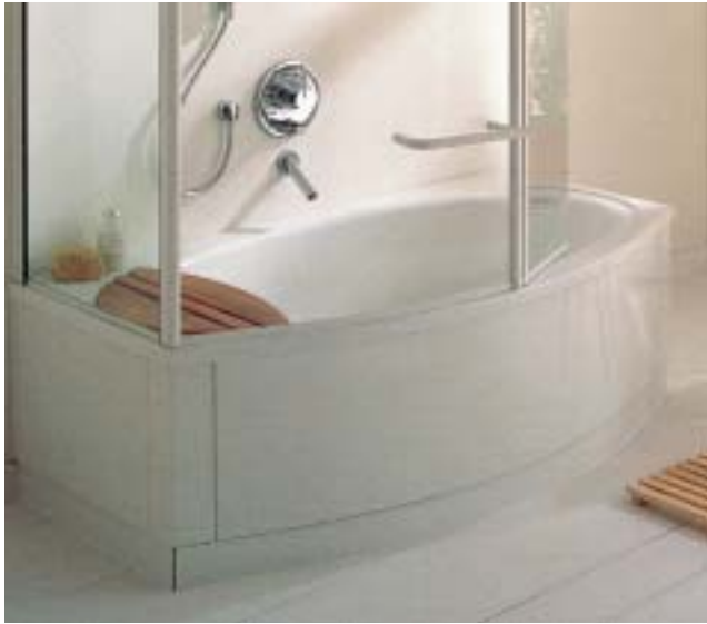
BetteHome soll Poolbaden und Duschvergnügen auf einen Nenner bringen

wird die BetteHome mit den Abmessungen 180 x 75 cm als Nischen- und Eckvariante mit angeformter Stahl/Emailschürze ange-