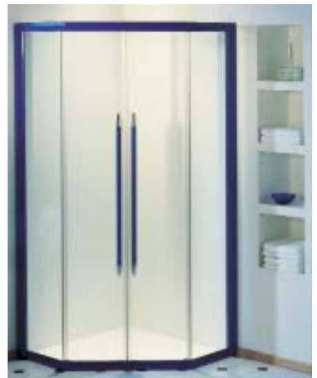
Gradlinigkeit und gespannte Flächen bestimmen die Optik von Lifeline

Als Allrounder im Badezimmer will sich die Duschkabine Lifeline von Artweger präsentieren. Harmonisches Design und eine zeit- und kostensparende Montage sollen die Verkaufsargumente darstellen. Geradlinigkeit und gespannte Flächen bestimmen die Optik von Lifeline. Durch gebrochene Kanten soll das Profil der Duschtrennwand elegant und leicht erscheinen. Der Griff der Lifeline wirkt durch ein minimalistisches Design und sorgt für Transparenz. Die innengeführte Tür beansprucht nach außen keinen Raum und soll das Auslaufen von Tropfwasser vermeiden. Direkt vor Ort kann bei der Montage entschieden werden, ob sich die Falttüre nach links oder rechts öffnen soll. Hierdurch vereinfacht sich der Bestellvorgang.