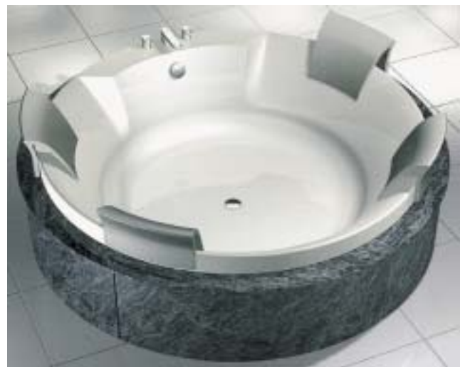
Die Luxuswanne Aviva gibt es in verschiedenen Varianten

Genauso wie die Poolssysteme werden jetzt auch die Programme der neuen Dampfkabine Vapora Comfort über eine intelligente Steuerung geregelt. Durch Eingabe der persönlichen Körperdaten in die Fernbedienung werden die Dampf- und Massagepro-