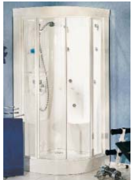
Die Tempofit von Rothalux mit Dusch-, Dampf- und Massagefunktion

Mit einer pflegeleichten Beschlaglösung bei der neuen Glasduschenserie Gala will Rothalux die Aufmerksamkeit des Marktes gewinnen. Die Beschläge der Dusche sind innen versenkt und bündig mit der Glasoberfläche, so daß man sie leicht reinigen kann. Bis zu 24 mm Verstellmöglichkeit stehen für Festsegment und Türflügel zur Verfügung. Besonders bei Altbauten soll es hilfreich sein, daß der Winkel von der Wand zum Festsegment stufenlos einstellbar ist. Die rahmenlose Gala besteht aus Einscheibensicherheitsglas. Die 190 cm hohen Du-