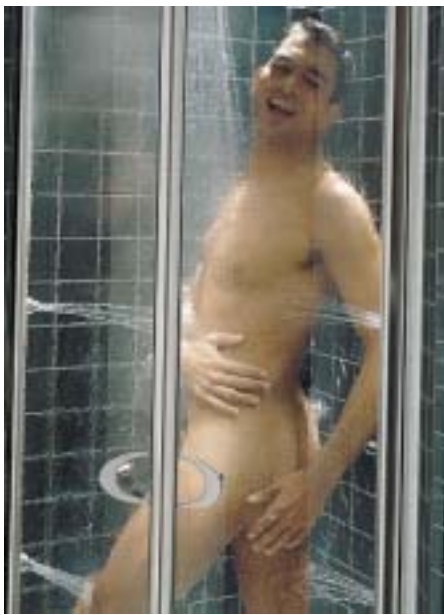
Das Ausstattungskonzept Fantastic beinhaltet eine Duschwand mit integrierter Wasserführung in den Rahmenprofilen

diesen ganzheitlichen Gestaltungsansatz mit Leben zu füllen, umfaßt das modulare System freistehende und wandgebundene Wannens mit und ohne Whirlpool-Ausrüstung, Duschwannen, Echtglas-Duschwän-