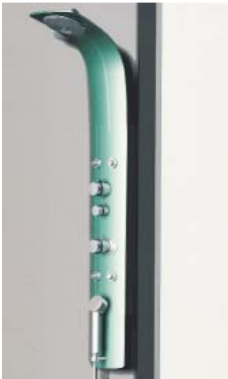
Die Duschsäule Aquadrive überrascht durch ein fast puristisches Design

Die zur ISH 2001 vorgestellte Duschsäule Aquadrive zeigt sich mit gebogener, 10 mm starken Floatglas-Fläche mit teilmattem Dekordruck. Die Wand- oder Eckversion ist mit vier Seitenbrausen, je einer Kopf- und Handbrause sowie einem Thermostatventil ausgestattet.