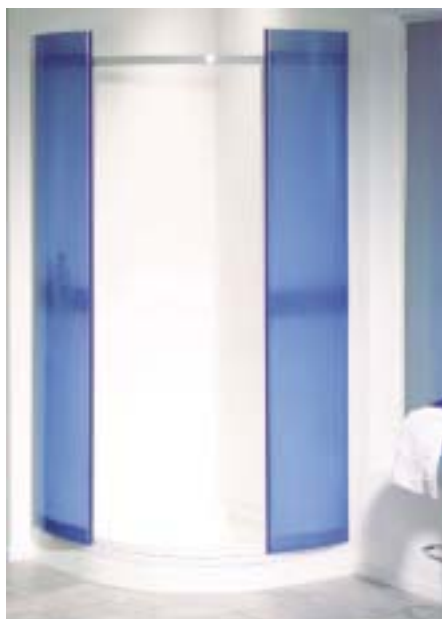
Die geschwungenen Schiebetüren aus gepreßtem Glas scheinen bei Inline zu schweben

Zur ISH präsentierte Bamberger eine neue Badewannenfamilie aus Stahl-Email im mittleren Preissegment. Augenfälliges Design-Merkmal mit hohem Wiedererkennungseffekt bei Novola soll der Dreifachschwung der Wanneninneform sein. Die großzügigen Radien sollen ein bequemes Ablegen der Arme auf dem Wannensrand ermöglichen. Auch die Rückenpartien sind ergonomisch geformt und mit unterschied-