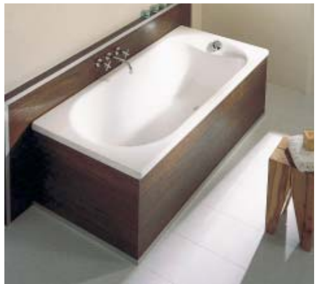
Die Wannenfamilie BettePur präsentiert sich in klassisch-klarer Form

von dem Berliner Designer Jochen Schmid dem entworfen. Die BetteHome kombiniert Wannenvergnügen mit Duschspaß, da auf Wunsch die Wanne mit einer Echtglas-Duschabtrennung ausgestattet werden kann. Die Schwenktür mit integriertem Abdichtungsprofil läßt sich um 270° nach innen und nach außen bewegen und soll somit einen problemlosen Ein- und Ausstieg sowie Reinigungsfreundlichkeit gewährleisten. Die Konstruktion der Duschabtrennung läßt unterschiedliche Einbausituationen – frei vor der Wand oder als Ecklösung – zu. So