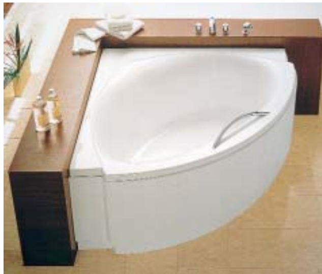
Die Eckwanne Swing neu von Ideal Standard ist in drei Größen erhältlich