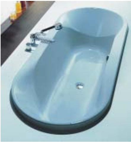
Die Wannenfamilie Spectra von Hoesch umfaßt vier verschiedene Größenvarianten

wird in unterschiedlichen Abmessungen umgesetzt. Das Modell ist in den Abmessungen 170 × 80 cm, 180 × 80 cm, 180 × 90 cm und 190 × 80 cm erhältlich. Die Spectra-Wannen bieten jeweils zwei symmetrische Sitzpositionen und einen Mittelablauf. Auf beiden Seiten unterstützt eine ausgeformte ergonomische Stütze den Lendenwirbelbereich.