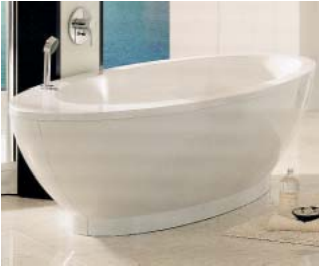
Die Badewanne Fantastic von Duscholux ist optional aus Lucite Care mit antibakteriellem Schutz erhältlich

spiel auch Anwendung in Zahnpasta, Mundwasser, Deodorant und antibakteriellen Seifen. Anders als bei Produkten, deren antibakterieller Zusatz auf die Oberfläche aufgetragen wird, ist Microban in das Acryl eingearbeitet und fest mit der Acryl-Struktur verbunden. Dadurch kann der antibakterielle Schutz nicht abgewaschen oder abgetragen werden und soll für die gesamte Lebensdauer der Bade- und Duschwanne wirken. Eine Wanne aus Lucite Care ersetzt nach Angaben des Herstellers jedoch auf keinen Fall die regelmäßige Reinigung des Badezimmers. Eine normale Reinigung soll Bakterien auf unbehandelten Oberflächen reduzieren und sie sogar vorübergehend davon befreien. Diese Wirkung soll jedoch nur kurzfristig sein und kann ihre rasche Neubildung nicht verhindern. Die Wanne aus Lucite Care soll also zwischen dem regelmäßigen Reinigen hygienisch sauber bleiben. Eine ganze Reihe von Wannenhersteller, wie etwa Duscholux, Hoesch, Koralle etc., stellten auf der ISH erste Wannen mit dem antibakteriellen Zusatz vor.