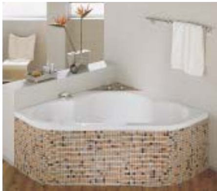
Die angedeuteten Kreisformen bestimmen die Innenform der Eckwanne BetteSkyline

wird die BetteHome mit den Abmessungen 180 x 75 cm als Nischen- und Eckvariante mit angeformter Stahl/Emailschürze ange-