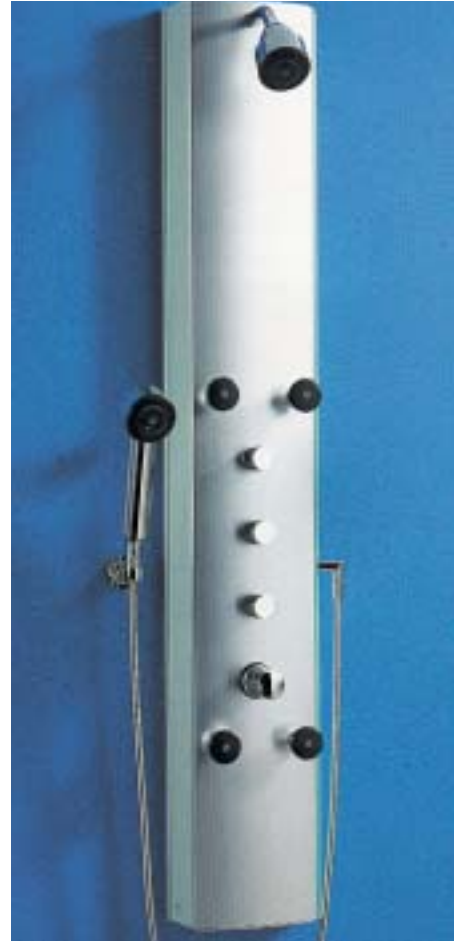
Der AquaShower kann mit drei Modelllinien von Dornbracht ausgestattet werden

Die Ausstattung des Duschpaneels AquaShower ist vielfältig angelegt: Die komplett vormontierte Installationseinheit verfügt über drei Ventile, mit denen jeweils die Kopfbrause, die vier schwenkbaren Seitenbrausen und die Handbrause aktiviert werden. Der Einbau ist - auch nachträglich - einfach zu bewerkstelligen und in allen Eck- und Wandversionen der Duschtrennungen von Koralle und anderen Herstellern möglich. Das Koralle-Paneel ist in allen aktuellen Sanitärfarben lieferbar.