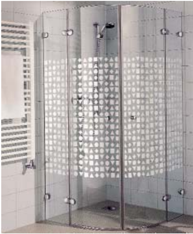
Echtglas mit Sichtschutz: Duschkabine Aska von Kermi mit Geometrie-Dekor

halten bleiben und der Raum wirkt weiterhin weiträumig und hell. Zur Auswahl stehen die beiden Dekorarten Geometrie und Stone. Die Duschkabine Siesta ist gegen einen Aufpreis mit verchromten Profilen erhältlich. Kermi will hiermit dem anhaltenden Oberflächen-Trend Rechnung tragen.