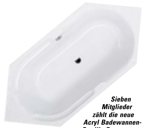
Sieben Mitglieder zählt die neue Acryl-Badewannen-Familie Parana

Rechteck-Modell deckt mit den Größen 190 × 90 cm, 180 × 80 cm, 170 × 75 cm und 160 × 70 cm viele Wünsche ab. Die Sechseck-Variante gibt es in den Außenmaßen 190 × 80 cm. Das Wannenninnere entspricht dem der Rechteck-Wanne. Die ovale Variante der Parana-Familie ist 180 × 80 cm groß. Die Eck-Badewanne ist mit 135 × 135