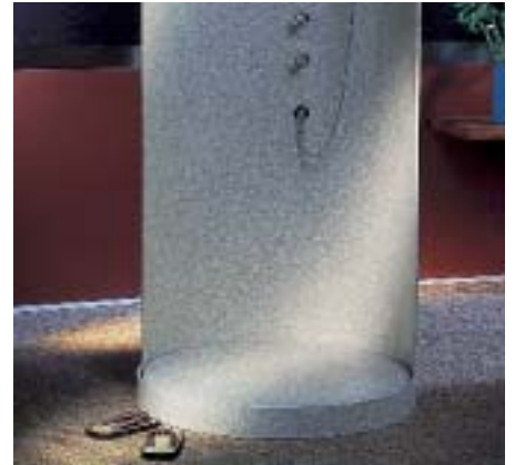
Vielfältige Gestaltungsmöglichkeiten sind mit Corian im Sanitärbereich möglich

von Corian, die interessante Effekte zuläßt, wenn das Material mit einer Leuchtquelle verbunden wird, konnte überraschen. So stellte Du Pont eine Badewanne aus Corian vom Designer Venaro Gray vor, die durch eine intensive Lichtquelle von innen heraus zu leuchten scheint. Auch die vorgestellte Dusche aus Corian stellt eine Designstudie dar und ist zur Zeit nicht als Serienprodukt erhältlich.