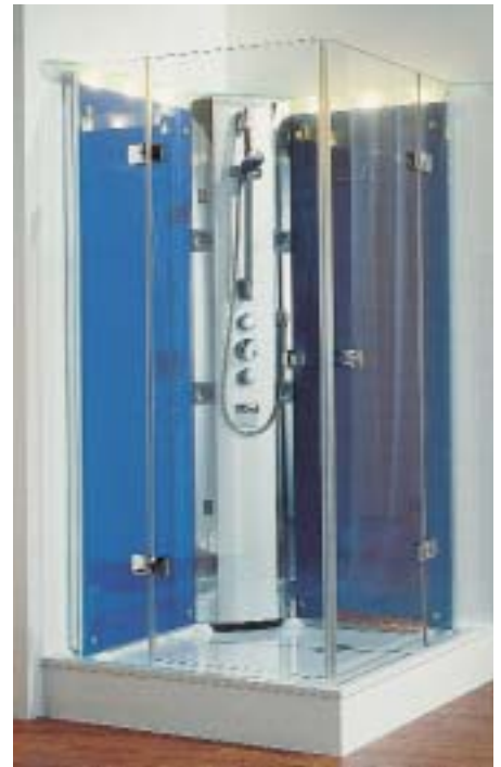
Die gläsernen Rückwände der Entrada 5000 strahlen kurzweilige Strahlungswärme ab

dem Normal- und Laminarstrahl verfügt das Duscha Handy über einen sogenannten Wohlfühlstrahl, der sich weich auf die Haut legen soll. Geliefert werden Duscha Handy oder das Duscha 500-Set (mit Stange und Schlauch) wahlweise in Echtchrom oder in Weiß. Lieferbar sind Duscha Handy und Set ab Juni 2001.