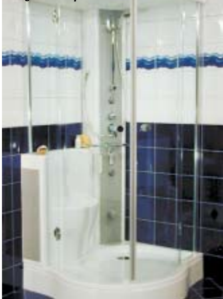
Das Designbüro Spannagel und Partner entwarf das transparente Dampfbad Vegas für Repabad

× 95 cm) speziell für Kunden entwickelt worden, die nur wenig Platz zur Verfügung haben. Das vom Kölner Designbüro Spannagel + Partner entwickelte Dampfbad zeichnet sich zudem durch Transparenz aus, da mit nur einem einzelnen Sitzelement sowie einem Multifunktionselement die Funktionselemente auf ein Minimum reduziert worden sind. Fliesen und Bordüren im Badezimmer können in die Gestaltung eingebunden werden. Um den Wellness-Gedanken voll entfalten zu können, runden Zubehöroptionen wie Aroma-, Farblicht- sowie Klangtherapie ab. Alle Funktionen sind von innen zu bedienen. Um Vegas möglichst passend zur Badausstattung zu gestalten, kann aus vier verschiedenen Armaturen gewählt werden.