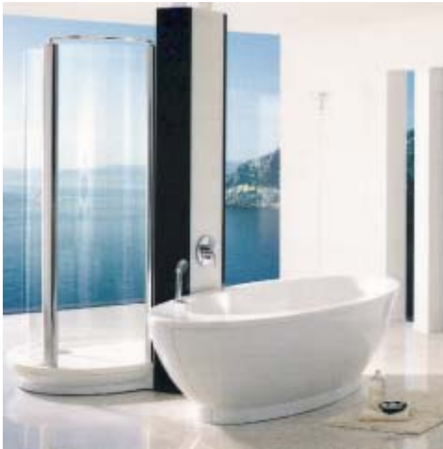
Der ganzheitliche Ansatz von Fantastic soll individuelle Lösungen für praktisch alle Badgrößen und Grundrisse ermöglichen

diesen ganzheitlichen Gestaltungsansatz mit Leben zu füllen, umfaßt das modulare System freistehende und wandgebundene Wannens mit und ohne Whirlpool-Ausrüstung, Duschwannen, Echtglas-Duschwän-