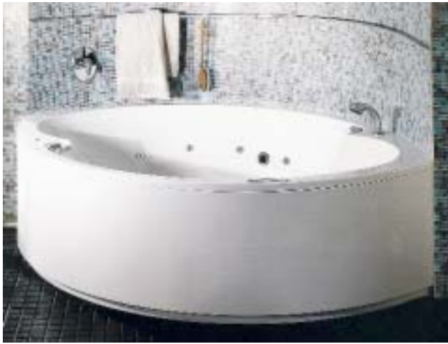
Die neue Wanne Portofino Trend Duo ist mit 234 cm Länge eine der größten Badewannen

Screen sorgt für eine einfache Bedienung. Bei der Duscholive Medium kann die Montage an bauseits gestalteten Wänden erfolgen. Wie ihre Top-Schwester ist sie wahlweise in 100 oder 125 cm Schenkellänge bzw. 236 cm oder 213 cm in der Oberfläche Steel erhältlich.