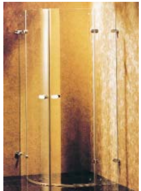
Die Beschläge der Gala Glasdusche sind innen versenkt und bündig mit der Glasoberfläche

schen sind in sechs verschiedenen Varianten verfügbar. Die Wandanbindung der Festsegmente erfolgt bei der Variante Gala plus mit einer durchgehenden Aluminium-Wandleiste in Beschlagfarbe.