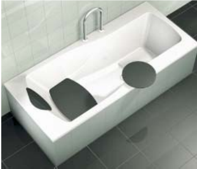
Funktionales Zubehör soll das Ein- und Aussteigen in der Wanne Activa für alle Generationen erleichtern

gramme individuell angepaßt. Vier Dampf- und Massageprogramme stehen bei Vapora Comfort zur Verfügung. So soll zum Beispiel das Programm Fitneß durch ein heißes Bad mit abschließenden kalten Beingüssen das Immunsystem aktivieren. Um den Einbau von Eckwannen zu erleichtern, hat Düker eine neue Komplettlösung entwickelt. Mit dem Eckwannen-Einbausystem soll sich die Montage einfacher und sicherer gestalten.