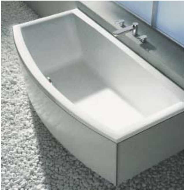
Die neue Badewanne Futura kombiniert eine rechteckige Grundform mit einem einladend geschwungenen Schenkelbogen

neuartigen, ergonomisch platzierten Kombidüsen ausgerüstet. Die Massagewirkung des Systems Whirlfit Forte wurde um eine Rücken- und Fußmassage ergänzt.