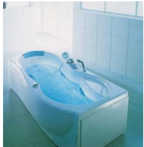
Hydromassagen per Ultraschall sollen mit Hydrosonic von Teuco möglich sein

nutzt werden können, auch Hochfrequenzschallwellen sollen tief in die Haut dringen, dort den Zellstoffwechsel fördern und die Sauerstoffaufnahme verbessern. Nach Angaben von Teuco bewirkt dies eine Straffung des Hautgewebes, eine Verbesserung der Kondition und eine Verminderung von Hautun Schönheiten. Ultraschall besteht aus hochfrequenten Schallwellen, die von der Medizin schon seit Jahrzehnten in verschiedenen Anwendungsbereichen (z.B. in der Diagnostik) eingesetzt werden. Der Ultraschall soll eine Tiefenwirkung auf den