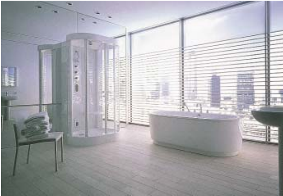
Foster Bathroom: Das Bad von Lord Norman Foster für Hoesch und Duravit

Die neue Dampf-/Duschkabine Abano Primo ist auch für den Einsatz in kleinen Bädern entwickelt worden. Fünf Varianten stehen zur Verfügung. Quadratisch und trotz der geringen Abmessungen komfortabel soll Abano Primo 1100 für zwei Personen sein. Dieser großzügige Eindruck wird optisch durch die durchgängige Frontverglasung unterstützt. Diese Transparenz nehmen auch die Ein-Personenmodelle Abano Primo 900/900 sowie Abano Primo 100/800 in Links- und Rechtsausführung auf.