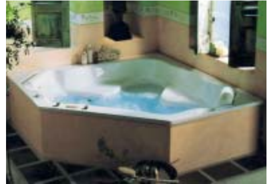
Die Produktwelt Mediterraneo von Galatea ahmt südländische Lebensart nach

Das Themenbad Zen, gestaltet von Signoform, soll asiatisches Flair vermitteln mit einer diesem Kulturkreis so eigenen Atmosphäre der Entspannung, Ruhe und Harmo-