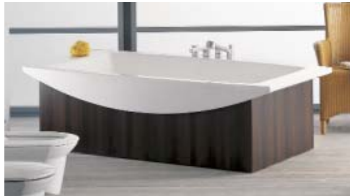
Die Badewanne Mylife kann mitten im Raum aufgestellt werden

Die quadratische Duscheneinheit Modell 142 Next soll sich problemlos im kleinen Badezimmer unterbringen lassen. Das neue Modell ist in zwei zusätzlichen Ausstattungen lieferbar. Zum einen soll die Duscheneinheit in eine Sauna umfunktioniert werden können, zum anderen sind die technischen Gegebenheiten für die Durchführung von farbtherapeutischen Effekten gegeben. Mit Hydrosonic hat Teuco ein Whirlsystem mit Ultraschall vorgestellt. Dieses System soll nicht nur zur reinen Wassermassage ge-