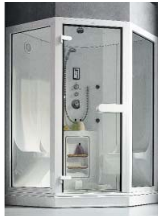
Der Innenraum der Dampf-/Duschkabine für zwei Personen Abano Uno 1300 Nova ist großzügig dimensioniert

Der Innenraum der Dampf-/Duschkabine für zwei Personen Abano Uno 1300 Nova ist durch den Wegfall des Technikraumes besonders großzügig gestaltet. Dadurch soll auch die Montage in der Ecke, ohne Abstand zur Wand, möglich sein. Vor allem für den Einsatz im öffentlichen Bereich stellt Hoesch die Dampfkabinen Abano Uno bzw. Abano Duo jetzt auch in der Abmessung 2,5 × 2,5 m her. Neun bis zwölf Personen finden hier Platz.