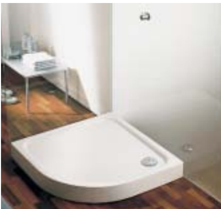
Die Duschwanne Zirkon ist nun auch in der Abmessung 100 × 100 cm erhältlich

lich steilen Neigungswinkel ausgestattet, so daß die Wanne nicht spiegelbildlich ist. Die Novola gibt es in zwei verschiedenen Außenmaßen. Die Modelle 180 × 80 cm haben einen Mittelablauf. Die vier unterschiedlichen Außenformen (Rechteckmodell, Octav-, Sesto- und Oval-Variante) geben Gestaltungsspielraum bei der Planung. Bei der kleinen Variante mit einer Außenabmessung von 170 × 750 cm im Rechteckformat haben die Dautphetaler in erster Linie an die Zielgruppe der Renovierer gedacht. Einen „Mehr-Wert“ sollen die Wannen mit einigen optional erhältlichen Zubehörteilen wie zum Beispiel Griffen, Handtuchstange/Reling oder einem Nackenkissen aus Levagel erhalten. Der „Dauerbrenner“ Zirkon wurde um eine zeitgemäße Abmessung ergänzt. Die Duschwanne ist nun auch in der Abmessung 100 × 100 cm in den drei Tiefen 35, 65 und 140 cm erhältlich.