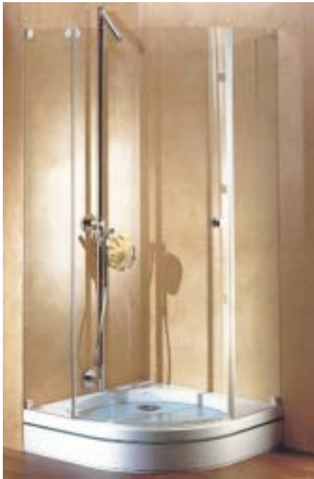
Die Duschwanne von Sprinz besteht aus Einscheibensicherheitsglas und ist in verschiedenen Ausführungen erhältlich

stehen können, werden bei der Ganzglasdusche Sirius durch beidseitig bündig in Glaswände und Glastüre eingelassene Beschläge ersetzt. Damit soll der Beschlag entsprechend der Glasscheibe nur noch rund 8 mm stark sein und somit die schnelle Pflege erleichtern. Die hochwertige Glasdusche aus Einscheibensicherheitsglas gibt es in Viertelkreis-, Fünfeck-, Eck- sowie als Nischenausführung. Alle Varianten werden entsprechend individueller Raumvorgaben wie Dachsträgen oder Wandvorsprüngen vom Hersteller individuell angefertigt. Von der Veredelung der Glasoberfläche mit Spriclean wird eine schmutz- und wasserabweisende Wirkung versprochen. Die Spiegelheizung Mirotherm verbindet die optischen Attribute von verspiegeltem