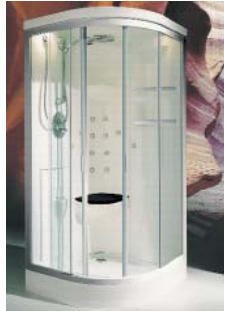
Die Steuerung von Vapora Comfort stellt nach Eingabe der persönlichen Daten individuelle Dampf- und Massageprogramme zusammen

Ein Bad soll laut Düker ein Genuß für alle Sinne sein – unter dieser Maxime haben Techniker, Designer und Wissenschaftler gemeinsam den sogenannten Erotikpool entwickelt. Die Karlstädter verweisen dabei auf die althergebrachte Ver-