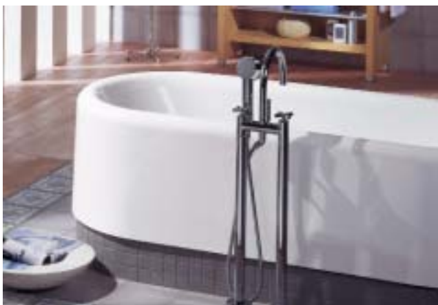
Die neue, freistehende Quaryl-Badewanne Nexion ist innen und außen aus einem Guß

Im sogenannten Aqua und Air Bereich stellte V & B eine neue Generation von Bodendüsen mit dem Namen Quaryl Unique für Quaryl-Badewannen vor, die nun im Bodenbereich der Wanne integriert werden, so daß sie nicht mehr zu spüren sein sollen. Auch die Beleuchtung sowie der Ab- und Überlauf fügen sich sehr flach in die Badewanne ein. Die Technik rückt somit nicht nur optisch dezent in den Hintergrund. Die drei neuen Whispersysteme Whisper Airpool, Whisper Whirlpool und Whisper Combipool sollen besonders leise flüstern und das Wellness-Gefühl unterstreichen. Alle drei Systeme gibt es auch in einer Luxusausführung mit automatischem Programm, Pulsator, regelbarer Wirbelung und weiteren Ausstattungsmerkmalen. □