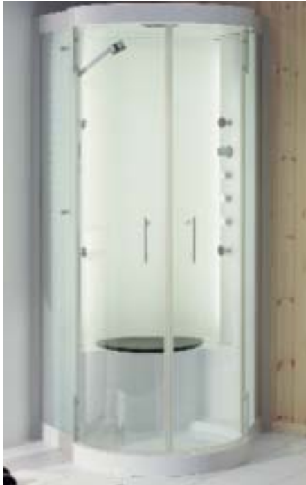
Nach dem Dampfbad in Steam Fit erfrischt eine kühle Brause