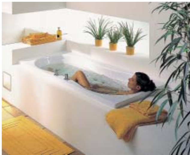
Wellness pur kann man laut Kaldewei in der Megaform mit Vivo-Vario-Plus-System erleben

Kaldewei nahm die ISH zum Anlaß, neben den bereits vorhandenen Modellen, dreizehn weitere designorientierte Bade- und Duschwannen in Starylan anzubieten. Die Materialkombination aus Stahl und Acryl wird zum Beispiel bei den Badewannen-