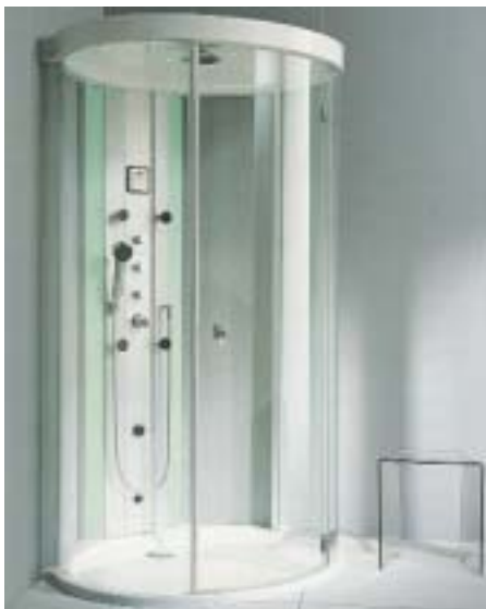
Der ovale Glaskörper der Progress Forte Dampfdusche sorgt für transparente Offenheit

Daß sich ein komfortables Dampfbad platzsparend im Badezimmer integrieren läßt, wollte Koralle zur ISH 2001 mit der neu entwickelten Progress Forte Dampfdusche unter Beweis stellen. Dabei soll der ovale Glaskörper für eine transparente Offenheit