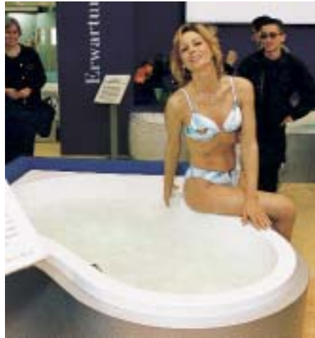
Die Präsentation des Erotikpools von Düker auf der ISH machte Lust zum Ausprobieren

wandtschaft von Badkultur und Erotik – nach ihrer Auffassung prickelt es im Bad auch schon einmal im übertragenen Sinne. Das erotische Badeprogramm soll nun ein sinnlich-wohlthuendes Vergnügen bereiten, wobei durch die Ausrichtung der Düsen insbesondere erogene Zonen im Nacken, am Rücken, an den Innenseiten der Schenkel und an den Füßen stimuliert werden sollen. Das sinnenfreudige „Prickeln“ soll durch fein abgestimmte Essenzen der Aromatherapie verstärkt werden. Beim Erotikprogramm wird dem Badewasser das aphrodisierende Aroma Ylang-Ylang zugesetzt. Zusätzlich tauchen Lichtstrahler mit automatischem Farbwechsler den Pool in ein stimmungsvolles Farbenspektrum und sollen so für ein erotisch-sinnliches Ambiente sorgen. Natürlich kann der Benutzer bzw. können die Benutzer zwi-