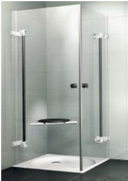
Die Konstruktionselemente der Activa-Duschabtrennung können sowohl beim Ein- und Ausstieg als auch beim Duschen als Griff dienen

gramme individuell angepaßt. Vier Dampf- und Massageprogramme stehen bei Vapora Comfort zur Verfügung. So soll zum Beispiel das Programm Fitneß durch ein heißes Bad mit abschließenden kalten Beingüssen das Immunsystem aktivieren. Um den Einbau von Eckwannen zu erleichtern, hat Düker eine neue Komplettlösung entwickelt. Mit dem Eckwannen-Einbausystem soll sich die Montage einfacher und sicherer gestalten.