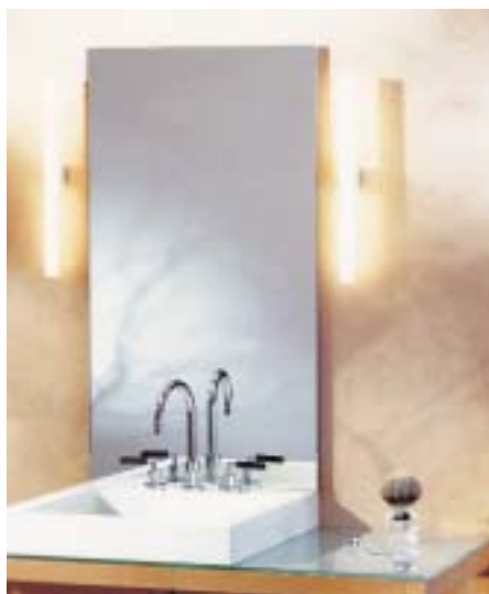
Die Spiegelheizung Mirotherm verbindet die optischen Attribute von verspiegeltem Glas mit Strahlungswärme durch eine integrierte Heizung

stehen können, werden bei der Ganzglasdusche Sirius durch beidseitig bündig in Glaswände und Glastüre eingelassene Beschläge ersetzt. Damit soll der Beschlag entsprechend der Glasscheibe nur noch rund 8 mm stark sein und somit die schnelle Pflege erleichtern. Die hochwertige Glasdusche aus Einscheibensicherheitsglas gibt es in Viertelkreis-, Fünfeck-, Eck- sowie als Nischenausführung. Alle Varianten werden entsprechend individueller Raumvorgaben wie Dachsträgen oder Wandvorsprüngen vom Hersteller individuell angefertigt. Von der Veredelung der Glasoberfläche mit Spriclean wird eine schmutz- und wasserabweisende Wirkung versprochen. Die Spiegelheizung Mirotherm verbindet die optischen Attribute von verspiegeltem