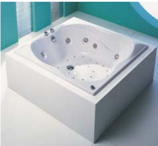
Die quadratische Ergo-Whirlwanne Santa Catarina bietet viel Bewegungsfreiheit