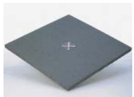
Die bodenebene Dusche Poresta-BF soll einfach und schnell vom Installateur zu installieren sein

schnell und einfach möglich sein, ohne einen herkömmlichen Sockel gießen zu müssen. Die wärmedämmenden Eigenschaften