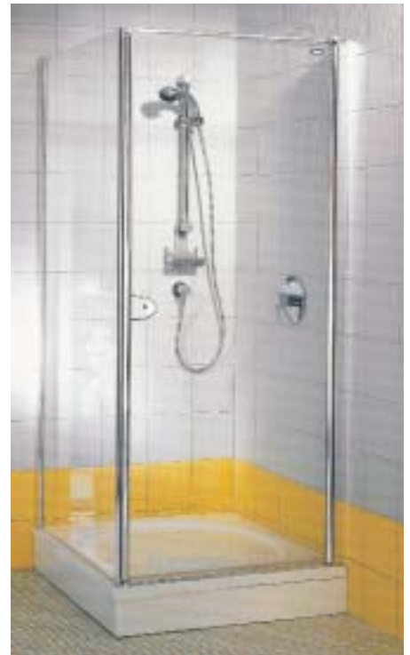
Bauliche Toleranzen vor Ort bis zu 25 mm sollen in den Profilen von Magic Top ausgeglichen werden können

Das rahmenreduzierte Erscheinungsbild der neuen Duschwand-Kollektion Magic Top ist geprägt von schlanken vertikalen Profilen, transparentem, 5 mm dickem Einscheiben-Sicherheitsglas und speziellen Griffen.