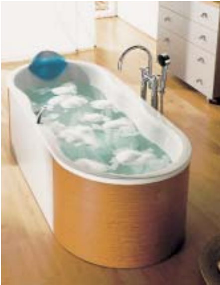
Der Dreifachschwung kennzeichnet die neue Badewannen-Familie Novola von Bamberger

lich steilen Neigungswinkel ausgestattet, so daß die Wanne nicht spiegelbildlich ist. Die Novola gibt es in zwei verschiedenen Außenmaßen. Die Modelle 180 × 80 cm haben einen Mittelablauf. Die vier unterschiedlichen Außenformen (Rechteckmodell, Octav-, Sesto- und Oval-Variante) geben Gestaltungsspielraum bei der Planung. Bei der kleinen Variante mit einer Außenabmessung von 170 × 750 cm im Rechteckformat haben die Dautphetaler in erster Linie an die Zielgruppe der Renovierer gedacht. Einen „Mehr-Wert“ sollen die Wannen mit einigen optional erhältlichen Zubehörteilen wie zum Beispiel Griffen, Handtuchstange/Reling oder einem Nackenkissen aus Levagel erhalten. Der „Dauerbrenner“ Zirkon wurde um eine zeitgemäße Abmessung ergänzt. Die Duschwanne ist nun auch in der Abmessung 100 × 100 cm in den drei Tiefen 35, 65 und 140 cm erhältlich.