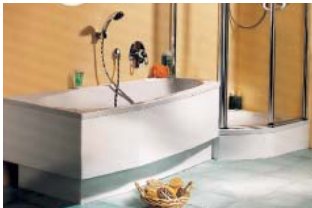
Die bekannte Piccolo-Kleinbadlösung von Duscholux wurde zeitgemäß überarbeitet

produkten mit speziellen Duschwannen zur Verfügung. Mit einer Überarbeitung der bereits im Jahre 1993 eingeführten Kleinbadlösung Piccolo will sich Duscholux „wieder klar von den vielen Nachahmern abgrenzen“. Die zeitgemäße Optik wird vor allem durch die leicht gewölbten Außenkonturen der Acrylwannen und die schlanken Profile der Echtglas-Duschwand erreicht. Letztere ist 190 cm hoch und mit Pendeltür sowie Seitenteil mit integrierter Deckenstütze ausgestattet. Als weiteres Merkmal der aktuellen Version heben die Schriesheimer eine verbesserte Regulierbarkeit an der Schnittstelle zwischen Bade- und Duschwanne hervor.