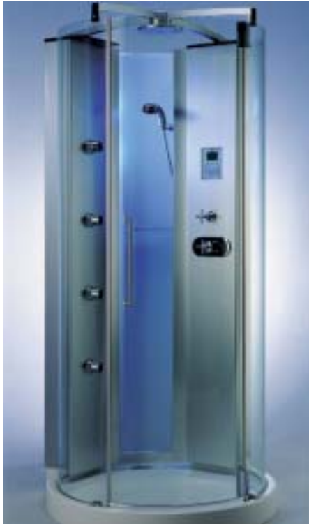
Der Wasserstrahl ist von innen beleuchtet und soll das Gefühl vermitteln, in flüssigem Licht zu duschen

als Projektionsfläche für ein breites Spektrums farbigen Lichts. Scala soll sich somit zu individuellen Lichttherapie eignen. Die einzelnen Farben und Farbfolgen sind vom Benutzer nach Belieben wählbar. Eine zusätzliche Lichtquelle ist in den Kopf der Monsunregen-Brause integriert.