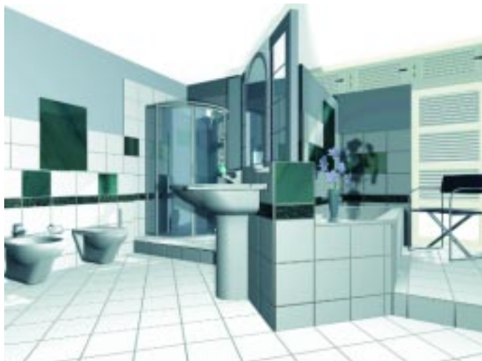
Die Badplanungs-Software „PaletteCAD“ bietet Palette Datensysteme in der neuen Version 3.0 an

Palette Datensysteme ist im September 2000 als viertes Softwarehaus Partner der Arge Neue Medien geworden. Den Kunden in der Sanitärbranche stehen damit die umfangreichen Grafik-Kataloge der deutschen Sanitärindustrie zur Verfügung. Als zusätzlichen Service bietet das Unternehmen auch die Erstellung