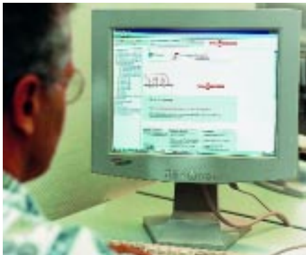
Wichtige Informationen und Daten sind mit TDis von Viessmann schnell und aktuell verfügbar

Mit dem Online-Informationssystem „TDis“ möchte Viessmann seinen Kunden eine zusätzliche moderne Informationsquelle bieten, in der neben Service- und Betriebsanleitungen,