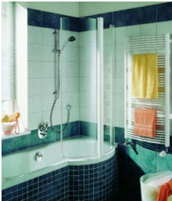
Badewannen-Spritzschutz von Kermi für die Bette Cora