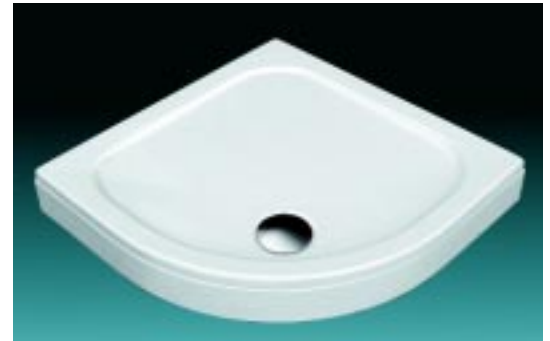
2,5 cm tiefe Duschwannen Udine von Repabad

Die Wendlinger erweiterten ihr Programm im Bereich der superflachen Duschwannen um drei weitere Modelle. Udine heißt die nur 2,5 cm tiefe Viertelkreis-Duschwanne