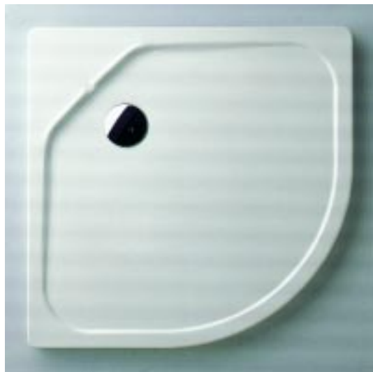
2,5 cm hohe Duschwanne Fontana von Kaldewei

Kaldewei 59229 Ahlen Telefon (0 23 82) 78 50 Telefax (0 23 82) 78 52 00 http://www.kaldewei.de