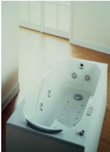
Acrylwanne Regatta von Hoesch mit integrierter Duschzone als Whirlpool

Kermi 94447 Plattling Telefon (0 99 31) 50 10 Telefax (0 99 31) 30 75 http://www.kermi.de