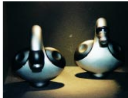
Utopisch anmutende Zweigriff-Waschtisch-armatur Xfere von Hesa

irdischen. Mit einer 90-Grad-Drehung aus dem Handgelenk kann man die ergonomisch positionierten Ventile ganz öffnen oder schließen. Momentan beinhaltet das den EU-Richtlinien entsprechende Xfere-Programm verschiedene Armaturen für Waschbecken, Wanne, Dusche, Bidet und Küche. Der Verkaufspreis für die Badezimmerserie (Waschtisch, Bidet, Badewanne) beträgt laut Hersteller 1 250 000 Lire, also knapp 1300 DM.