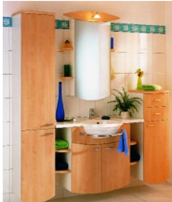
Besonders für kleine Bäder ist die Badmöbelkollektion Picoli gedacht

Terrano heißt das neue Holzdekor-Programm von Marlin. Sämtliche Badmöbel sind in Holzönen gehalten und sollen ein mediterranes Flair verbreiten. Die Auszugskörbe der offenen Schränke sind aus Rattan, die Schubkästen aus Vollkunststoff