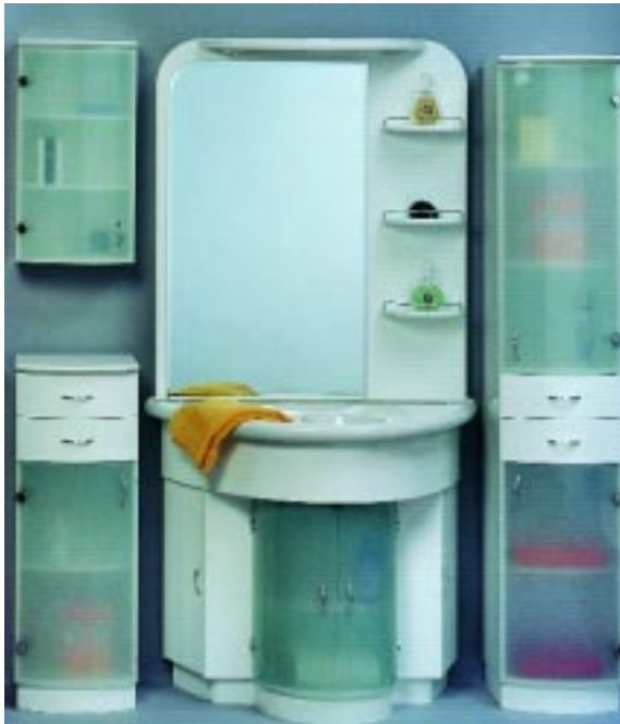
Badmöbelprogramm Elypsia von Allmani

Zum Waschtisch passend ist das Spiegelement mit Halogenbeleuchtung, Lichtschalter und Steckdose gestaltet. Neben dem Spiegel mit Facettschliff sind drei Ablagen mit Chrombügeln vorgesehen.