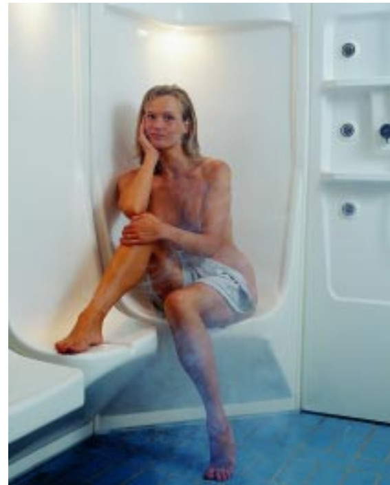
Dampfbäder von Tylö gibt's jetzt auch mit integrierter Beleuchtung und Wasserablauf am Sitz