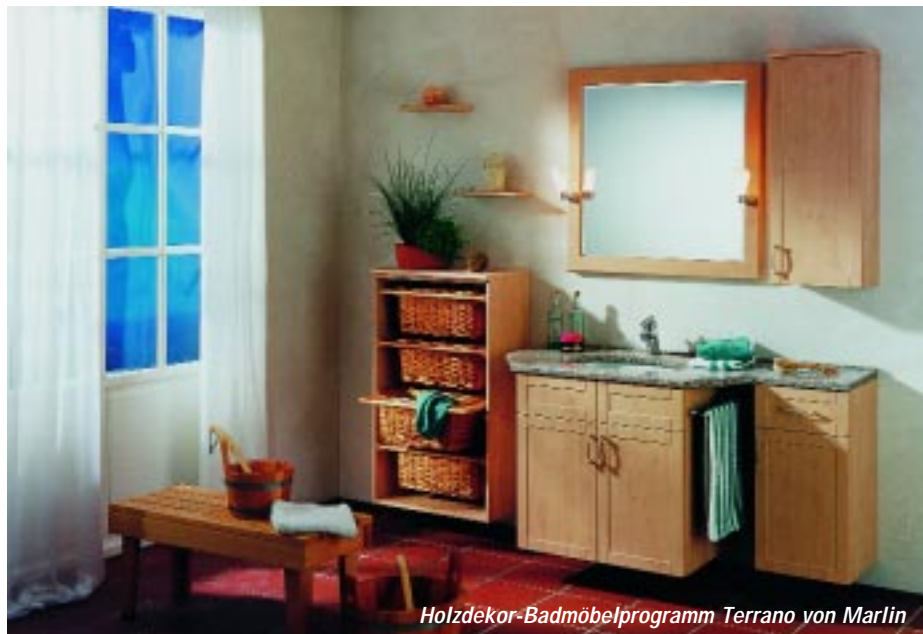
Holzdekor-Badmöbelprogramm Terrano von Marlin