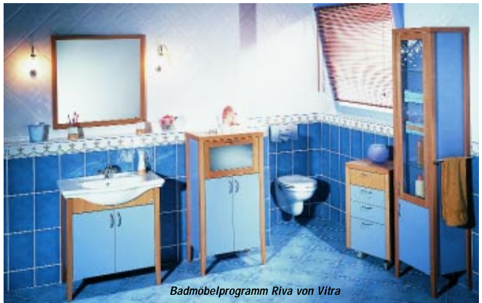
Badmöbelprogramm Riva von Vitra

Eine Ergänzung der Keramikserie Riva sind die gleichnamigen Badmöbel der Kerpener. Zur Kollektion gehören Waschtischunter-