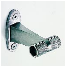
Edelstahl-Kleiderhaken aus der Accessoireserie Minimal von Rapetti

Die neuen Bad-Accessoires Minimal kombinieren Edelstahl mit mattiertem Glas. Ebenso wie die klaren Formen und Linien,