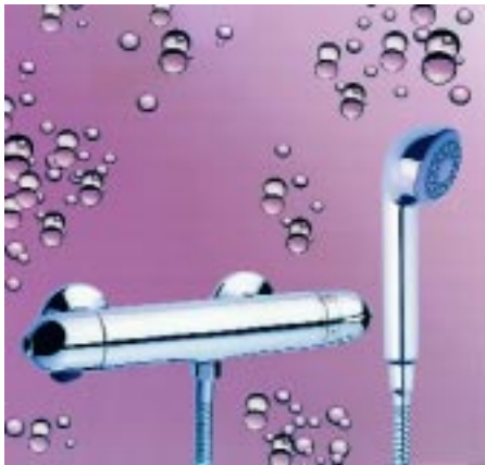
Iqua D10 Duscharmatur mit Thermostat und Sensor von Aquis

Allmani 68199 Mannheim Telefon (06 21) 84 22 90 Telefax (06 21) 8 42 29 49