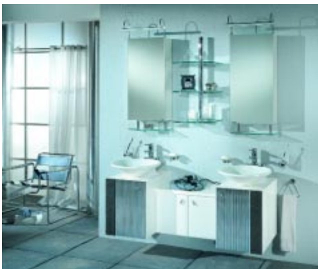
Badanwendung Wellflex-Duett-Chrom von STS