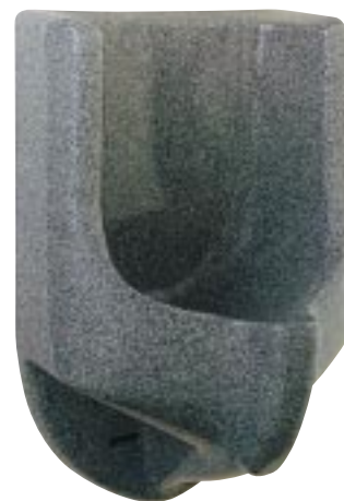
Noflush-Urinal ohne Wasserspü- lung von DRL

Die Hildener erweiterten jetzt die Farbpalette ihrer LGA-geprüften Waterless-No-flush-Urinalen um den Granitlook. Das technische Prinzip bleibt wie gehabt. Ein Eco-Trap-Sifon mit Blue-Seal-Sperrflüssigkeit sowie eine besondere Oberfläche sorgen dafür, daß das Urinal ohne Wasserspülung