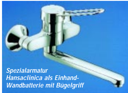
Spezialarmatur Hansaclinica als Einhand-Wandbatterie mit Bügelgriff

Minute. Erst wenn der Hebel über den spürbaren Widerstand bewegt wird, fließt die volle Wassermenge. Zur gesamten Serie, die in Chrom erhältlich ist, gehören Modelle für Waschtische, Bidet, Wanne und Dusche. Letztere gibt es in Aufputz- und Unterputz-Ausführung. Alle Armaturen mit Schlauchanschluß sind eigensicher gegen Rückfluß. Waschtisch- und Bidetarmaturen wurden mit drehbaren Kupferrohren versehen. Als Besonderheit der Serie gilt eine Einloch-Wannenrandarmatur mit Schlauchbrause und flexiblen Schlauchanschlüssen.