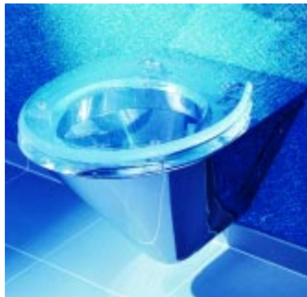
Kompaktes Wand-WC für die Edelstahl-Sanitärserie Rondo

Für die beiden Edelstahl-Sanitärserien Rondo und Prisma bietet der Hersteller seit kurzem zwei neue Wand-WCs an. Sie wurden in ihren Abmessungen den bisher deutlich kleineren Keramik-WCs angepaßt und sollen somit auch für private Bäder und Gästetoiletten besser geeignet sein. Die passenden WC-Sitze gibt's wahlweise aus Acrylglas oder massivem Birkenholz. Außerdem wurde die Serie Prisma um einen neuen vandalensicheren Edelstahl-Sei-