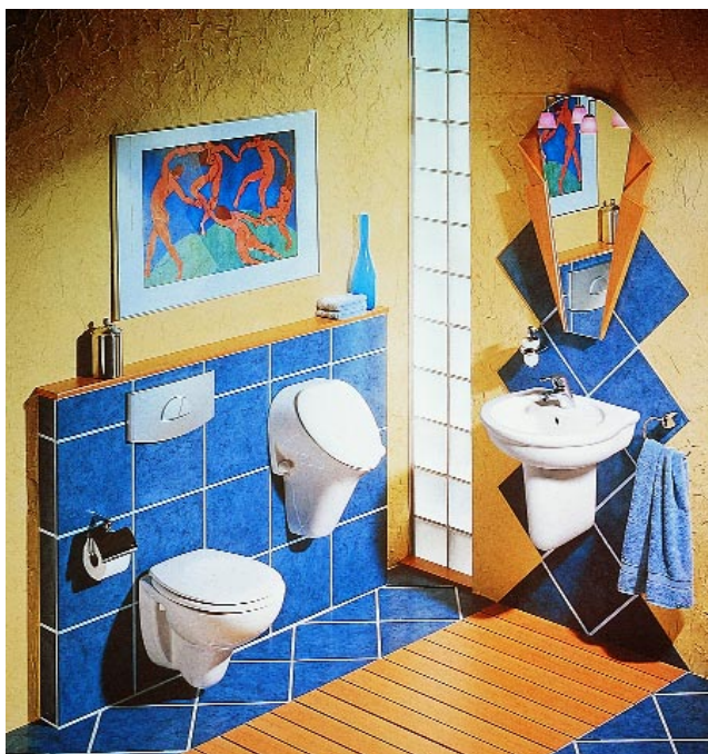
Die Ideal-Standard-Serie San ReMo erhielt jetzt Zuwachs mit Slimline-Maßen