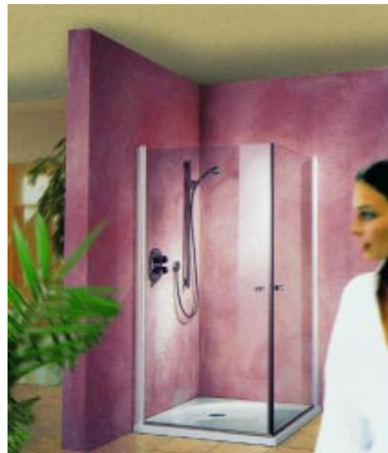
Duschtrennung Young-Family-Maxi von Düker

Die Duschtrennungsserie Young-Family von Düker ist in vier unterschiedlichen Ausführungen erhältlich. Die geschlossene Rahmenlösung mit vertikalen und horizontalen, abgerundeten Profilen bei der Variante Star wird serienmäßig mit dem neuen Star-Tec-Glas des Herstellers ausgestattet. Es soll sich durch eine besonders hohe Bruchsicherheit und Reinigungsfreundlichkeit auszeichnen. Zur technischen Ausstattung gehören gleitrollengelagerte Laufrollen sowie einzeln im Kopfprofil aufgehängte Türblätter. Die Wannenaufsätze Young-Family-Star sind ein- bis dreiteilig, mit und ohne Seitenwand lieferbar und lassen sich beidseitig installieren. Als offene Aufbauvarianten ohne Horizontalprofile werden die Modelle Mini, Midi und Maxi angeboten. Sie sind serienmäßig mit Türhebemechanismus, Einscheibensicherheitsglas und Duraclean-Beschichtung ausgestattet. Ähnlich wie die Mini-Ausführung