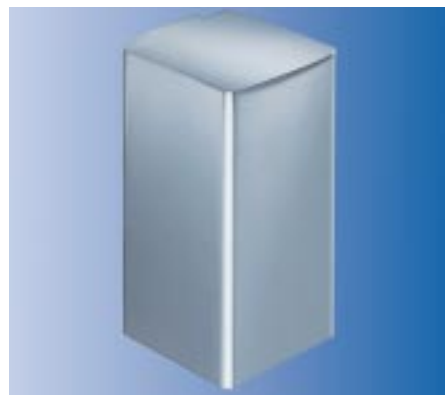
Edelstahl-Abfallbehälter für Papier- handtücher von Vieler