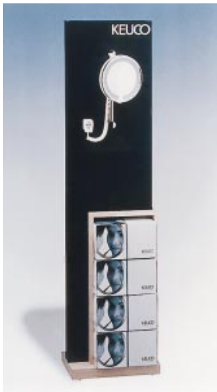
Verkaufsdisplay für die neuen Kosmetikspiegel von Keuco

passenden Dekorsets bzw. Wanddekorscheiben auf das jeweilige Ausstattungsambiente abstimmen. Den Vertriebspartnern steht zum Marktstart neben Broschüren und Anzeigenvorlagen auch ein spezielles Verkaufsförderungspaket zur Verfügung. Zentrales Element ist ein 500 mm breites und 2000 mm hohes Holzdisplay, das mit zwei Originalmodellen, einem Warendepot mit vier Spiegeln in verkaufsgerechter Verpackung, 30 Verbraucherprospekten samt speziellem Halter sowie einer 220-V-Steckdose ausgerüstet ist.