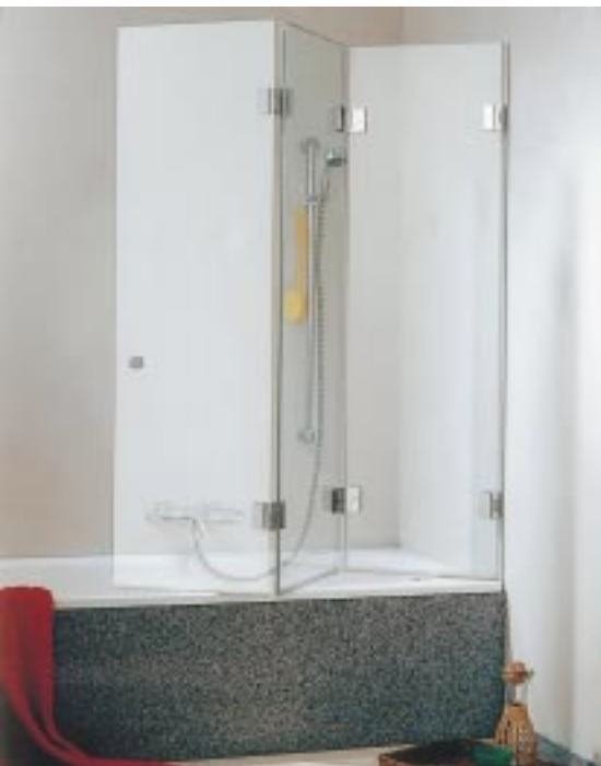
Badewannenaufsatz aus der neuen Duschabtrennungsserie XXL