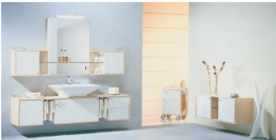
Kama-Möbel Quado mit Korpus in Birnbaumdekor und weißer Thermoformfront in Rillenoptik

liche Fernbedienung geändert werden. Die neue Armatur ist in einer Standardausführung für Mischwasseranschluß lieferbar oder als Komfortmodell mit individueller Temperaturregelung. Beide können mit dem UT-Thermostat Minitherm als Verbrühungsschutz kombiniert werden.