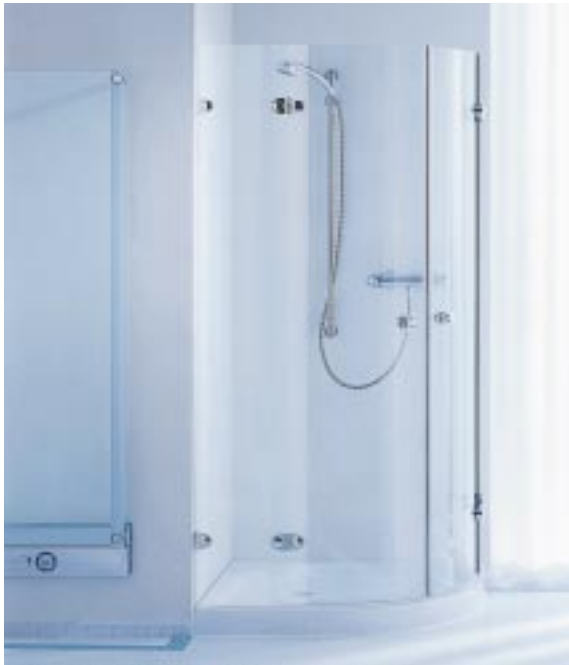
Viertelkreis-Duschabtrennung Spinell und Glasheizkörper Supratherm von Glas-Sprinz

Fünfeck- sowie Viertelkreis-Rundduschen gibt, sind die elliptischen Edelstahlbeschläge, die oberflächenbündig ins Einscheiben-Sicherheitsglas eingearbeitet sind. Die Beschläge sind in den Oberflächen Chrom und gängigen Sanitärfarben erhältlich.