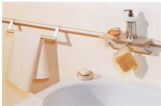
Handtuchhalter, -stangen und Seifenschalen aus eloxiertem Aluminium ergänzen das One-Line-System von Alape

Als Ergänzung des Waschtisch- und Stauraumprogramms On-Line bietet der Hersteller jetzt Accessoires aus einfarbig mattsilber eloxiertem Aluminium an. Handtuchhalter in mehreren Breiten, Handtuchstangen, WC-Rollen- und WC-Bürstenhalter sowie Utensilienkörbe lassen sich in die Aluminiumreling des Programms einhängen und bohrungslos fixieren. Zusätzlich gibt's eine Seifenschale in passendem Design sowie einen Solitär-Spiegelschrank in den Abmessungen 513 x 850 x 124 mm (B/H/T). Jener verfügt über eine integrierte