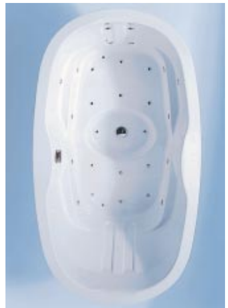
Ausschließlich als Whirlpool erhältliches Modell 770 von Hansgrohe

Schon seit Hansgrohe Mitte letzten Jahres den niederländischen Hersteller von Cleopatra-Whirlpools und -Dampfduschkabinen CPT übernommen hatte (SBZ 14/99), wurde eifrig über eine Ausweitung der Produktpalette bei den Schiltschachern spekuliert. Auf den Frühjahrsmessen zeigten die Schwarzwälder jetzt erstmals ihre unter der Marke Pharo laufenden Whirlpools und Dampfbäder. Die Acrylwannen der Serien 500 und 700 mit angeformten Arm- und Kopfstützen wurden ausschließlich als Whirlpools konzipiert. Nach Firmenangaben sind sie mit 62 cm am Sitzende 20 cm tiefer als herkömmliche Modelle. In der 500er-Version sind alle Wan-