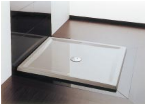
Ultraflache Duschwanne Nano mit mittigem Ablauf

Die Acryl-Eckwannen sind als 1600 × 1000 × 470 mm große, asymmetrische Badewannen in Rechts- und Linksausführung sowie ohne oder mit loser bzw. angeformter Schürze erhältlich. Unter dem Namenszusatz Kreta gibt's eine Wanne in angedeuteter Pfeilform in den Maßen 1900 × 900 × 470 mm ohne oder mit angeformter Schürze. Außerdem wurden die Ergo-Whirlwannen Santa-Barbara und Santa-Monica um die Sechseckwanne Santa-Cruz ergänzt. Weitere Neuheiten sind eine superflache Viertelkreisduschwanne der Serie Armada mit den Abmessungen 1000 × 900 × 65 mm in Links- und Rechtsausführung sowie die ultraflache (32 mm) Duschwanne Nano (1000 × 1000 oder 900 × 900 mm) mit mittigem Ablauf.