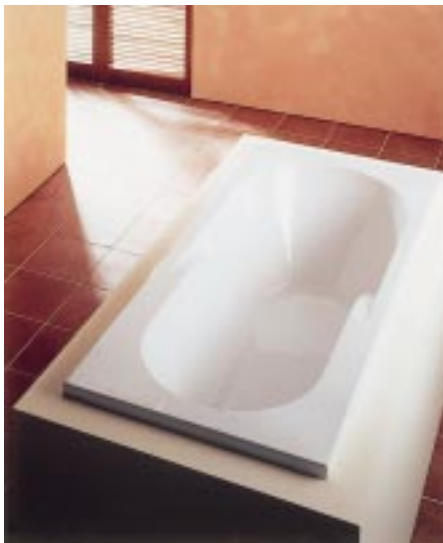
1700 x 750 mm große Regatta von Hoesch

Die Dürener präsentierten komplett neue Wannenfamilien sowie Erweiterungen bekannter Serien. Die neue Wannenfamilie Regatta umfaßt z. B. zwei Dusch- sowie fünf 460 mm tiefe Bade- und Whirlwannen mit variierenden Produktfeatures. Um drei Modelle erweitert wurde die auch mit Whirlsystemen lieferbare Serie Squadra.