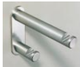
Zweifacher Gaderobenha- ken von Vieler

Mit aktuellen Produkten erweitert Vieler sein Edelstahlprogramm für den Objektbe- reich. Präsentiert wurden neben Gaderoben, Aschern und Behältern vor allem Seifen- spender, Handtuchspender, Abfall- und Hy- gienebehälter mit strichmatter Oberfläche. Somit stehen allein fünf Varianten von Sei- fenspendern zur Auswahl. Auch beim De-