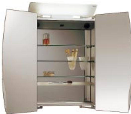
Alu-Spiegelschrank Royal SX mit patentiertem Scharnier

Gleich doppelte Verstärkung erhielt das Spiegelschrankprogramm Royal mit den Modellvarianten 30 und SX. Durch ein patentiertes Scharnier drehen sich beim neuen Royal SX beide Türen seitlich zum Betrachter und bewirken damit einen Wechsel der Perspektive. Zur serienmäßigen Ausrüstung des 640 mm breiten, 665 mm hohen und 150 mm tiefen Alu-Spiegelschranks mit silber-gebeizt-eloxiertem Korpus gehören eine 36-Watt-Leuchtstofflampe, ein Schalter, 2 Steckdosen, Utensilien- und Glasablagen sowie die Rückwandverspiegelung. Ebenfalls neu ist ein 1600 mm hoher, 350 mm breiter und 143 mm tiefer Drehtürenschränk der Collection Royal 30. Der mit