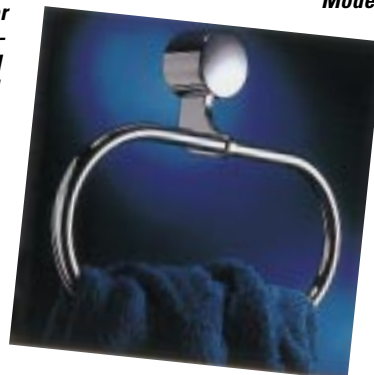
Handtuchhalter der Ausstattungslinie Sol von SAM

SAM , 58688 Menden Telefon (0 23 73) 90 90 00 Telefax (0 23 73) 9 09 01 01