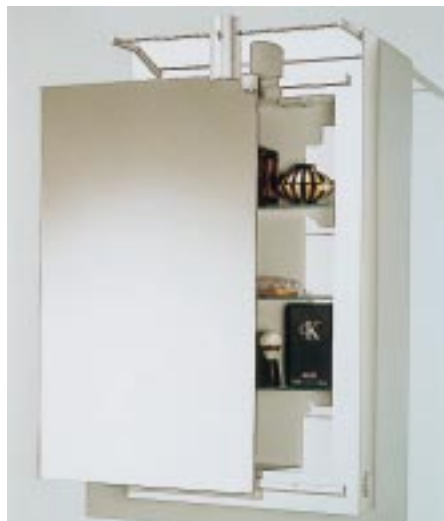
Unabhängig vom Stangensystem läßt sich der One-Line Spiegelschrank auch als Solitär einsetzen

Steckdose, eine Niedervolt-Halogenbeleuchtung, einen Lichtschalter sowie einen Gleittürmechanismus.