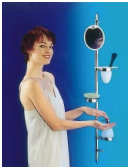
Rund 400 Mark teures Beauty & Care Set der Schiltacher

mostat der Axor-Designlinien erhältlich. Per Trio-Ventil kann die Wanne wahlweise über eine kombinierte Ein-/Überlaufgarnitur befüllt oder mit der Handbrause geduscht werden.