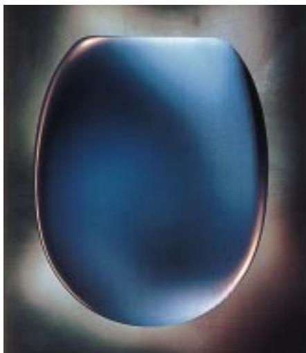
WC-Sitz Fjord von Haro in neuem Design

Hamberger Industriewerke 83003 Rosenheim Telefon (0 80 31) 70 01 76 Telefax (0 80 31) 70 01 79 eMail: s.sarikaya@hamberger.de