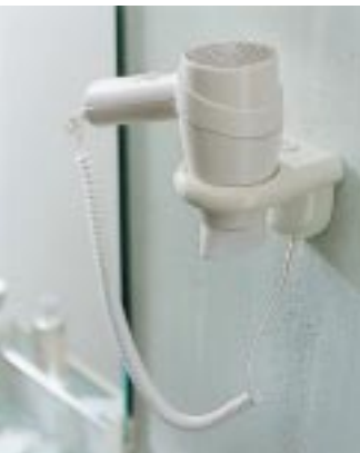
Wandhalter mit Haartrockner aus der Accessoires- serie 477

Für die Sanitärserie 477 präsentierte Hewi jetzt zwei Neuheiten: Das Brauseset und den Wandhalter mit Haartrockner. Wie die an- deren Produkte dieser Serie sind auch sie in insgesamt 19 Farben erhältlich. Das Brau- seset besteht aus einem Nylon-Stangensy- stem mit korrosionsgeschütztem Stahlkern und einem Brausehalter, der in Neigung und