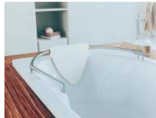
Statt als Whirlpool gibt's die Duo-Wanne Lamora vorerst nur mit Relling und Kissen

Variante des Flaggschiffs Lamora zugun- sten eines eigenen Whirlpools noch etwas bremst, setzt Bamberger bescheiden auf Komplettierung: So erhielt die Duo-Wanne Lamora vom Designstudio J. Flacke jetzt ei- ne verchromte Relling mit Nackenkissen und