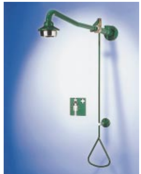
Zugstangenbetätigte Not-Körperdusche von Aqua

liche Fernbedienung geändert werden. Die neue Armatur ist in einer Standardausführung für Mischwasseranschluß lieferbar oder als Komfortmodell mit individueller Temperaturregelung. Beide können mit dem UT-Thermostat Minitherm als Verbrühungsschutz kombiniert werden.