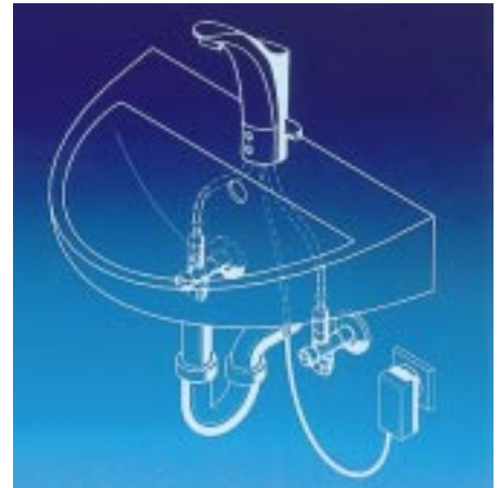
Protronic-Waschtischarmatur mit Batterie und Steckernetzteil

Die elektronische Armaturenserie Protronic wurde jetzt um eine neue berührungslose Waschtischarmatur mit separater Spannungsversorgung über Steckernetzteil und integrierter 6V-Notstrombatterie für Stromausfälle ergänzt. Ihre durch Echtglaslinsen geschützte optoelektronische Sensorik stoppt automatisch, wenn sich der Nutzer aus dem Infrarotbereich entfernt. Eine Mikrochip-Steuerung sorgt für die Benutzererkennung in 0,6 Sekunden, die automatische Anpassung der Sensorik an die jeweiligen Lichtverhältnisse und schaltet den Wasserstrom bei Dauerreflexion ab. Weitere Funktionsparameter, wie Fließzeit und Sensorreichweite, können über eine zusätz-