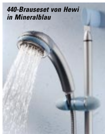
440-Brauseset von Hewi in Mineralblau

sign blieb der Hersteller den einfachen geometri- schen Formen treu.