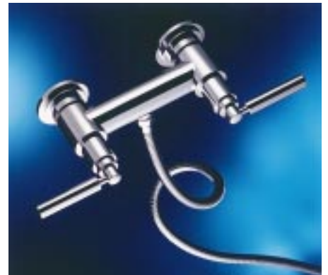
Duschbatterie SH 100 in der Griffvariante Athen

führung sowie eine Kopfbrause erhältlich. Als Griffe stehen die Varianten Tokio, Manhattan, Chicago und Athen zur Verfügung. Neu innerhalb des Accessoireprogramms SH 100 ist ein Seifenspender. Auch für die Kreuzgriff-Armaturenserie Konus wurden Programmergänzungen entwickelt. Neu