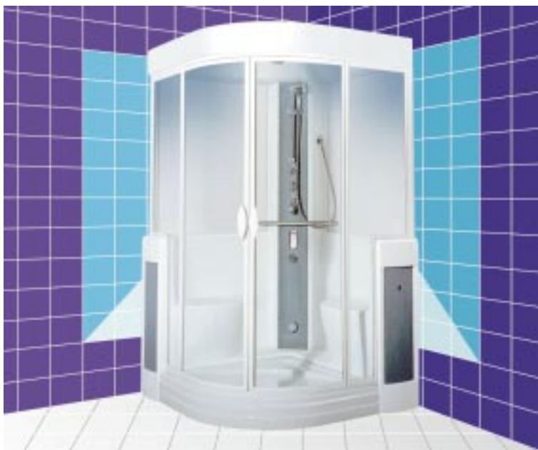
Dampfbad Frisco C von Repabad

Außerdem stellten die Wendlinger ihre neue Whirlpoolsteuerung New-Generation-2000 vor. Selbsterklärende Symbole mit LED-Lichtelementen sollen die Bedienung vereinfachen. Konnten die Kontrolleinheiten bisher nur auf dem Wannenrand platziert werden, ist jetzt auch die Anordnung unterhalb bzw. auf Höhe des Überlaufes mög-