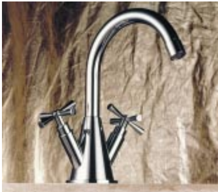
Kreuzgriff-Armatur Konus von SAM

sind hier Zweigriffmischer in AP-Ausführung für Wanne/Brause und Dusche sowie ein Thermostat für die Dusche und ein UP-Thermostat mit bzw. ohne Mengenregulierung. Zusätzlich gibt es im Accessoiresbereich einen neuen Glashalter.