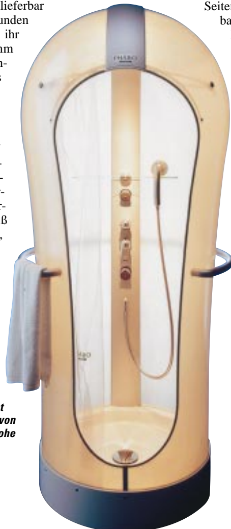
Duschkonzept Cocon von Hansgrohe