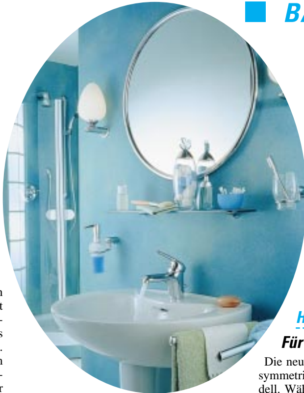
Passend zum gleichnamigen Einhandmischer-Programm: Hansaronda-Accessoires

Bicolor sowie einer Chrom/Gold-Variante.