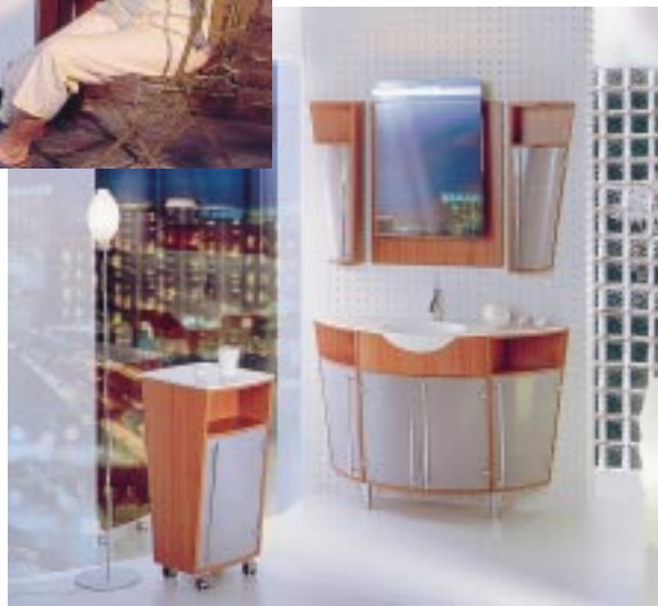
Schnelldreher Starling für Junggebliebene