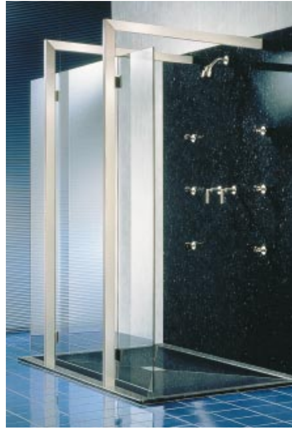
Luxusdusche TerraShower von Koralle

Die Duschabtrennung TerraShower setzt auf die Materialien Granit, Edelstahl und Echtglas. Zwei senkrechte Träger in Edelstahloptik, rechtwinklig in 2220 mm Höhe zur Wand geführt, prägen die puristische äußere Erscheinung. An ihnen ist die nahezu quadratische Front (1995 × 1910 mm) aus Einscheibensicherheitsglas befestigt. Die beiden gläsernen Sei-