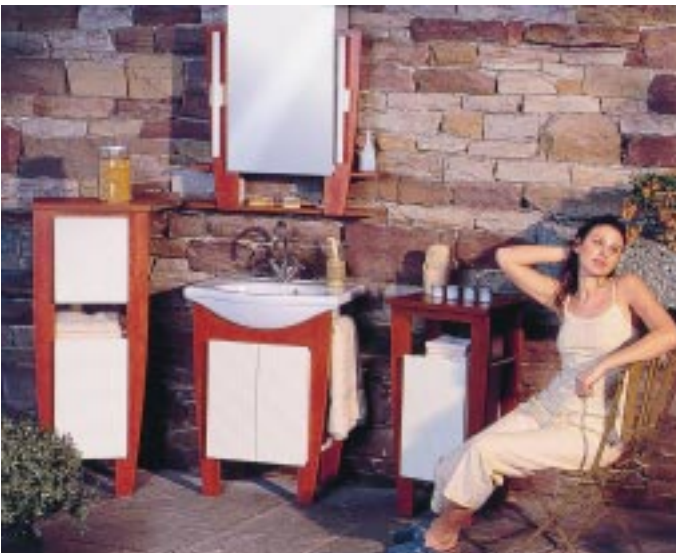
Familienbad Freeling von Schweizerbad