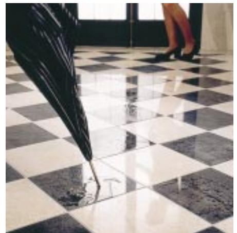
Polierte Feinsteinzeugfliesen Electra mit „Vakuum-Rutschhemmung“

Die Loop-Serie umfaßt vier Einbauwaschtische, vier Unterbauwaschtische und als Solitär einen Aufsatzwaschtisch mit einem Durchmesser von 38 cm. Übergreifendes Design-Kriterium ist die runde, einfache Form der Waschtische und die großvolumige Tiefe der Becken. Als Besonderheit sind die neuen Unterbauwaschtische, die flächenbündig unter die Trägerplatten montiert werden, auch im äußeren Sichtbereich voll glasiert. Es gibt sie mit den Innendurchmessern 43, 38, 33 und 28 cm sowohl mit als auch ohne Überlaufloch. Letzteres gilt ebenso für die Einbauwaschtische in den Größen 51, 45, 39 und 34 cm. Auch sie haben eine glasierte Außenfläche im Sichtbereich. Der Aufsatzwaschtisch ist drehbar, da der Überlaufkanal in die äußere Form eingebet-