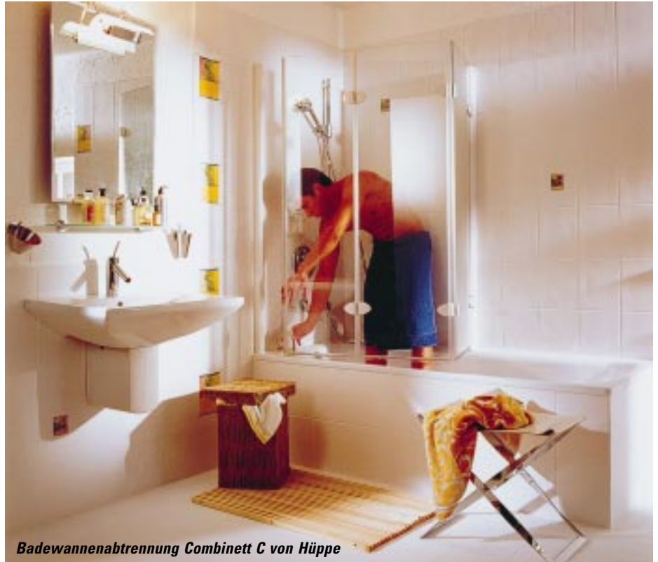
Badewannenabtrennung Combinett C von Hüppe

Auf insgesamt 14 Modelle stockte Hüppe jetzt sein Duschabtrennungsangebot für die Badewanne auf. Die vier neuen sind nach Firmenangaben im mittleren Preissegment angesiedelt. Es handelt sich dabei um die Aronda sowie drei Versionen der Combinett. Mit ihnen will der Hersteller für jede Armaturenposition eine Problemlösung anbieten. Während die Combinett eine klassische Badewannenabtrennung ist, schafft die Combinett B mit ihren vier Segmenten eine komplett geschlossene Duschkabine rund um eine Brausearmatur über dem oberen Drittel der langen Badewannenseite. Die Combinett C läßt sich aufgrund ihrer veränderten Montageposition auch dann komplett wegklappen, wenn die Armatur auf der kurzen Badewannenseite sitzt, und die Aronda umschließt spritzdicht Armaturen,