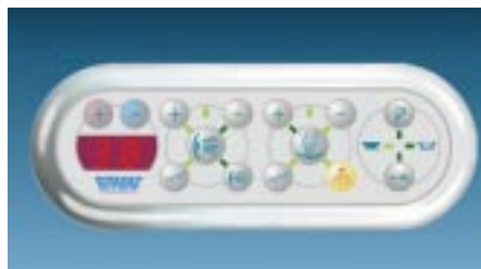
Whirlpoolsteuerung New Generation 2000

Vierwege-Umsteller, zwei Turbo-Jet-Seitenbrausen, eine umstellbare Handbrause mit Stange, eine Reling, ein Halogenlicht sowie ein Electronic-Bedientableau und einen 6-kW-Dampfgenerator mit Dampfdüse. Während bei der Version C zwei Acryl-Wandverkleidungen über den Sitzelementen hinzukommen, entfallen beim Einsteigermodell B (ab 10 500,- DM plus MwSt.) die Sanitärarmaturen einschließlich Reling. Außerdem wird das hohe Multifunktionspaneel durch ein halbhohe Eckpaneel ersetzt. Gegen Aufpreis gibt's die Glasbeschichtung Repa-Clear, eine im Kuppeldach vormontierte Kopfbrause, einen Themosta-