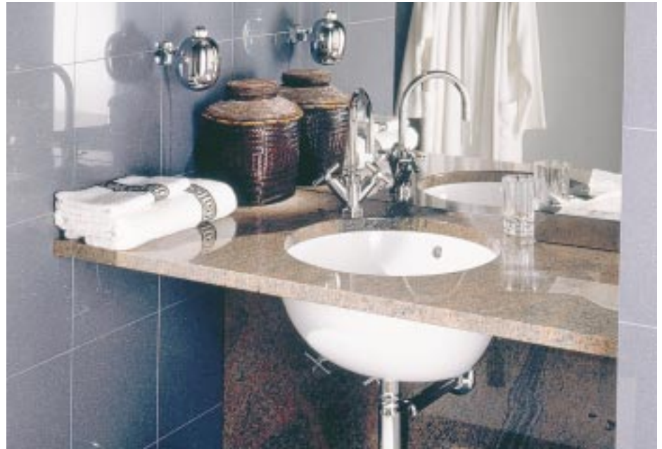
Unterbauwaschtisch Loop von Villeroy & Boch

Sprinz 88214 Ravensburg Telefon (07 51) 37 90 Telefax (07 51) 3 79 44