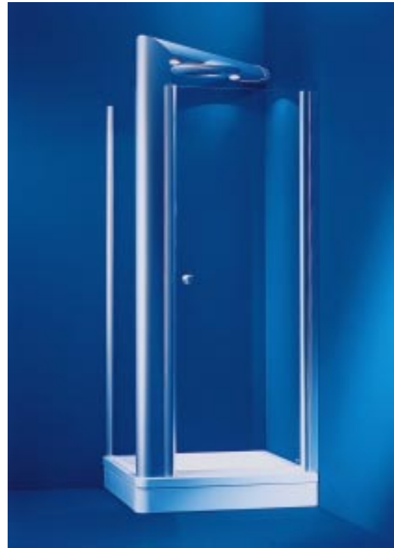
Den Pharo-Duschtempel gibt's jetzt auch in einer 90er Variante

brühschutz zur Ausstattung. Zu Preisen ab 9300,- DM plus MwSt. soll die „Insektenhülle“ noch in der ersten Jahreshälfte 2000 lieferbar sein. Außerdem runden die Schwarzwälder runden die Duschtempelprogramm mit einer 90er Variante nach unten ab. Das 900 x 1242 x 2267 mm große Teil ist ab 7500,- DM plus MwSt. zu haben. Während bei der 17 cm tiefen, quadratischen Stahlemail-Duschtasse Oberflächen in Weiß, Pergamon und Edelweiß zur Auswahl stehen, gibt's die Säule in Satinox, Satinchrom, Weiß oder Edelweiß. Die Tür