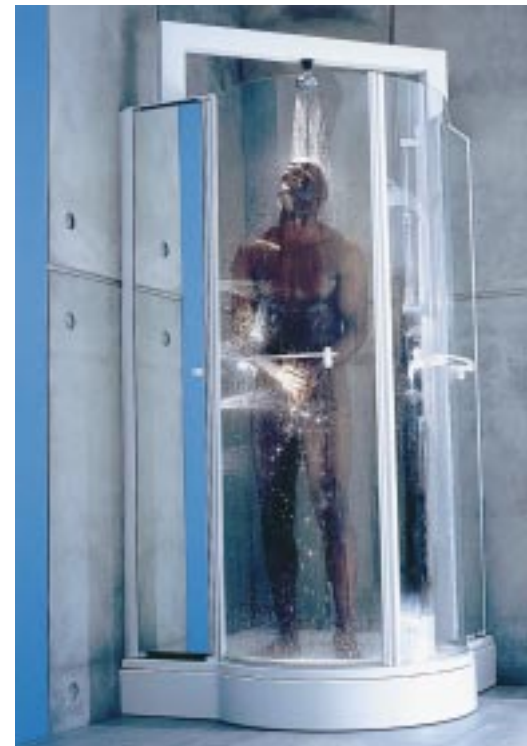
Symmetrische Duscheinheit Menhir von Hoesch

Auf die Armaturenserie abgestimmte Accessoires erweitern jetzt das Hansaronda-Gesamtprogramm. Die aus Messing gefertigte Kollektion umfaßt Teile für Waschtisch, Wanne, Dusche und den WC-Bereich. Ob Wandleuchte, Handtuchhalter oder Seifenschale – jedes einzelne Element der Linie greift das Design der Armaturenserie mit klaren Linien und sanften Rundungen auf und führt es fort. Erhältlich sind die Accessoires in diversen Farben, in Chrom,