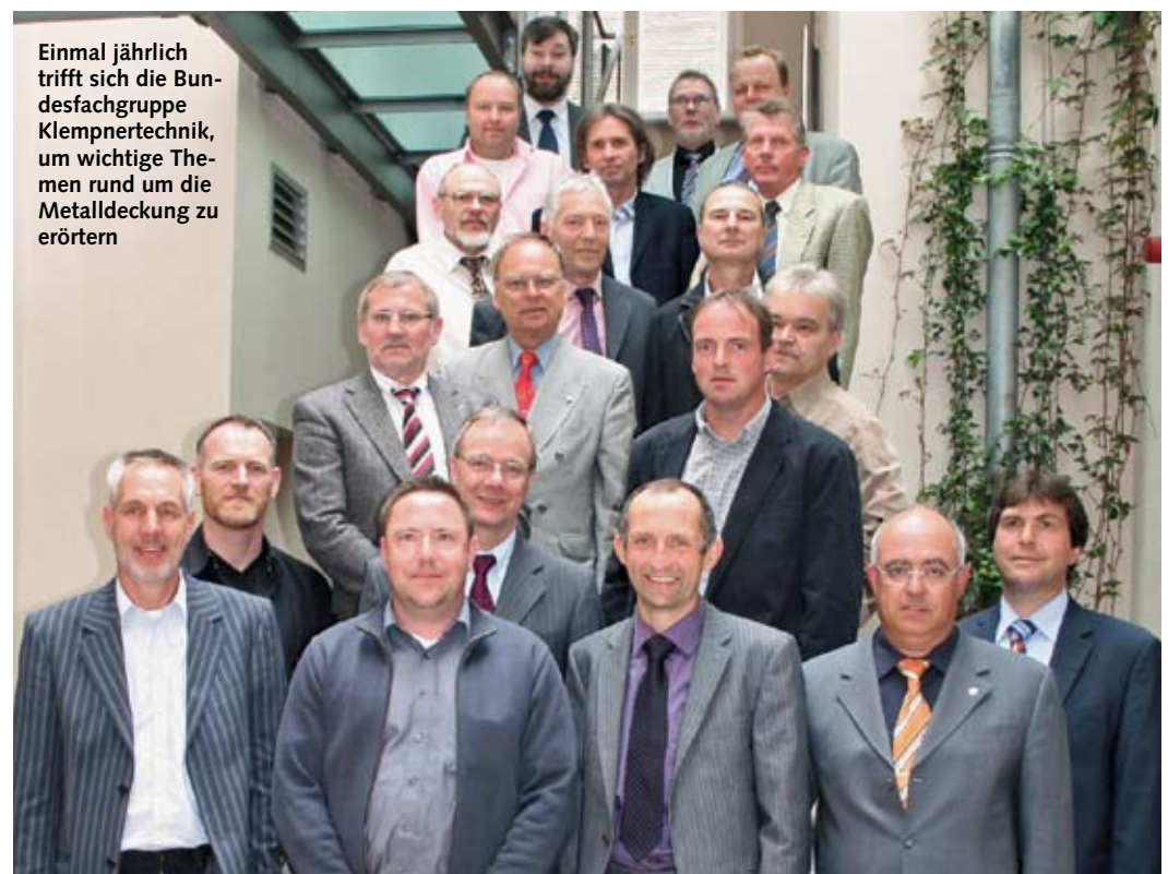
Einmal jährlich trifft sich die Bundesfachgruppe Klempnertechnik, um wichtige Themen rund um die Metalldeckung zu erörtern

Die Auftragslage sieht für viele Klempnerbetriebe derzeit noch gut aus. Handelt es sich dabei jetzt um größere Aufträge, war die Vergabe jedoch bereits im vergangenen Herbst. Gebe es derzeit überhaupt ein größeres Projekt mit einem Auftragsvolumen von