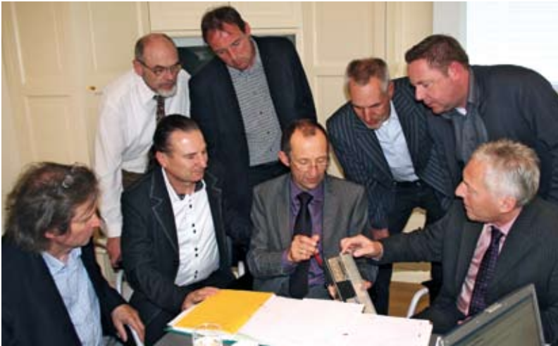
Anschauungsunterricht: Der neue Wirrgelegehaft macht Schluss mit uner- wünschten Wölbungen, die sich sonst oftmals in den Scharen bilden

die abschließende Dokumentation einschließen zu können. Die Bufa sprach sich dafür aus, weitere zwei Tage für die Meister-schüler vorzusehen, damit der gesamte Prüfungsumfang in nunmehr sechs Tagen realisiert werden kann. Entsprechende Empfehlungen werden dazu an die Prüfungsausschüsse herausgegeben.